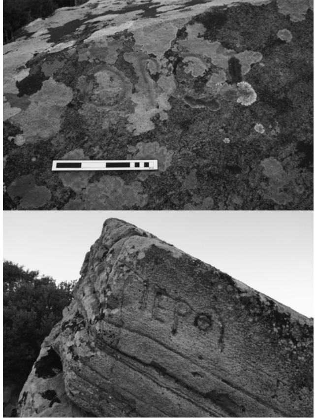
Resim 8: Poyraz kırsal alanına ait yazıt.

Yukarıda sözünü ettiğimiz, Poyraz ve Köytepe mevkiilerinde bulunan olası iki kırsal tapınak Erythrai ve Klazomenai yerleşimlerinin khora 'larının olası sınırında yer alırlar. Köytepe'nin Neolitik Dönem'den itibaren kullanılan bir alan olduğu düşünüldüğünde, olası tapınak yapısının bu tepe üzerine inşa edilmesi polis toplulukları açısından da bu alanın kadim bir değeri olabileceğini akla getirmektedir. Ayrıca Antik Dönem'deki olası yol ve patikalar açısından düşünüldüğünde de iki yerleşim arasında oldukça sık kullanılan önemli bir noktada konumlandığı belirtilmelidir. Şayet bu yapı gerçekten de düşündüğümüz gibi Zeus Olympios Tapınağı'na ait ise yarımada