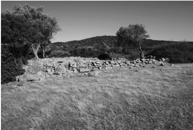
Resim 4: Poyraz mevkiinde belgelenen olası kırsal tapınak yapısının planı ve genel görünümü.

Poyraz Mevkii Urla İlçesi'ne bağlı Kadiovacık köyünün 4 km kadar Kuzeydoğu'sunda yer alan bir ovadır (Resim 4). Etrafı yüksek tepelerle çevrili ovaya Kadiovacık ve Barbaros köylerinden dar bir boğaz takip edilerek ulaşılmaktadır. Bu alanda yapılan yüzey araştırmaları sonucunda yüzey buluntusunun Arkaik Dönem'den Roma Dönemi'ne dek kesintisiz kullanıma işaret ettiği anlaşılır. Yaklaşık olarak 15 ha'lık bir alanda yüzey buluntusu oldukça yoğundur. Ovayı çevreleyen tepelerin batı yönünde bulunan tarım terasları izleri ve yüzey buluntuları bu alanın Roma Dönemi süresince tarımsal faaliyetler için kullanıldığını gösterir. Öte yandan ovada yüzey buluntusunun yoğun olduğu kısımda 20 x 15 m ölçülerinde bir yapıya ait olan düzgün blok taşlardan inşa edilmiş duvar temelleri ve mimari parçalar (Resim 5) saptanmıştır. Hemen yakınında yapay bir gölet bulunan bu alan sıklıkla küçükbaş hayvanlar için otlak/mera