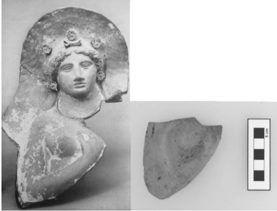
Resim 7: Poyraz'da yüzeyde belgelenen terrakotta figürin parçası ve British Museum'dan benzeri.

Akropolü'nün kuzey yamacında bulunan bir yazıt Daphnous'a sığınan isyancılar ile bir anlaşma yapıldığını ve isyancıların Atina karşısında yola geldiklerini açıkça ifade etmektedir (IG I 3 , 488).