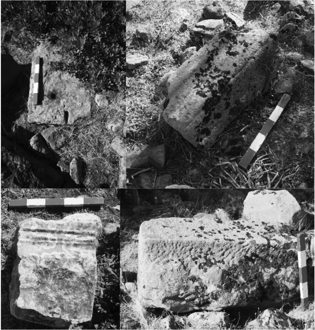
Resim 5: Poyraz'da yüzeyde belgelenen mimari parçalar.

ve su kaynağı olarak kullanılmaktadır. Yapının yakın çevresinde belgelenen yüzey buluntuları Arkaik Dönem'den Roma Dönemi'ne dek uzanan seramik buluntuların yanısıra mermerden bir heykel torsosu ile terrakotta bir figürin parçasını içerir (Resim 6-7). Terrakotta figürin parçası MÖ 5. yüzyıla tarihlenirken (Higgins, 1970, s. 50, fig. 295) aynı döneme ait çok sayıda siyah firnisli kap parçası yapının kullanım sürecini bu döneme tarihlemek için bir olasılık oluşturmaktadır. Alanda yapının kullanım evresinden daha geç bir tarihte yapılan tesviye, düzenleme çalışmaları sırasında çok sayıda yerel taştan yontulmuş mimari öge devşirme malzeme olarak kullanılmıştır. Teraslar ve Roma Dönemi seramiklerini göz önüne alırsak yapı o tarihte yıkıntı hâlinde olmalı ve blok taşları ile mimari parçalar ikincil kullanıma tabi tutulmuş olmalıdır. Mermer heykel torsosu, terrakotta figürin, Geç Arkaik-Klasik Dönem siyah firnisli seramikler ve mimari parçalar ile yapı blokları bu yapının anıtsal bir yapı ve kutsal alan olma ihtimalini destekleyen yegâne buluntular değildirler. Yapının bulunduğu noktanın 1 km güneydoğusunda bir kaya üzerine kazınmış olan