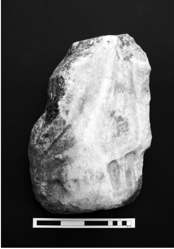
Resim 6: Poyraz'da yüzeyde belgelenen mermer heykel torsosu.