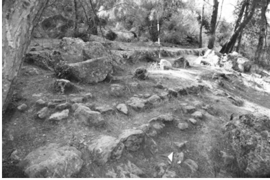
Resim 2: Batıdaki niřli duvar.