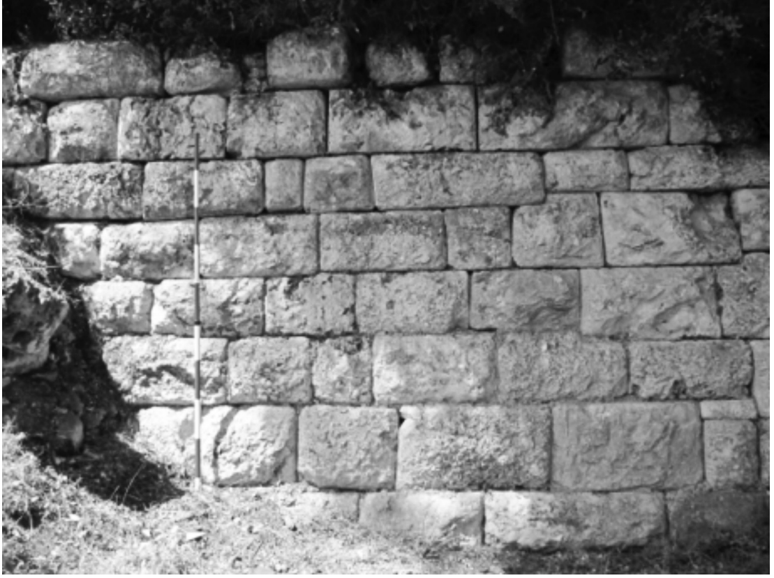
Resim 8: Metroon Doğu temenos duvarı.

Bu uzun terasın doğusunda, yine yamaç eğim yapmakta ve üstteki yapı kompleksi orada bir alt kotta bulunan başka bir duvar ile desteklenmektedir (Resim 8). Bu istinat duvarı alanının en sağlam yapısıdır ve yer yer 2-3 m yükseklikte ayakta koruna gelmektedir. Farklı boyutlarda olan bu ara alanda belirli aralıklarda kısa dikey istinat duvarları görünmektedir.