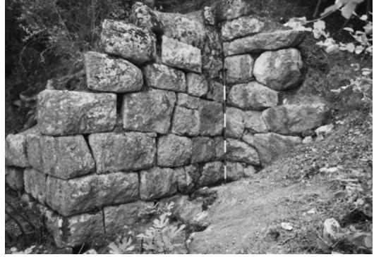
Resim 1: Metroon Batı Temenos duvarı.