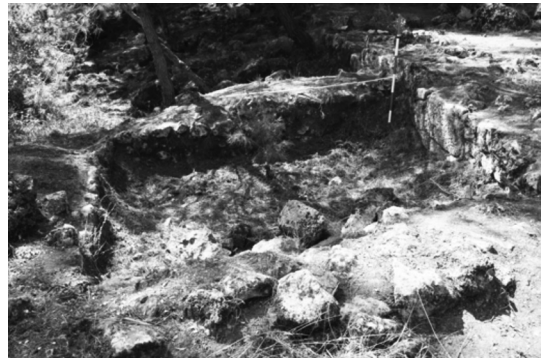
Resim 7: Metroon mekânların bir temel örneği (Kolophon Yüzey Araştırması arşivi).