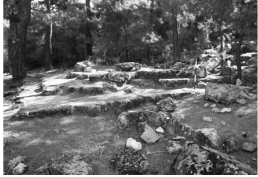
Resim 3: Büyük basamaklı altarn kalıntıları.