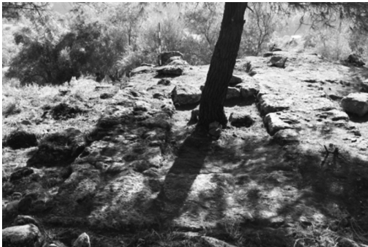
Resim 6: Metroon mekânların bir temel örneği.