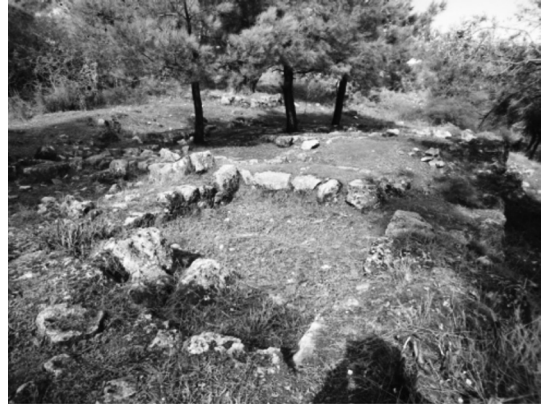
Resim 5: Küçük mekânların temelleri.

Üst terasının doğu sınırı boyunca devam eden uzun bir veya çift sıra bitişik mekân temelleri göze çarpmaktadır (plan.1, res.5 ; Bruns-Özgan, 2017, s. 107). Ortalama 2,50x2,50 metre boyutlarında, yaklaşık toplam sayıları olasılıkla 20 ile 30 arasındadır (14 tanesi mevcuttur). En çarpıcı özellikleri temellerin kalınlığıdır. Harçsız büyük blok taşlar kullandığı bazı temel duvarların kalınlığı mekânların küçüklüğüne karşın 1,50 m'ye ulaşmaktadır. Bunun yanı sıra, temel duvarları 40 ile 50 cm arasında olup hemen hemen aynı yüksekliktedirler (Resim 6 ve 7). Bu durum, mekânların temellerinin taştan, üzerindeki duvarların ise organik bir malzemeden, muhtemelen kerpiçten yapıldığı göstermektedir. Mekânların veya temellerin diğer önemli bir özelliği, girişlerinin olmamasıdır. Anlaşılan odalara yukarıdan, muhtemelen bir merdiven ile girilmektedir. Dolayısıyla birbirine yakın boyutlarıyla yan yana dizili bu küçük fakat kalın duvarlarla korunan odacıkların işlevi sorgulanmalıdır.