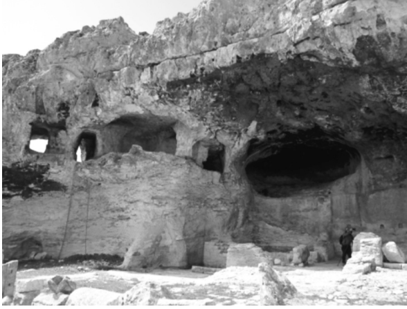
Resim 2: Alahan Genel Görünüm.

olan İmparator Zeno'nun, 474-491 yılları arasındaki egemenliği süresince Isauria, Kilikya, Antiokheia hatta Kıbrıs'ta büyük inşaat faaliyetlerinde bulunmuştur (Gough, 1985, s. 21; Gough, 1972, ss. 199-212). Bu bakımdan Alahan Manastırındaki batı kilisesinin ve diğer birimlerin inşasında İmparator Zeno tarafından gönderilen yardımlardan yararlanılmış olmalıdır. Zeno'nun ölümüyle birlikte para kaynağının kurumasından sonra özellikle yapıların ön kısmında doğu-batı yönünde uzanan sütunlu yolun, doğu kilisesinin kabartmalarının yarım bırakıldığı düşünülmektedir (Gough, 1985, s.