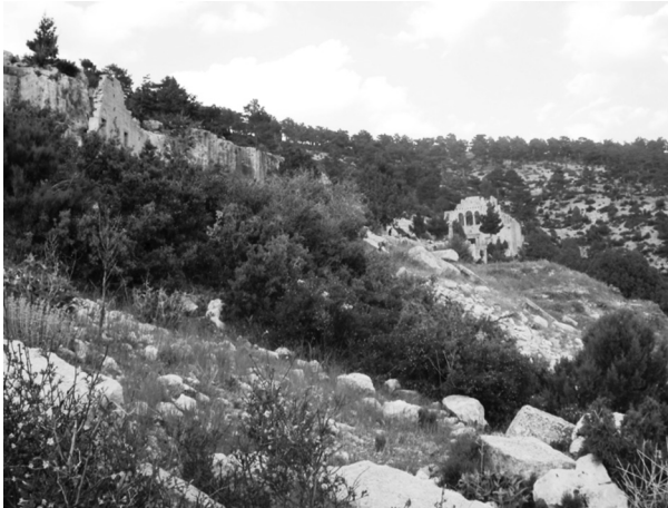
Resim 1: Alahan Genel Görünüm.

Yapı kalıntısından ilk söz eden, 1671 yılı civarında manastır kalıntısını ziyaret etmiş Evliya Çelebi olup; "Hala henüz mimar elinden reha bulmuş bir kal'a-ı cihannümadır ve gayet mamur