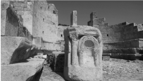
Resim 4: Apsis ve Altar.

Bemada mermerden işlenmiş bir sunak vardır (Resim 4). Yekpare taştan oyularak işlenmiş olan sunağın dört köşesinde sütunlar bulunur. Ayrıca sunağın her bir yüzünde de iki sütuna dayanan kemerli nişler olup, nişlerin üst kısmı deniz kabuğu şeklinde düzenlenmiştir. Altta kalan bölümlerde ise uçları damlacıklar sonuçlanan, İsa'nın çarmıha gerildiği Golgotha Tepesi'ni temsil eden üç basamaklı kaideler üzerinde yükselen haçlar betimlenmiştir.