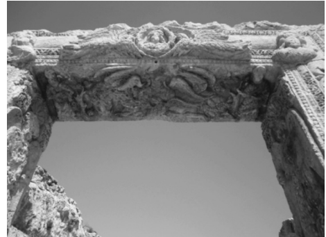
Resim 5: Batıdaki Kapı Çerçevesi.

İnşa edildiği 5. yüzyıl ortalarından günümüze sağlam olarak kalmış anıtsal kapı çerçevesi, narteksten kilisenin ana mekânına geçiş veren üç kapıdan ortadakine aittir. Kapı çerçevesi iki yanda dikey ve üstünde yatay dikdörtgen prizması şeklindeki toplam üç kesme blok taştan oluşur. Kapı çerçevesinin batı cephesi ve iç yüzeylerinde yoğunlaşmış olan figüratif anlatımlar yerel taş üzerine kazıma, kabartma ve oyma tekniklerinde çalışılmıştır. Eski ve Yeni Ahit'te anlatılan farklı dinsel olaylar ve görünüm burda taş üzerine işlenmiştir.