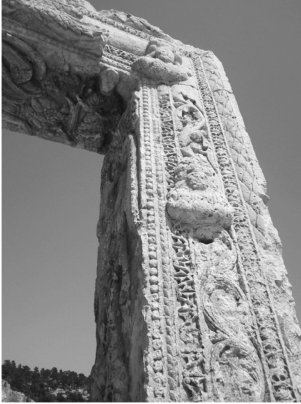
Resim 6: Batı Kilisesi Batı Portalindeki İncil Yazarı Tasvirleri Ve Silmeler.