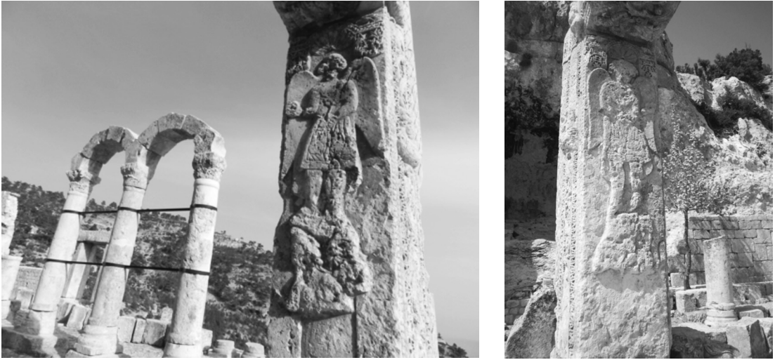
Resim 8: Başmelek Mikhael.