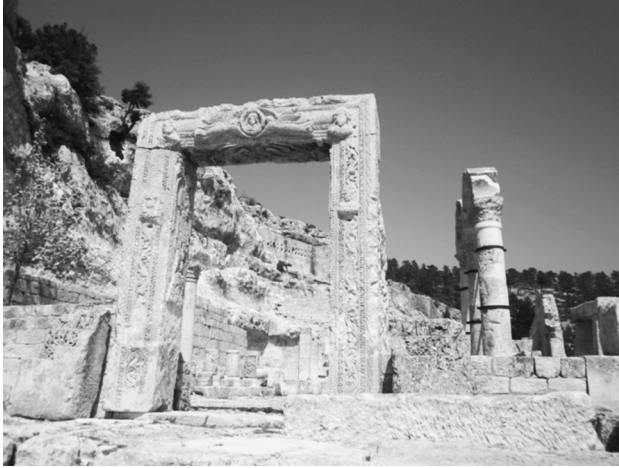
Resim 3: Batı Kilisesi.

Manastırın en doğusunda bulunan üçüncü kilise, manastırın en önemli ve gösterişli yapısıdır. Dörtgen biçimli yüksek kasnak üzerinde yükselen kubbesi dışında tüm duvarları sağlamdır. 6. yüzyıl ortaları veya 6. yüzyılın ikinci yarısında inşa edilmiş Doğu Kilisesi, kubbeli bazilikal plan şemasında inşa edilmiştir. Zengin ve oldukça kaliteli taş işçiliği bu yapıda da kapı çerçeveleri, sunak masası, sütun başlıklarında yoğunlaşmıştır.