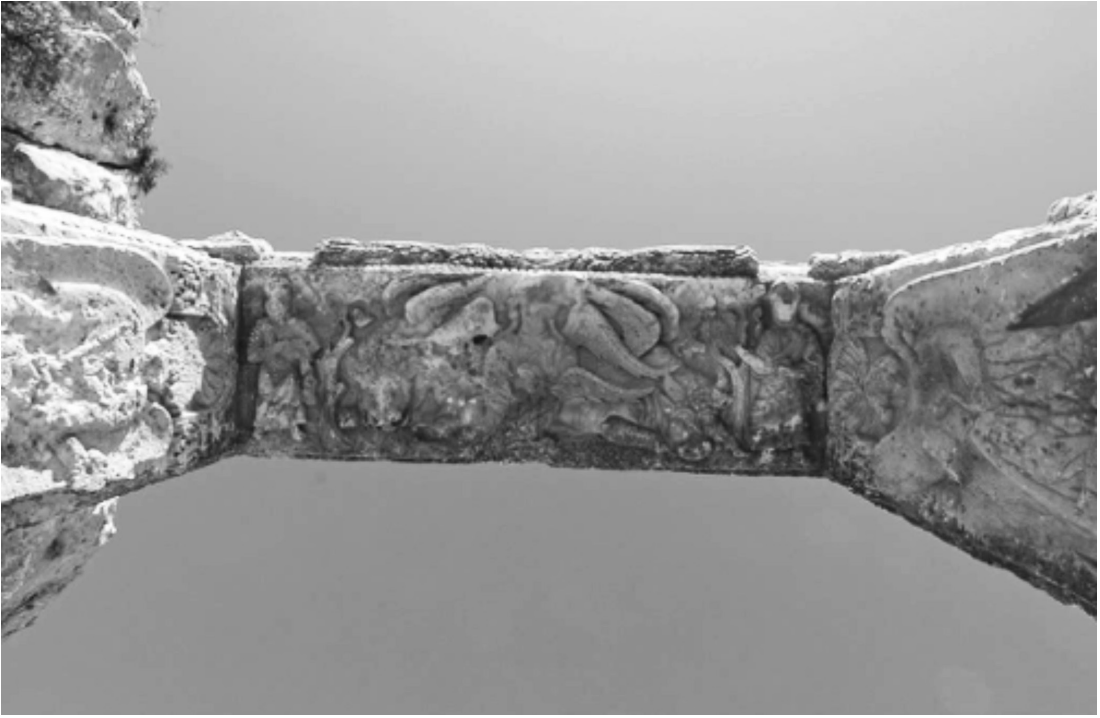
Resim 7: Batı Kapısının Lento ve Söveleri.