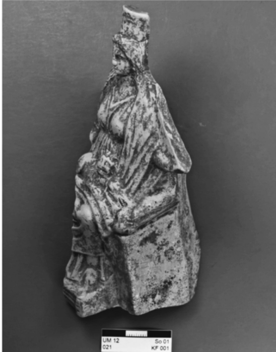
Resim 4: Pergamon Molla Mustafa Tepe buluntusu figürin.

Batı Anadolu Bölgesi kaya kutsal alanları arasına Tenedos adasının Hacı Mahmut Mevkii'nde tespit edilmiş kutsal alanı da eklemek gerekir. Ana kayanın oyulması ile oluşturulmuş, dikdörtgen oda biçimli, bir kaya tapınım alanı şeklinde tasarlanmış olan alanın güney duvarında oyulmuş 3 silmeli bir niş tespit edilmiştir