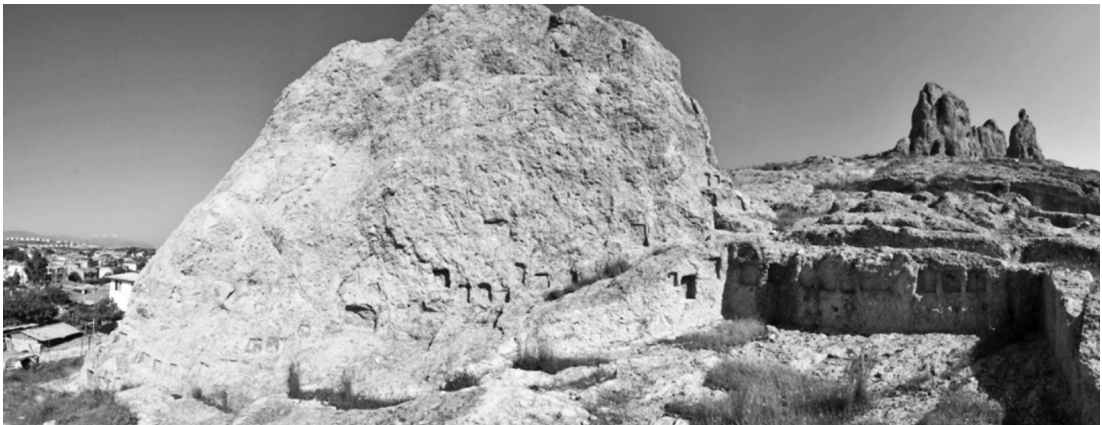
Resim 1: Phokaia Değirmenli Tepe Kaya Kutsal Alanı

Phokaia 'da tanrıçaya adanmış 5 adet kutsal alan ve MÖ 6. yüzyılın ilk çeyreğine tarihlenen adak kabartmaları ile tanrıçanın kültünün özellikle güçlü olduğu görülmektedir. İki antik ve modern kentin doğusundaki tepelerde, biri limanda, diğerleri ise adalarda tespit edilmiştir (Özyiğit, 2003, s. 118). Bu alanlarda herhangi bir yazıt bulunmamasına rağmen, niş içlerinde tespit edilen tanrıçanın standart ikonografisini tasvir eden kabartmaların varlığı ile tanrıçaya atfedilmişlerdir.