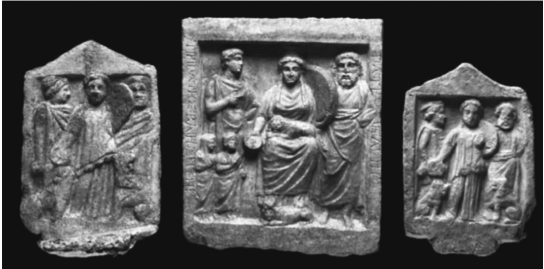
Resim 3: Ephesos Panayır Dağı'nda bulunmuş adak kabartmaları.

Ephesos Panayır (Pion) Dağı'ndaki Meter kutsal alanı, Phokaia gibi erken İonia niş tapınaklarından 5 Dağın dik yamacında çeşitli şekil ve boyutlarda yüzlerce kayaya oyulmuş nişler ile tespitleri yapılabilmektedir. Geç Klasik ve Helenistik dönemlere tarihlenmektedirler ancak,