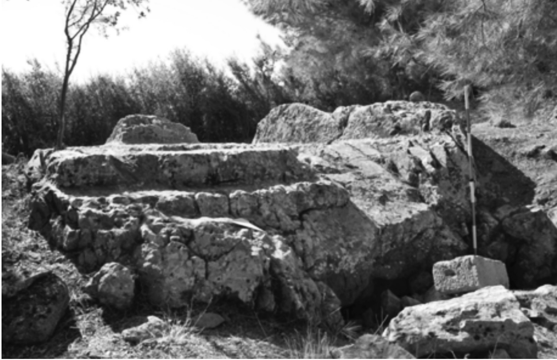
Resim 6: Kolophon Kaya Sunağı

Bölgedeki Ana tanrıça açık hava kutsal alanları arasında kaya sunaklarını ayrı bir kategori olarak incelemek mümkündür. Kaya oyma nişlerden farklı olarak kayalık alanlarda oluşturulan sunakların merkezini oluşturduğu kutsal alanlara Sakız Adası (Khios), Kolophon ve Ephesos'ta tespit edilmiş alanlar örnek verilebilir.