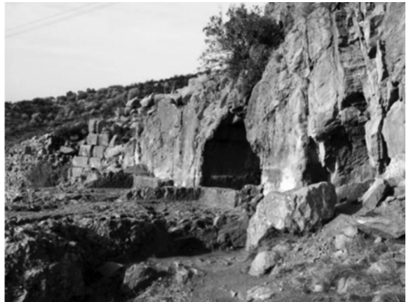
Resim 5: Pergamon Mağara tapınağı.

Kentin kuzeydoğu yamacında 2008 yılında yapılan çalışmalar sonucu yeni bir kutsal alan daha tanımlanmıştır ve doğal oluşum bir mağarayı da içeren kaya formasyonlarının düzenlenmesi ile oluşturulmuş geniş bir alanı kapsayan kompleks bir yapıya sahiptir. Alanın kuzey batı kısmında kaya oluşumları üzerine oluşturulmuş alanda ele geçen buluntular, alanın bu kısmının MÖ 2. ve 1. yüz yıllar ağırlıkta olmak üzere Hellenistik Dönem'de Meter kutsal alanı olarak kullanıldığını işaret etmektedir (Pirson, Ateş ve Engels, 2015, s. 287). Alanın kuzey kesiminin kült alanlarına ev sahipliği yaptığına dair en açık kanıtı, Mağara Tapınağı (Grottenheiligtum) olarak adlandırılan iki açık oda, bir koridor ve batıda bitişik iki mağaradan oluşan alan vermektedir. Mağaranın içi daha sonraki dönemlerde insan eli tarafından değişikliğe uğramıştır. Suyun mağaranın içine yönelmesini sağlayan bir düzenlemeye sahip olan mağara içinde ele geçen buluntular küçük bir kutsal envanter olarak yorumlanmıştır ve buluntuları ile MÖ 1. yüzyıl ile Augustus Dönemi arasına tarihlenmiştir. Kuzey mağarasındaki pişmiş toprak eserler, doğurganlığın birçok yönden ele alındığı Dionysiak bir çerçeveye girmektedir. Kutsal alanın hangi tanrıya atfedildiğini belirlemek mümkün değilse de buluntuları ile Hellenistik Dönem'in kutsal doğurganlık ve "Ana" kültü ile ilişkili bir çerçeveye sınırlandırılmaktadır (Pirson, Ateş ve Engels, 2015, s. 293) (Resim 5).