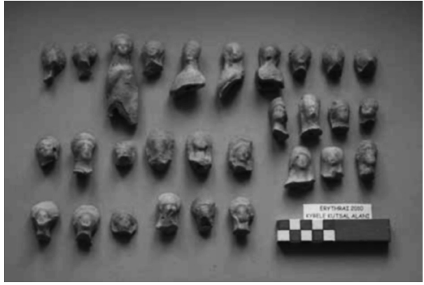
Resim 2: Erythrai'de bulunmuş figürin parçaları.

Erythrai tanrıçanın kutsal alanlarına dair erken dönem kanıtları veren bir başka antik kenttir. Tespit edilen üç farklı kaya oyma niş kutsal alanı kent merkezi dışında, ancak şehrin savunma sınırları içerisinde yer almaktadır (Erdoğan, 2006, s. 129). Bunlardan ilki, kuzey sur duvarı yakınlarında tek bir niş şeklinde alınlık ve sütunlar ile mimari cephe biçiminde dekore edilmiştir ve bu bağlamda Phryg uygulamalarına benzemektedir. İkinci kutsal alan ise Athena Tapınağı'nın bulunduğu akropol tepesinin güney ve batı yamaçlarında bir dizi nişten oluşmaktadır ve Arkaik Dönemden itibaren kullanım gördüğü bilinmektedir (Akalin, 2008, s. 4; Akalin, 2008a, s. 305). Son niş grubu ise bölgenin güneydoğusunda yine savunma duvarının yakınında tespit edilmiştir. Akropolün kuzeyinde yapılan çalışmalarda ele geçen buluntuların bir kısmı Hellenistik Dönem'e çoğunluğu Roma Dönemi'ne tarihlenmektedir. Buluntular arasında çok sayıda elini göğsüne koymuş ve başlarında taç ile tiara taşıyan kadın figürin parçaları dikkat çekicidir (Akalin-Orbay, 2012, s. 516) (Resim 2).