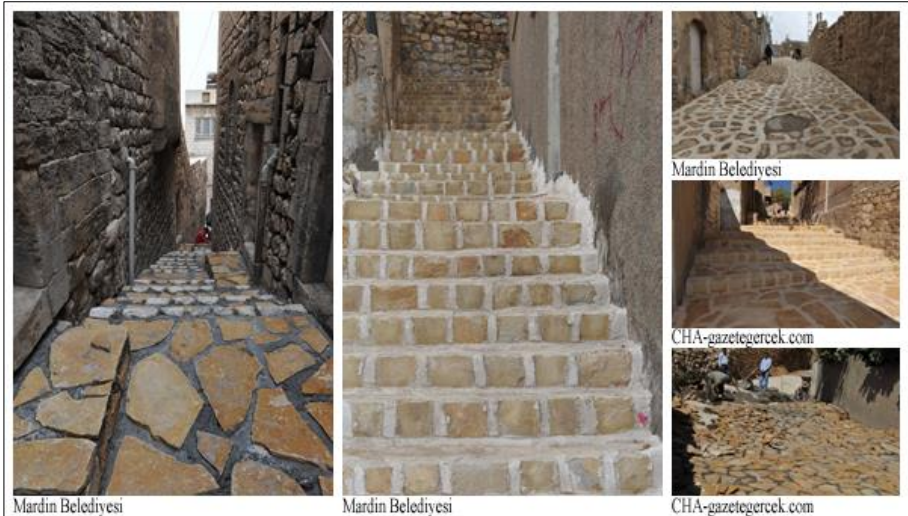
Şekil 7. Mardin Tarihi Dönüşüm Projesi kapsamında yapılan sokak yenileme çalışmaları

Sadece basit bir örnek için; Mardin Belediyesinin internet sayfasında Mart 2012'de yayımlanan bir haberde altyapısı tamamlandıktan sonra, betonun yerini alan, yöreye uygun ferş (kayrak) taşı ile kaplanarak yenilenen ve "herkesi hayran bırakan" (!) sokakları ele alalım. Betondan vazgeçilmesi güzel... Mimarbaşı Serkis Elyas Lole'nin veya Mardinli taş ustalarının duyarlılığını, sabrını ve ustalığını da bekleyemeyiz onlardan, bunu da biliyorum, ancak yapılan işin niteliğindeki dehşetin derecesini fazla söze gerek kalmadan gösteren bu yenilemeler (Şekil 7) yapılırken, her bir ustanın her bir taşı kesip ona şekil verirken, yerleştirirken ve etrafını sıvarken zamana duyduğu saygıyla var olan Mardin'e başını kaldırıp bir bakması, ondan feyzalması gerekmez mi? Mardin bunu hak etmiyor mu? Bu soruya cevabı da siz verin.