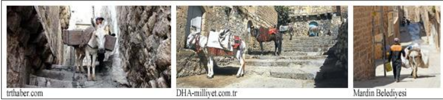
Şekil 2. Mardin'in dar, merdivenli sokaklarında her türlü taşımada kullanılan merkepler