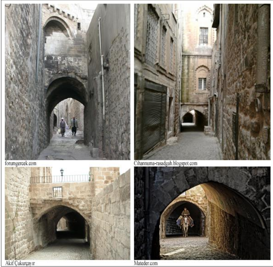
Şekil 3. Mardin'in kent dokusunda önemli işlevlere sahip abbaralar (Sol-üst resim: Forum Gerçek, 2010; Sağ-üst resim: Cihannuma, 2010; Sol-alt resim: Çukurçayır, 2009; Sağ-alt resim: Mardin Teknik Elemanlar Derneği [MATEDER], 2013)

Kara ikliminin yazın da kışın da geçmek, hafiflemek bilmez gaddarlığını, bu abbaralar yani üstü ve iki yanı kapalı iki yanı sokağa bakan kemerler, çok değil, bir parça katlanır kılar. Yazın serince olur damlarının altı, kışın da ılık. İşte bu merdivenli-abbaralı sokakların tamamı, sağlı sollu o herkesi zevkten keyiften yerinde duramaz hale getiren evlerle doludur; o sarı taşlı bol süslemeli evlerle.