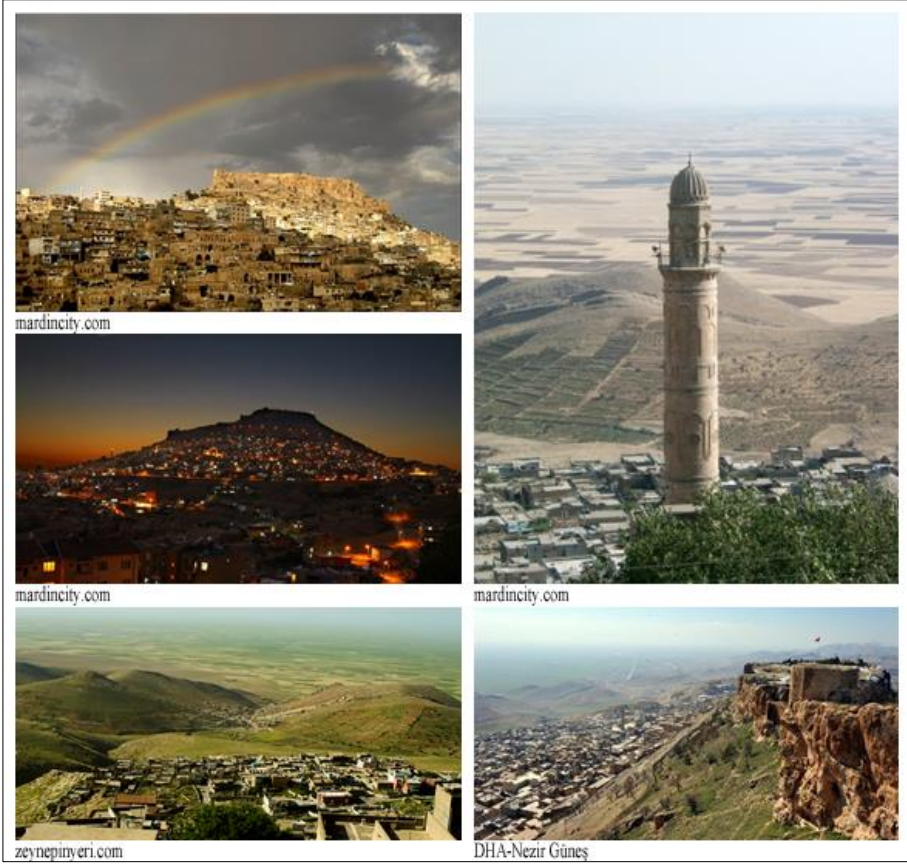
Şekil 1. Sol-üst iki resim: Ovadan Mardin'in gündüz ve gece silüeti; Sol-alt resim: Kalenin altından ovaya bakış; Sağ-üst resim: Ulu Cami arkasından ovaya bakış; Sağ-alt resim: Kalenin doğusundan kente ve ovaya bakış (Sol-üst iki resim: Mardincity, 2013a ve 2013b; Sol-alt resim: Zeynepinyeri, 2007; Sağ-üst resim: Mardincity, 2013c; Sağ-alt resim: Güneş, 2012)