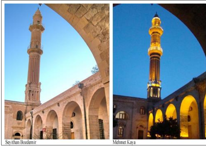
Şekil 5. Mimarbaşı Lole'nin şaheserlerinden Şehidiye Camii minaresinin gündüz ve gece görünümü (Sol resim: Bozdemir, 2009; Sağ resim: Kaya, 2008)