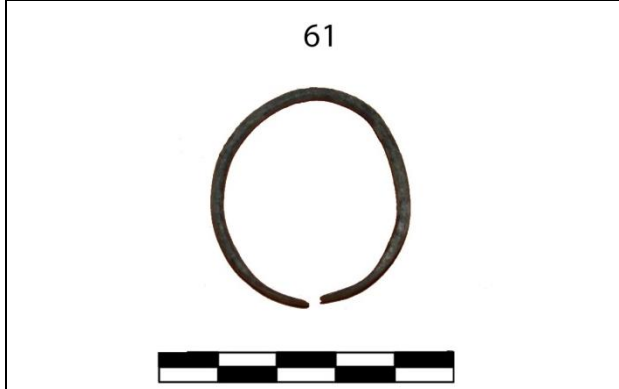
Res. 3: Env. 61 Halkası açık uçları düzleştirilmiş bilezik.