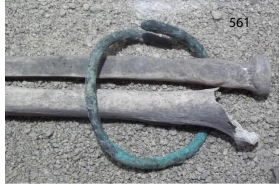
Res. 2: Env. 561 Halka biçimli ucu kapalı bilezik.