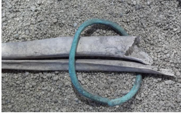
Res. 1: Env. 560 Halka biçimli ucu kapalı bilezik.