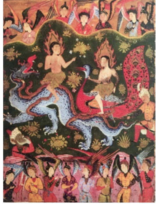
Resim 14: Hz. Âdem ile Hz. Havva'nın Cennetten Kovulması, Falname , Arthur M. Sackler Gallery, Washington D.C., s1986, y.251a (Farhad ve Bağcı, 2009, s. 98).

Bir diğer örnek ise, 16. yüzyılda, Kazvin'de hazırlandığı düşünülen bir Falname (Arthur M. Sackler Gallery, S1986.254) 41 kopyasında bulunur (Resim 13) (Lowry ve Nemazee, 1998, s. 126). Hz. Âdem ile Hz. Havva kompozisyonun ortasında ikisinin de başı haleli olarak, süslü bir taht üzerinde verilmiştir. Üstlerinde, ellerindeki tasta nur yağdıran iki melek görülür. Etraftaki meleklerden bazıları secde etmekteyken bazıları da hizmet etmektedir. Resmin sol üst köşesinde, tepenin gerisinde yaşlı ve sakallı bir adam kılığında betimlenen şeytanın ifadesi üzgün verilmiştir. Uzaktan onları izlemektedir. Cennetin dışında olduğu özellikle vurgulanmıştır. Başında sarık bulunur, ten rengi koyu, boynunda da yukarı doğru uzanan bir bağ görülür. 42