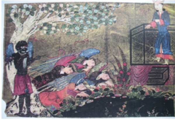
Resim 23: Meleklerin Hz. Adem'e Secdesi, Külliyyat-ı Tarih , TSMK B. 282, y. 16a (İnal, 1995, s. 119).

oğul isteyince Tanrı verir. Çocuk büyüyünce rüyasında onu boğazladığını görür. Oğluna bunu anlattığında çocuk karşı gelmez. Tam kurban edecekken melek bir kurban indirir. 52 Bir diğer Hadikatü's-Süeda kopyasındaki (PBN 1088, y. 20a) sahne ise kalabalıktır (Resim 22). İbrahim Peygamber ve oğlu İsmail başı haleli olarak sahnenin merkezindedir. İbrahim diz çökmüş olan oğlu İsmail'in boğazına bıçağı dayamış, o sırada gelen iki melek de ellerindeki kurbanları ona uzatmış biçimde betimlenmiştir. Burada farklı olarak koç gökyüzünden inmemiştir. Arkadaki üç melek hizmet halinde gösterilmiştir. İki figür ise tepenin gerisinden olayı izlemektedir. Şeytan sol üst köşede çok çirkin bir insan olarak tasvir edilmiş, farklılığı başlığı, teni ve tasması ile vurgulanmıştır.