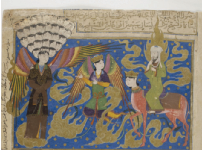
Resim 5: Bin başlı melek, Şah Ruh Miraçnamesi , PBN, supp turc.190, y.15a ( https://gallica.bnf.fr/ark:/12148/btv1b8427195m/f35.image 1.04.2020)