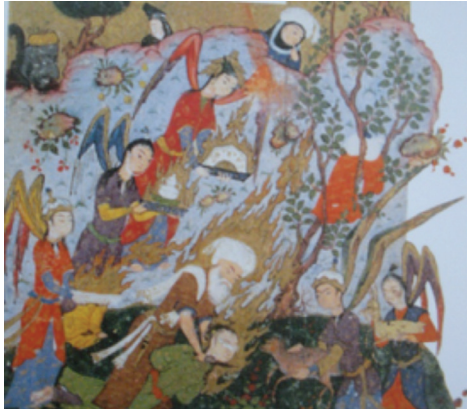
Resim 22: Hz. İbrahim'in Oğlunu Kurban Etmesi, Hadikatü's Süeda , PBN, supp Turc. 1088, y. 20a (And, 2007, s. 153).