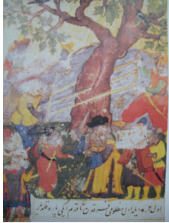
Resim 17: Hz. Zekeriya'nın Şehit Edilmesi, Hadikatü's Süeda , KMM, 101, y. 49a (Bağcı, 2003, s. 121).

Yaşlı adam suretine bir diğer örnek, Bağdat'ta 1604 tarihinde hazırlanan bir Hadikatü's Süeda 'da nüshasında (KMM, 101, y. 49a) bulunan, Zekeriya'nın şehit edilmesi hikâyesinde yer alır. Metinde, hükümdarın evlenmek için Zekeriya'nın oğlu Yahya'ya danışması, Yahya'nın reddetmesi üzerine kızın annesinin Yahya'ya kin tutması, sonunda hükümdarı kandırıp Yahya'yı öldürtmesi anlatılır. Bu olay sonunda Zekeriya'nın gazabından korkan hükümdar peşine adam takar. Hikâyede Zekeriya, haberi alınca sığınacak bir yer arar ve yüksekçe bir ağacın kovuğuna sığınır. Ancak şeytan Zekeriya'nın elbisesinin ucunu çekip dışarıda bırakır. Zekeriya'yı kovalayanlar geldiğinde şeytan bir ihtiyar kılığında girer ve soranlara Zekeriya'nın elbisesinin ucunu gösterir. Adamlar Zekeriya'yı çıkarmak isteyince şeytan, “eğer niyetiniz onu öldürmekse bu işi ağacın içinde yapmak daha hayırlıdır” deyip onlara yol gösterir, böylece Zekeriya şehit edilir (Fuzulî, 2003, ss. 83-89). Nakkaş şeytanı metinde bahsedildiği gibi Zekeriya'nın eteğini tutan yaşlı bir adam kılığında betimlemiştir (Resim 17).