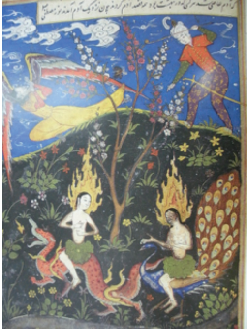
Resim 2: İnsan biçiminde bir melek, Nişapuri'nin Kısas-ı Enbiya TSMK H. 1228, y. 3b (Farhad ve Bağcı, 2009, s. 213).