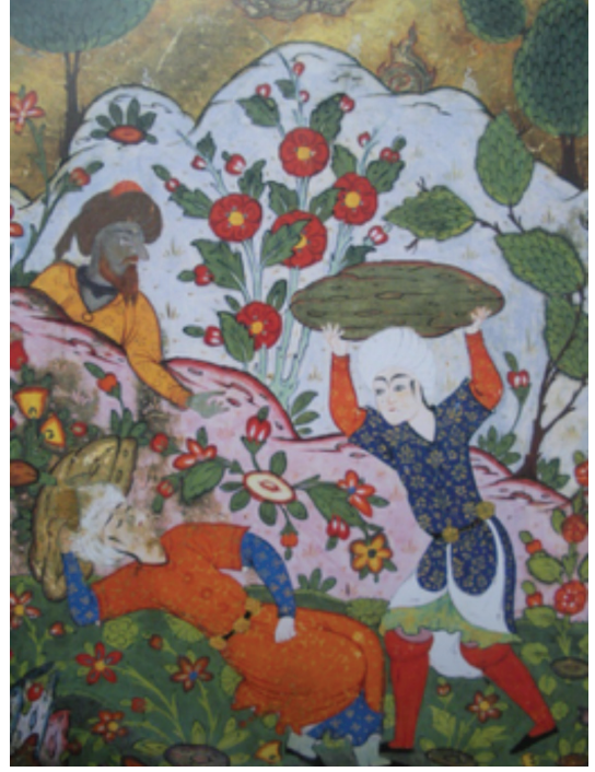
Resim 20: Rahip Barsisa'nın şeytan ile son kez konuşması, Sadi, Külliyat , TGM, No. 2174, (Rajabi, 2011, s. 131).