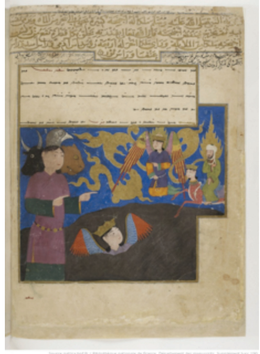
Resim 4: Dört başlı melek, Şah Ruh Miraçnamesi , PBN, supp turc.190, y. 32b ( https://gallica.bnf.fr/ark:/12148/btv1b8427195m/f70.item ; 31.03.2020)

Melek suretleri, özellikle edebî türde hazırlanmış resimli elyazmalarında, takdim sayfalarında tahtında oturan sultanı, hükümdarı ya da peygamberi korumak için ve metnin içinde ise iyiliği, doğruluğu ve ilhamı anlatmak için betimlenmiştir. Takdim sayfalarındaki bu tasvirlerde sayfanın üst kısmında genellikle nur saçarak şekilde kanatlı olarak son derece süslü kıyafetler içinde ve cinsiyetsiz olarak betimlenirler 29 (Resim 6). Bazen de takdim sayfalarındaki bu kompozisyon, yazarların kendilerini göksel varlıkların yani ilahî güçlerin koruması altına alma isteği şeklinde yorumlanabilir. Örneğin, Pseudo-Galen'in (ö. 216) Hekim Andromakhos'un maceralarını anlattığı eseri, 12. yüzyılda İslam yazarları tarafından çevrilerek Kitabü'l-Tiryak 30 adıyla kopyaları hazırlanmış, bunlardan Paris nüshasında (Arabic 2964), dolunayın etrafını çevreleyen iki iç içe geçmiş yılan, bunlara eşlik