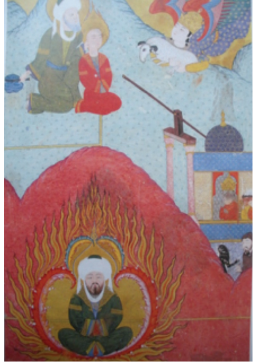
Resim 26: KHZ. İbrahim'in Ateşe Atılması, Zübdetü't Tevarih , TİEM 1973, y. 266a, (And, 2007, s. 151).

itilmiş gibi yılan ve tavus kuşu ile birlikte verilmiştir. Şeytan kara ve kuru başında kırmızı bir başlıkla verilmiştir. TİEM'deki şeytan görülmekle beraber, SK'deki şeytan tasviri tahrip edilmiştir.