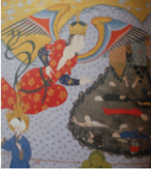
Resim 3: Sodom kentini üzerine kaplayan melek, Zübdetü't-Tevarih . TİEM, 1973 (And, 2007, s. 210).

dinî-tarihi-edebî bir tür olarak ortaya çıkan Kısas-ı Enbiya 'lardan 24 Nişapuri'nin (ö. 1035) kaleme aldığı, 1570 sonları 1580 başlarında İstanbul ya da İran'da Safevi döneminde hazırlandığı düşünülen bir nüshasında (TSMK H. 1228, y. 3b) (Resim 2) Âdem ile Havva'nın cennetten kovulma sahnesinde 25 melek, başında sorguçlu sarığı ve süslü elbiseleriyle, insan biçiminde betimlenmiştir (Farhad ve Bağcı 2009, s. 213).