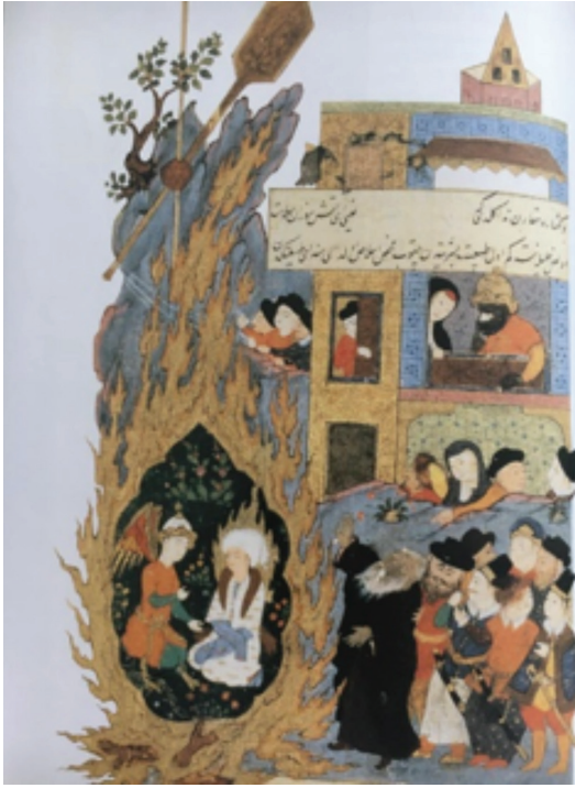
Resim 16: Hz. İbrahim'in Ateşe Atılması, Hadikatü's Süeda , PBN 1088, y. 17a (And, 2007, s. 158)