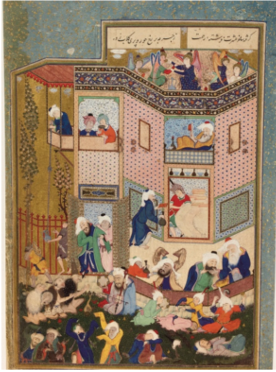
Resim 11: Sarhoşların meclisi, Hafız Divanı , Harvard University, Art Museums, Arthur M. Sackler Museum, 1988.460.3 (Grabar, 2009, s. 92).