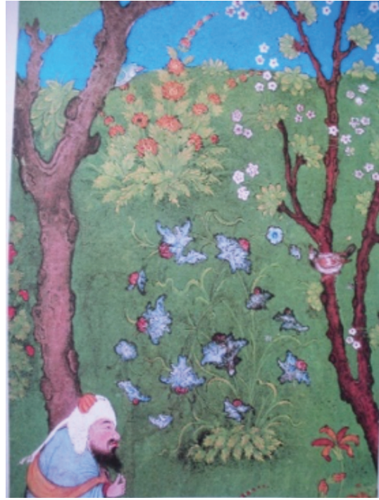
Resim 18: Şeytan'ın Kureyşli askerlere Hz. Muhammed ile Ebu Bekir'in gizlendiği mağarayı göstermesi, Siyer-i Nebi , TSMK H. 1223, y. 108a ( https://digitalcollections.nypl.org/items/510d47da-619c-a3d9-e040-e00a18064a99 ).