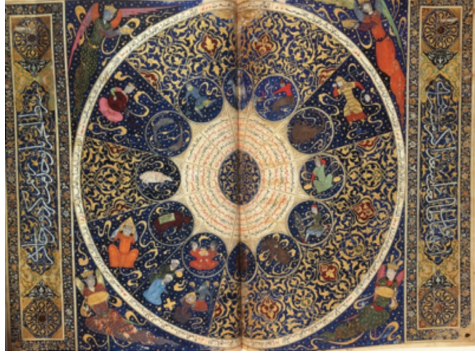
Resim 7: Takdim sayfasındaki melek tasvirleri, Galen, Kitabül Tiryak , 1198-99, PBN, Arabic 2964, y. 36 (Grabar, 2009, s. 55).)