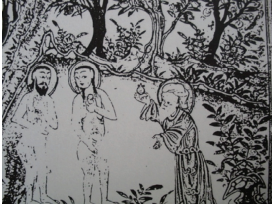
Resim 12: Hz. Âdem ile Hz. Havva'nın Şeytan Tarafından Kandırılması, El Asar-ı Bakiye , Edinburg Ü. Kitaplığı, Arab Ms. 161, y. 52 a (Soucek, 1975, s. 103).

Bu sahne batı sanatında sıklıkla tasvir edilmesine rağmen, doğu resminde çok örneği görülmez. En erken örneklerden biri, El Burunî'nin (ö. 1061?) yazdığı El Asar-ı Bakiye adlı eserin 14. yüzyılda hazırlanan resimli bir kopyasında (Edinburg Üniversitesi Kitaplığı, Arab MS. 161, y. 52 a.) yer alır. Minyatürde Hz. Âdem ile Hz. Havva'nın cennette meyveyi yedikleri an betimlenmiştir (Soucek, 1975, s. 103). Onların yanında, başında geleneksel Müslüman sarığı olan yaşlı adam, bir çift meyve sunar. Bazı araştırmacılara göre bu sahne ilk günahın Yahudi kaynaklarında geçen versiyonudur. İran mitolojisindeki kötü Tanrı Ahriman, yaşlı adam kılığında verilmiştir (Milstein ve Brosh, 1991, s. 25).