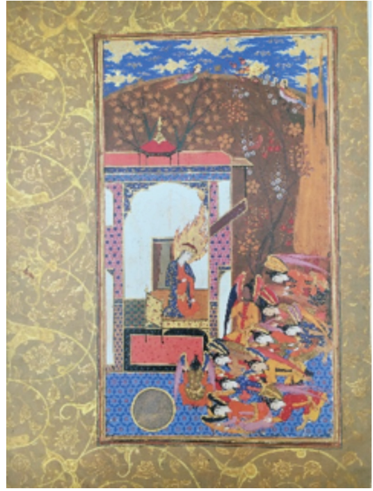
Resim 24: Meleklerin Hz. Adem'e Secdesi, Habib'üs-Siyer , TGM, No. 2237 (Rajabi, 2011, s. 187).

Taberî'de şeytanın cennete girişi ile ilgili benzer hikâye anlatılır. Yalnız burada iblisin cennete yılanın ağzında girdiği belirtilmiş, sonra yılanın ağzından çıkarak Âdem'e gözükmüş ve önce Havva'yı, sonra da Âdem'i kandırdığı anlatılmıştır. 58 Bütün bu metinler, nakkaşların şeytan tasvirlerinde kılavuz olmuştur. Bu konuyla ilgili sahneler Hadikatü's-Süeda 'nın resimli kopyalarında sıklıkla betimlenmiştir. Bunlar Süleymaniye Kütüphanesi (F.4321, y.9a) Türk İslam Eserleri Müzesi (T. 2967, y. 80) (Resim 25), British Museum (Or. 7301, y. 7b.) ve Paris Bibliotheque Nationale'deki (Sup. Turc., 1088, y. 9b) elyazmalarının içinde yer alır. SK, BM ve TİEM'deki minyatürler çok küçük farklarla birbirinden ayrılırlar. Kompozisyonun merkezindeki başları haleli Hz. Âdem ile Hz. Havva, metinde belirtildiği gibi incir yapraklarından oluşan etekleriyle çıplak olarak, cennet kapısından çıkarken gösterilmiştir. İblis ise sahnenin sol alt köşesinde, sanki cennetin dışına