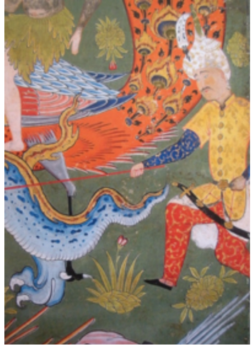
Resim 1: İnsan biçiminde bir melek, Falname , Arthur M. Sackler Gallery, Washington D.C., s1986, y. 251a (Farhad ve Bağcı, 2009, s. 98).

Örneğin 1550 sonları 1560 başlarında Kazvin'de hazırlandığı düşünülen bir Falname nüshasında (Arthur M. Sackler Gallery, Washington D.C., s1986, y.251a ) (Resim 1) (Farhad ve Bağcı, 2009, s. 98) ve geçmiş peygamberler ve Hz. Muhammed'in hayatını menkıbelerle süsleyerek anlatan