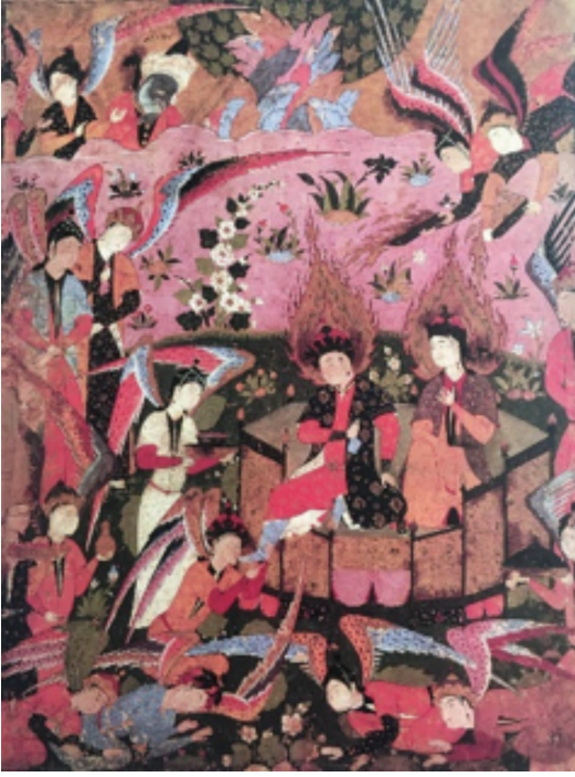
Resim 13: Meleklerin Cennette Hz. Âdem ile Hz. Havva'ya Hizmeti, Falname , Vever Collection (Lowry-Nemazee, 1988, s. 127).