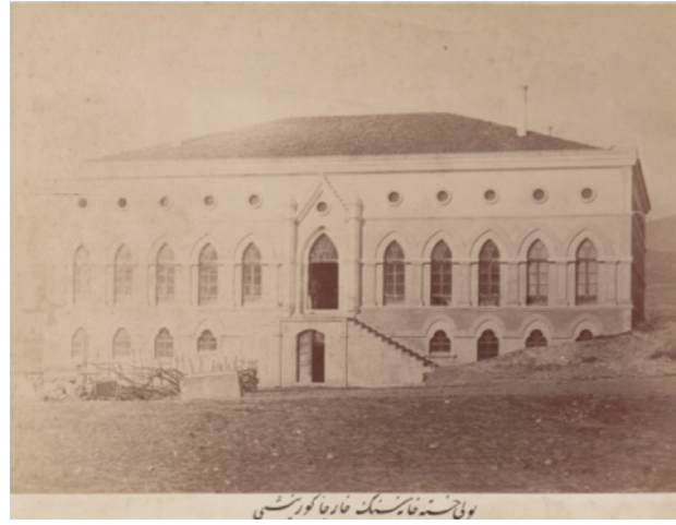
Fotoğraf 7. Bolu Frengi/Gurebâ Hastanesi'nin ön cepheden görünümü (Kaynak: BOA., FTG., No: 1726).

düzeninden oluştuğu anlaşılan hastanenin kat planları üzerinde “hamam, abdesthane, sofa, oda, koğuş, eczahane, doktor odası” gibi mekanlar bulunmaktadır. Yüksek bodrum kat üzerine tek katlı olduğu anlaşılan hastanenin neo-gotik düzendeki cephesi dikkat çekicidir. Oldukça simetrik olan cephede, bodrum kat pencerelerinde, üç dilimli kemer, birinci kat pencerelerinde ise sivri kemer kullanılmış; bu pencerelerin üstünde de yuvarlak, küçük pencere açıklıklarına yer verilmiştir. Ortada, çift yönlü basamaklarla ulaşılan, sivri kemerli giriş yer almaktadır. Cephedeki simetri plana da yansıtılmış; iç mekanda her iki katta da sofa ve koridor düzeni etrafında yer alan mekanlarla katı bir simetri oluşturulmuştur.