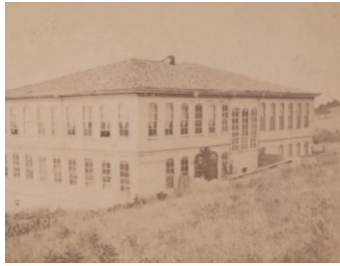
Fotoğraf 4. İnebolu Hastanesi'nin arka taraftan görünüşü. (Kaynak: BOA, FTG.f., No: 1634).