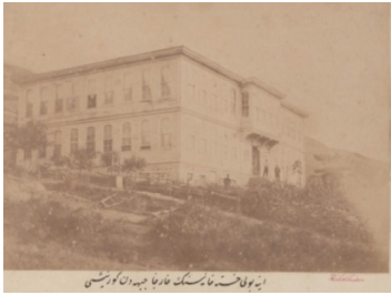
Fotoğraf 3. İnebolu Hastanesi'nin ön cepheden görünüşü. (Kaynak: BOA, FTG.f., No: 1635).

Hastane günümüze ulaşmamıştır. İnebolu Devlet Hastanesi'nin zemin katında sergilenen ki- tabe, hastanenin inşasına dair bilgi vermektedir (Çopur, 2012: 50). Kitabede, “Saye-i atûfet-vaye-i hazret-i padişâhîde devletlü Abdurrahman Paşa hazretlerinin valilikleri zamanında inşâ ve küşâd olunmuştur sene 1301” yazılıdır. Buradan da hastanenin 1885 yılında, Kastamonu valisi Abdur- rahman Paşa'nın valiliği zamanında inşa edilip açıldığı öğrenilmektedir.