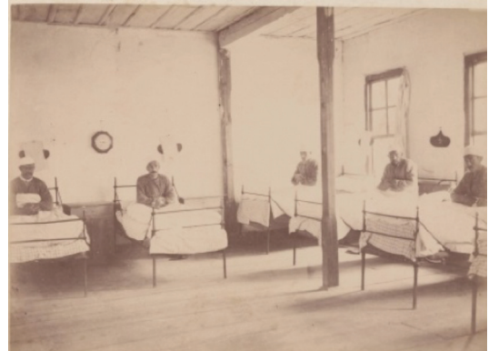
Fotoğraf 2. “Kastamonu Hastahanesi’nin tahtâni altı numaralı koğuşu” açıklamasının yer aldığı giriş katındaki erkekler mahsus koğuşu. (Kaynak: BOA., FTG.f., No: 1604).

Kastamonu merkezindeki, dönemin yazışmalarında geçen ifadeyle Frengi ve Gurebâ Hastanesi’nin mimarisine dair bilgiler sınırlıdır. Yeni baştan inşa edilip edilmediği de net değildir. Yazışmalarda inşa kelimesi kullanılmış olmakla birlikte “tesîs ve küşâd edilmiş olan” ifadesi daha yaygın geçmektedir ki bu ifade başka bir binanın bu amaçla kullanıldığını düşündürmektedir. Başlangıçta 30 yataklı olan hastane 45 yataklı olarak genişletilmiştir. Kargirden “mükemmel” bir hamamının olduğu bilgisi, hastaneye dair mimari tanımlamalardandır.