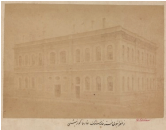
Fotoğraf 8. Safranbolu Frengi Hastanesi’nin arka cephesini gösteren eski bir fotoğrafı (Kaynak: BOA., FTG., No: 1751).

Hastanenin inşa edildiği dönemde bir bahçe içinde olduğu, sonraları Millet Hastanesi olarak 1960’lı yıllara kadar hizmet verdiği, daha sonra bahçesine devlet hastanesi yapıldığı belirtilmiştir (Barlas, 2015: 201; Tonbul, 2009: 179-182). Hastane binası bugün de geniş bir bahçe içinde yer almaktadır.