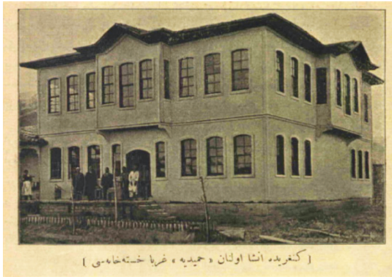
Fotoğraf 12. Çankırı Frengi ve Gurebâ Hastanesi. “Kengir’da inşa olunan ‘Hamidiye’ Gurebâ Hastanesi” açıklamasının yer aldığı fotoğraf (Kaynak: Servet-i Fünûn , Sayı: 283, R. 1 Ağustos 1312, M. 13 Ağustos 1896: 375).

Hastane hakkında kapsamlı bilgi, bir fotoğrafına da yer verilen Servet-i Fünûn’da yer almaktadır. Burada “ İşbu dârüt-tedavi îâne-i hamiyetdan ile iki yüz liraya mübâyaa olunup bilahare yüz