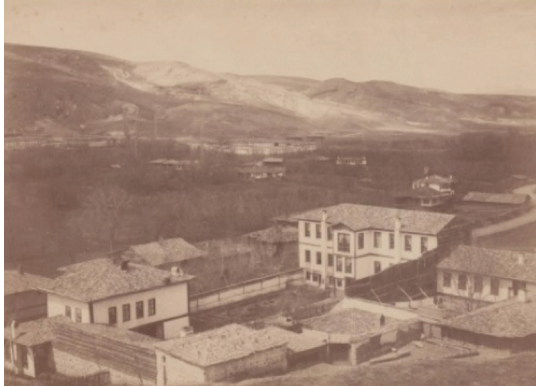
Fotoğraf 1. Kastamonu Hastanesi’nin genel görünümü.

Düring Paşa’nın raporunda da Kastamonu Vilayeti merkez hastanesi, “mezkûr vilâyet için pek ufak olduğundan herhalde 250 hasta istiab edebilir surette bir hastahane-i umûmisine tesîsi icâb eder” denilerek hastanenin vilayet merkezi için yetersizliği belirtilmiştir (BOA., İ.DH., 1366/56).