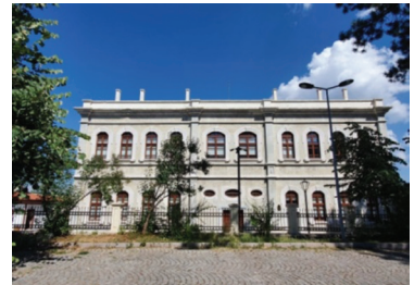
Fotoğraf 10. Hastanenin arka cephesi.