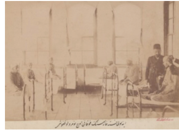
Fotoğraf 5. İnebolu Hastanesi'nin koğuşu. (Kaynak: BOA, FTG.f., No: 1636).

Gümümüze ulaşmayan hastane, eski fotoğraflardan tanınabilmektedir (Fotoğraf 3). Şehre nazır konumda, oldukça büyük ve gösterişli bir bina olduğu anlaşılan hastane binası, yüksek bodrum katı üzerine zemin katla birlikte iki katlı, doğu-batı doğrultuda dikdörtgen kurguda, kargir bir yapıdır. Bahçe içinde olduğu anlaşılan binanın kuzeydeki ön cephesi, orta aksında basamaklarla ulaşılan ana girişi bulunmaktadır. Girişin üstü, kossollara oturan cumba şeklinde düzenlenmiş ve ikinci katta bu kısım dört pencere boyunca öne çekilmiştir. Bu orta aksın iki yanında,