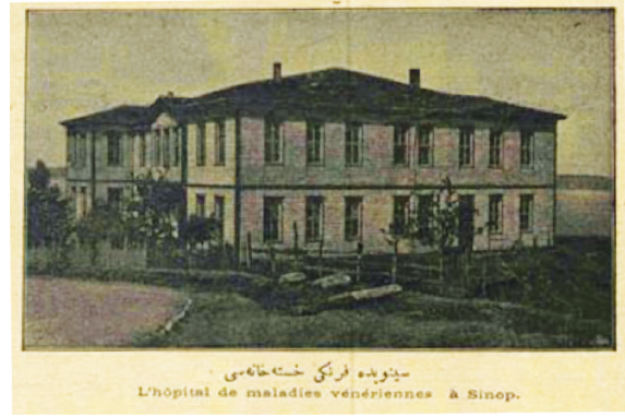
Fotoğraf 11. Sinop Frengi ve Gurebâ Hastanesi (Kaynak: Servet-i Fünûn , Sayı: 491, R. 27 Temmuz 1316, M. 9 Ağustos 1900, s.9).

Hastanenin açıldığı tarihte, Hazine'den tahsisat istenmiştir. Burada “ Kengiri kasabasında iâne-i ahali ile tesis ve küşâd edilmiş olan yirmi yataklı bir bâb gurebâ hastahanesinin temîn-i