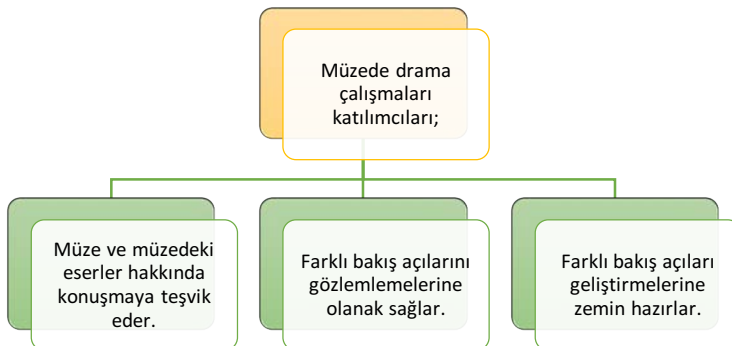
Şekil-1. Müzedeki drammanın farklı bakış açıların gelişimine katkısı