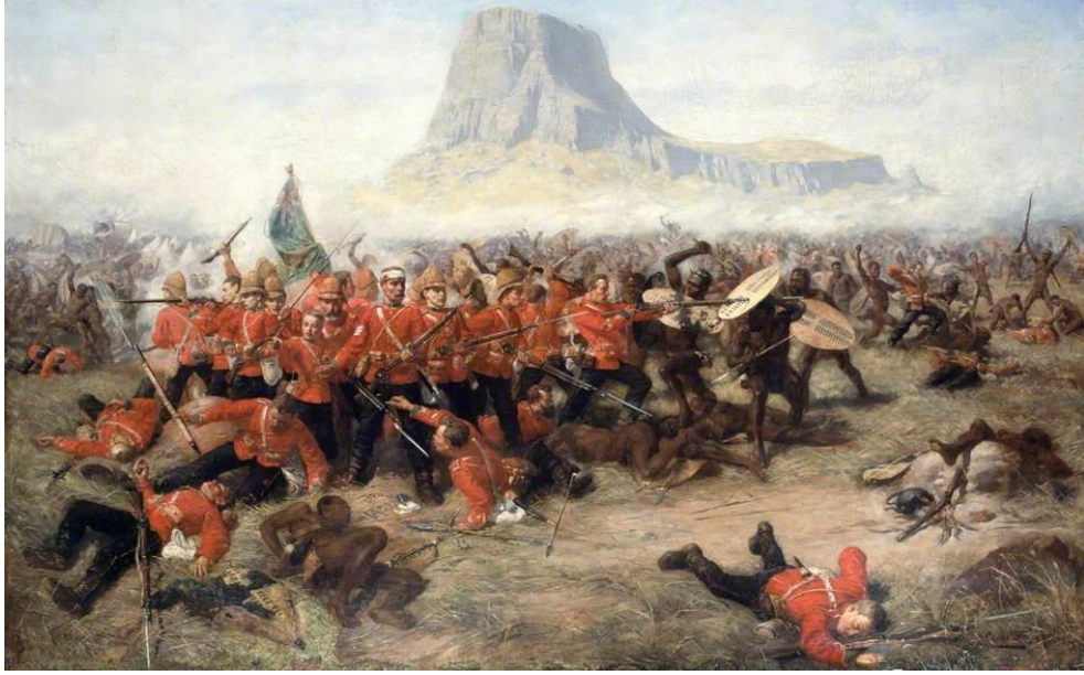
Görsel 1: Charles Edwin Fripp'in Battle of Isandlwana Adlı Tablosu.