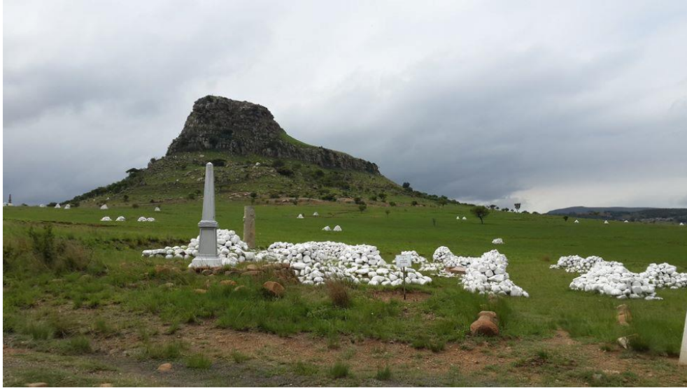
Görsel 3: Isandlwana Tepesi, Güney Afrika.

Üçüncü bölümde ise Fripp bizlere savaşın yaşandığı Isandlwana Tepesi'nin bir peyzaj çalışmasını sunar gibidir. Aynı zamanda bu manzaranın alt kısmı ile ana sahne arasına bir çizgi çekilerek belirgin bir ayırım yapılmıştır.