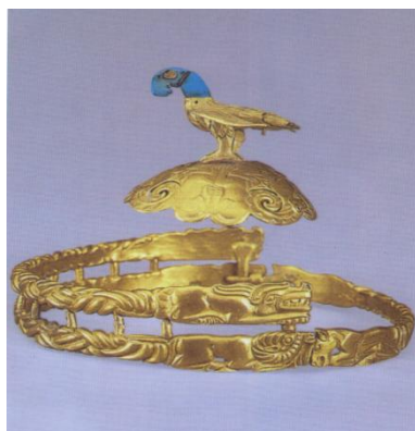
1-сурет. Арғы түрктен жұрттардың бірінің билеушісінің алтын тәжі мен тәтісі.Диаметрі 16,5 см,биіктігі 7,1см. Тәтінің айналма ұзындығы 60 см, салмағы 1202 г.

Ордостық қоңыр(ат)тардан мәңгілікті мұра болып қалған мәдениет ескерткіштері ЮНЕСКО-ның адамзаттың мәдени мұралары тізіміне енгізіліп, «Ордостық үлгідегі түздік мәдениет жәдігерлері» деген атпен ҚХР-ның бірқатар музейлерінде көрсетілімге қойылған. Солардың ішінде діні алтыннан, одан қалса күмістен жасалған қапсырмалар, ілмек-тоғалар, гривналар, сырға-жүзіктер, қару-жарақ қындарының қаптама әшекейлері, т.с.с. ерекше көз тартады. Дей тұрғанмен, ең таңдаулы экспонат ретінде Алтын тәж аталады (1-сурет).