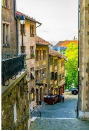
Resim 5. Cenevre'de Eski Şehre Giden Yol

İsviçre'de Cenevre Gölü kıyısında konumlanan Cenevre, Zürih şehriden sonra en yüksek nüfuslu ikinci şehridir (2017 yılı rakamları 198.979 kişi) (URL-10). Cenevre'de bulunan eski şehir merkezi, arnavut kaldırımları ile kaplanmış yolları, sokakları ve özgün kent karakteri ile dikkati çeken bir bölgedir (Resim 5). Böylesi karakterli kentsel yapı da yine üst sınıf bir peyzajın işareti olmaktadır.