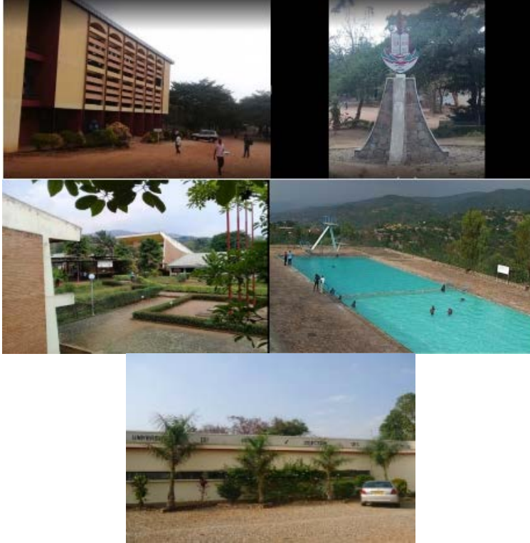
Resim 8. Bujumbura Kentindeki Burundi Üniversitesi, Bulunduğu Bölge İçin Umut Veren Açık Alan Yapısına Sahip

Raporunda Burundi dünyanın en mutsuz ülkesi olmuştur (URL-17). Bujumbura kentindeki Burundi Üniversitesi (University of Burundi) ülkedeki tek devlet üniversitesidir (Resim 8). Yapı çevresi peyzaj düzenlemeleri, genellikle sembolik ve minimal özellikte olup, standartlar orta düzeyde yeterliliği hedefleyen bir görüntü vermektedir.