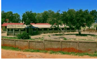
Resim 10. Maputo’da Bir Okul Ve Bahçesi

Ülkenin büyük çoğunluğunun baraka evlerde yaşadığı Mozambik’de, Maputo diğer şehirlere oranla daha fazla şehir görünümüne sahiptir. Yıllardır kullanılan, tamamlanmış bir okul binasının (Resim 10), olması gereken asgari koşullara sahip olmadığı görülmektedir. Nitekim ilkokul çağındaki çocukların çoğu aileleri tarafından çalıştırılmak zorunda ve okula gitme imkânlarına sahip olmaması, Afrika’da eğitim ve okuma-yazma oranının düşük olmasına neden olan temel faktörlerdendir (URL-21).