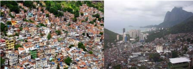
Resim 1. Rio de Janeiro Kentsel Sınıfsallığın İyi Bir Örneği

Günümüzde bu kentsel deformasyon dışardan da net olarak gözlemlenebilmekte, kent iki uçta sosyal ve ekonomik yapıyı ibret verici bir biçimde sergilemektedir (Resim1).