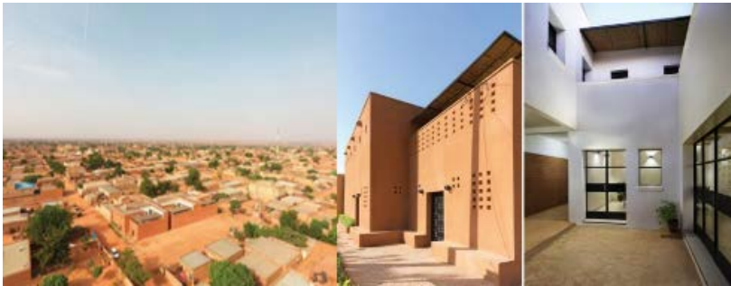
Resim 4. Niamey'de Konut Yetersizliğine Yerel Kaynaklarla Çözüm

Niamey'de konut yetersizliğine çözüm olarak, united4design ekibi tarafından üretilen yüksek yoğunluklu yeni bir kentsel konut modeli Niamey 2000 projesi hazırlanmıştır. Timbuktu, Kano ve Zinder gibi bölgenin sömürgecilik öncesi, yüksek yoğunluklu kentlerinden ilham alan, pişirilmemiş toprak işçiliği ve pasif soğutma teknikleri kullanılan proje Nijer'in yakıcı sıcaklarından korunurken, yerel kaynaklar ve malzemeler kullanarak, geniş bir kesime düşük maliyetli konutlar sağlamaktadır (İtez 2017) (Resim 4).