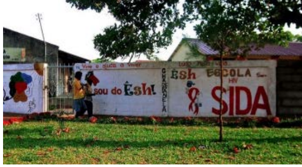
Resim 9. Mozambik’de Bir Grafiti Yazısı; “ Vive E Ajuda A Viver ” -Yaşayın Ve Yaşamaları İçin Yardım Edin