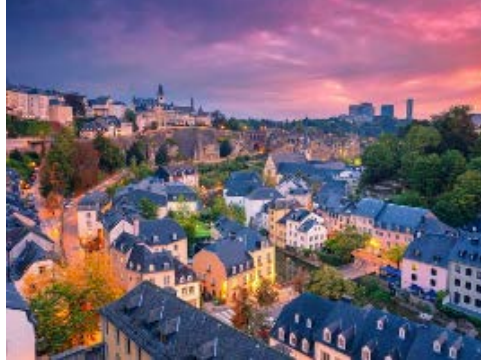
Resim 6. Batı Avrupa'nın gelişmiş bir ülkesi Lüksemburg