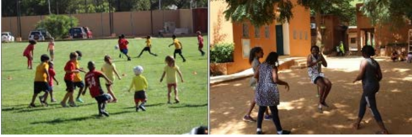
Resim 11. Niamey Uluslararası Amerikan Okulu