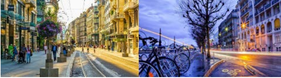
Resim 13. Kent İçi Güzergahların Cenevre’de Sunduğu Kalite