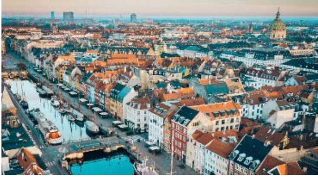
Resim 15. UNESCO Dünya Mimarlık Başkenti Kopenhag

Belediyenin “iklim değişikliğinin etkilerini azaltmak ve büyüme, kalkınma ve daha yüksek yaşam kalitesi ile daha düşük CO 2 emisyonlarını birleştirmenin mümkün olduğunu gösterme sorumluluğu olduğu” ifade edilmiş, 2025 yılına kadar dünyanın ilk karbon nötr başkenti olma hedefi konmuştur (URL-29).