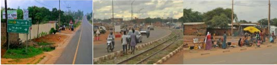
Resim 12. Maputo ve Nijer’de Kamusal Alan Durumu

Düşük gelirli ülkelerde kamusal alan standartlarının da oldukça düşük olduğu görülmektedir. Ana ve ara ulaşım ağları üzerinde en alt düzey zemin standartları sağlandığı, mekân organizasyonunun oluşturulmadığı, özel ya da kamusal alan bütünlüğüne dair bir süreklilik olmadığı da anlaşılmaktadır. Elbette böylesi bir ortamda, araç ve yaya oryantasyonuna işaret eden bir görüntüde elde edilememiştir (Resim 12). Mekân standartları yalnızca temel donatılara sahip olmamakla kalmayıp, bu eksiklikler nedeniyle güvenlik algısından da uzak olduğu ve hatta aksine suçu ve tehlikeyi mekanlaştıran, somutlaştıran bir zemin yarattığı içinde yerli ya da yabancı insan varlığı ve faaliyeti açısından daha da diplere inmektedir. Nitekim özellikle modern peyzaj anlayışının önemli bir parçası üst düzey ve/veya özgün bir kalite algısı ve bununla bütünleşen güven hissidir.