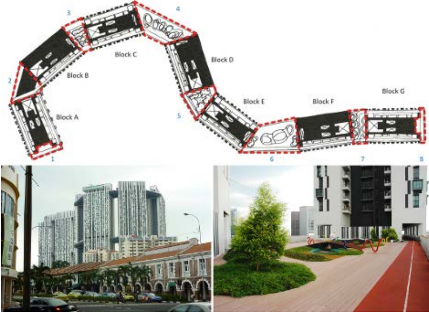
Resim 14. Gökyüzü Bahçelerinin (Singapur) Planı ve Kentteki Görünümü, En Büyük Bahçe Meadows Bahçesi