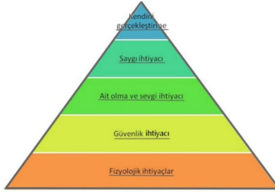
Resim 2. Maslow'un İhtiyaçlar Hiyerarşisi Teorisi

Fizyolojik gereksinimlerden başlayarak, güvenlik, ait olma, saygınlık ve kendini gerçekleştirmeye doğru daralan Maslow'un İhtiyaçlar Hiyerarşisi Teorisi piramidi (Maslow, 1943) (Resim 2), insani gereksinimlerin öncelik sıralamasını net biçimde göstermektedir. Esasında tüm toplumlara tüm insanlığa, temelde insani ihtiyaçlara yönelik yeme-içme gibi en temel fizyolojik taleplerin karşılanmadığı bir dünya düzeninden söz ettiğimiz bilinciyle yola çıkılması gerektiği de olayın bir başka yönüdür. Nitekim bu toplumların beklentisi de temelde tüm bu sıralamanın gerçekleşmesidir.