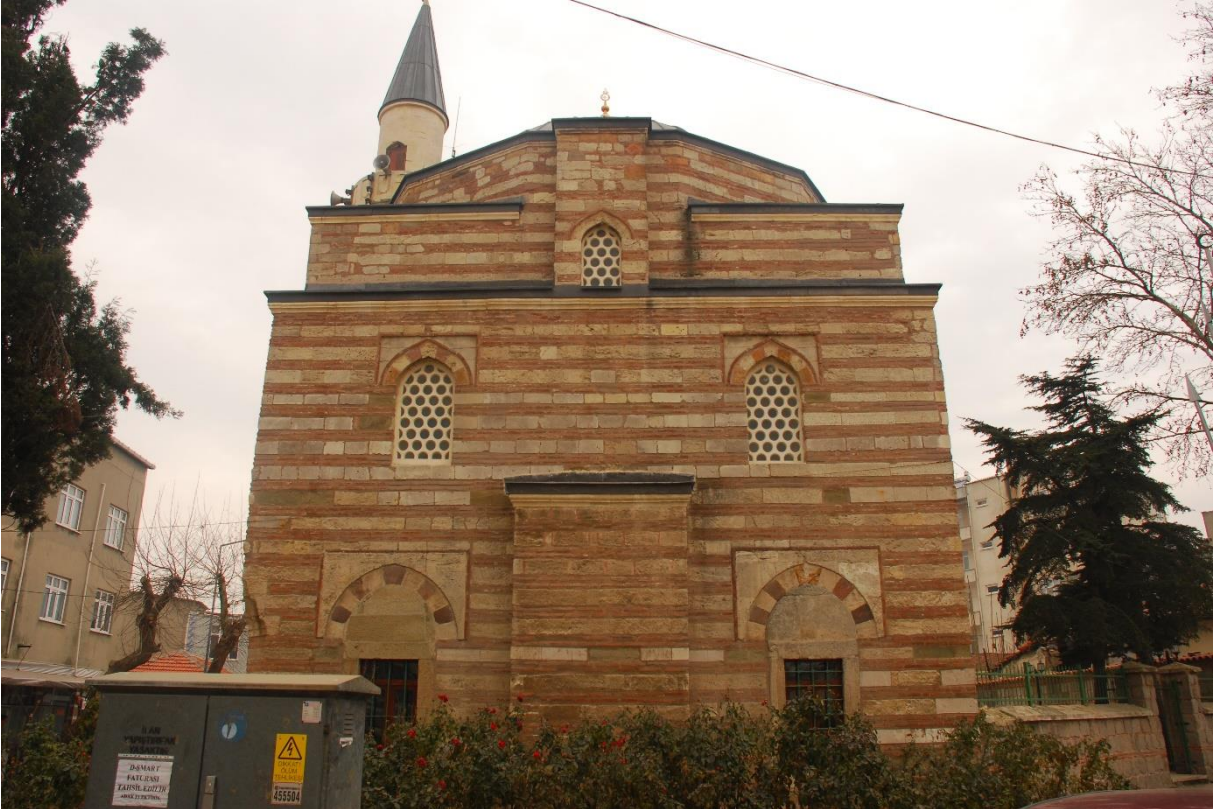
Res. 9: Alaca Mustafa Paşa Camii güney cephesi