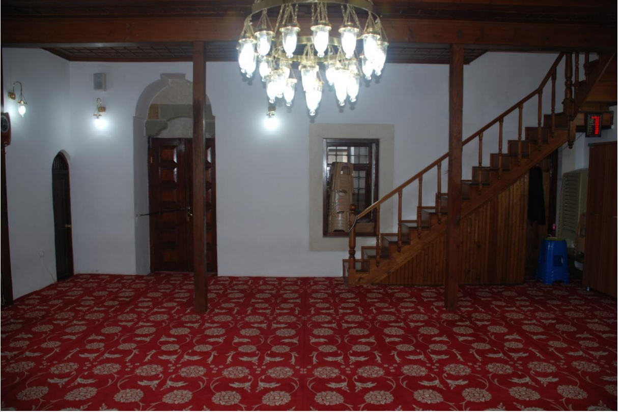
Res. 15: Alaca Mustafa Paşa Camii hariminden giriş cephesinin görünümü