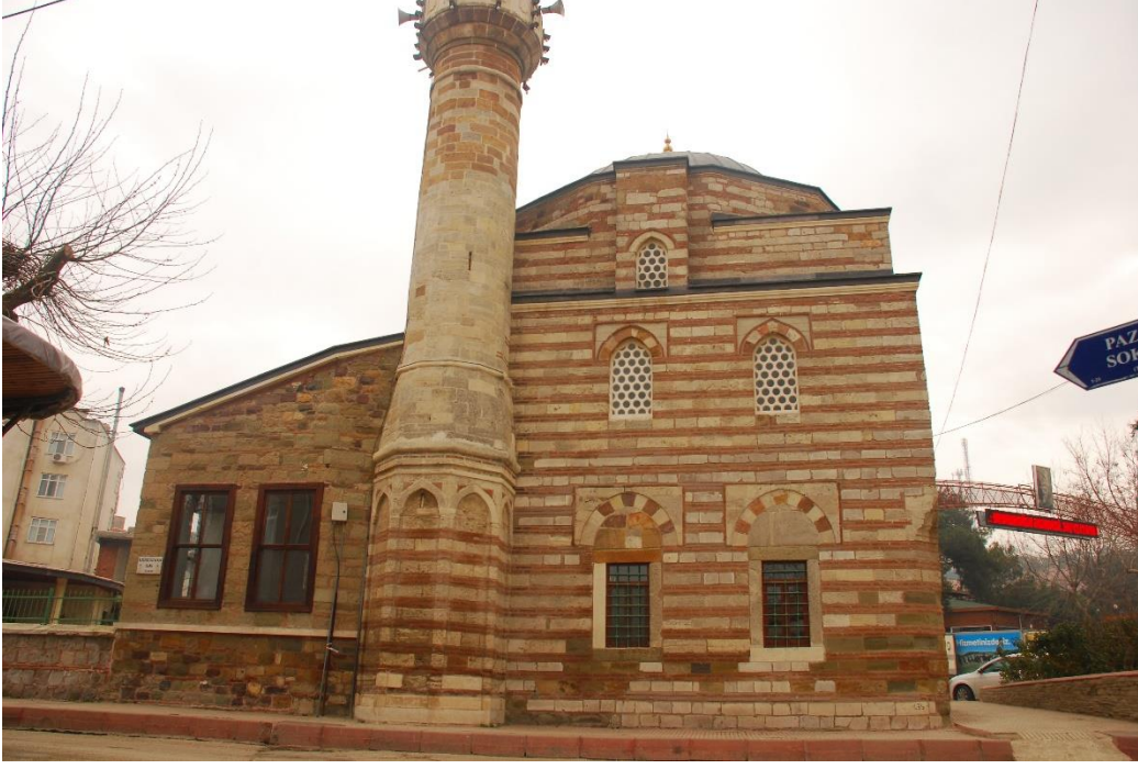
Res. 6: Alaca Mustafa Paşa Camii batı cephesi