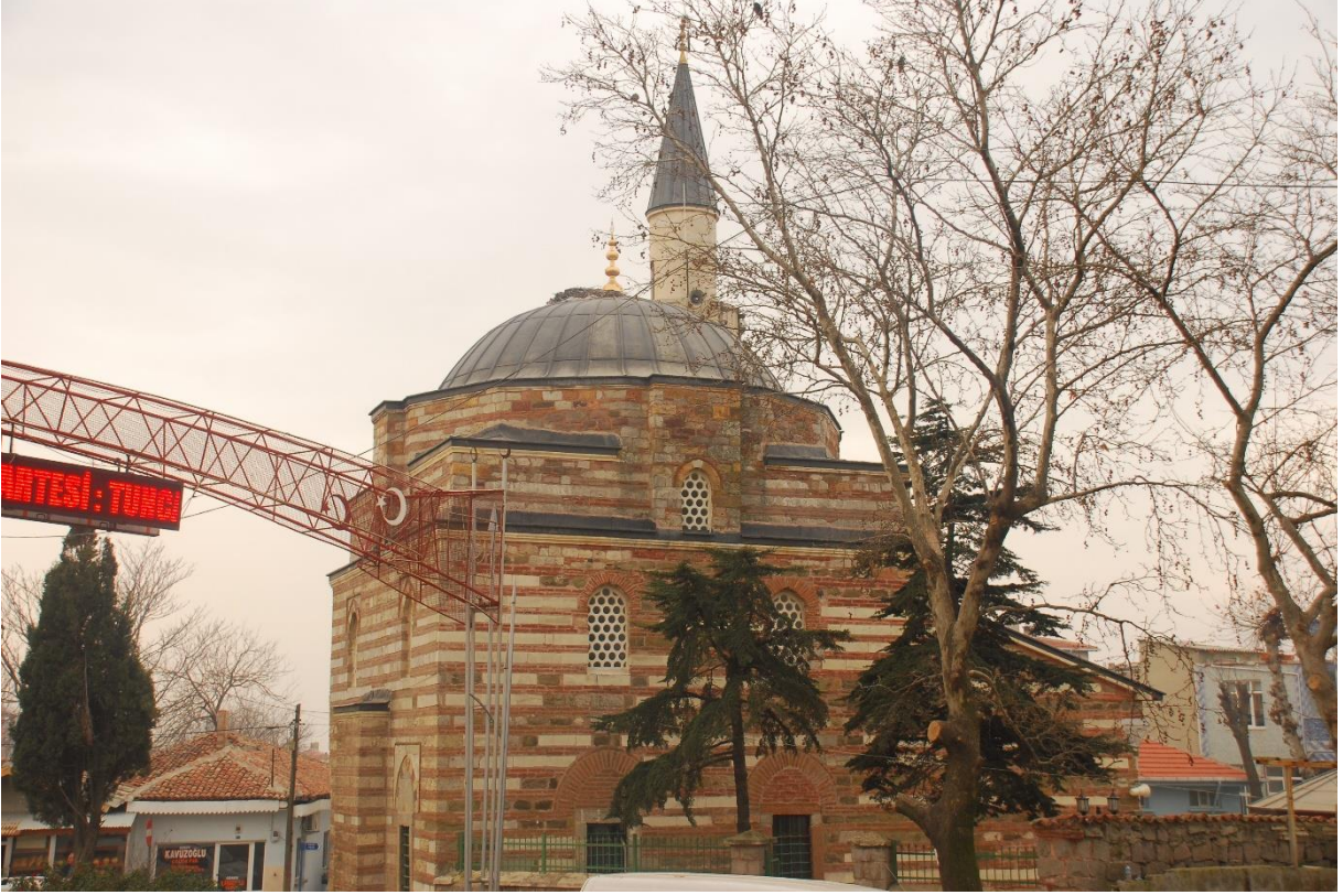
Res. 10: Alaca Mustafa Paşa Camii doğu cephesi