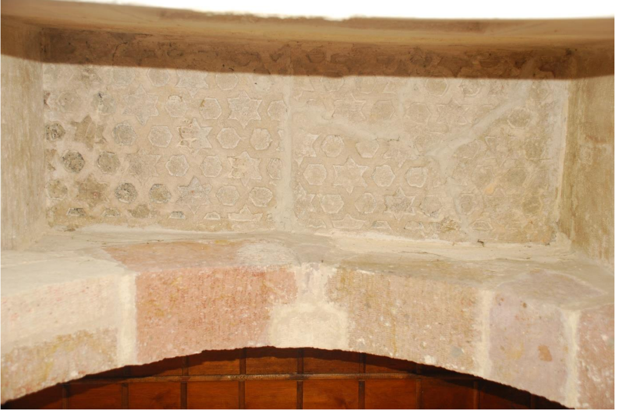
Res. 12: Alaca Mustafa Paşa Camii harime giriş kapısının tavanındaki süsleme