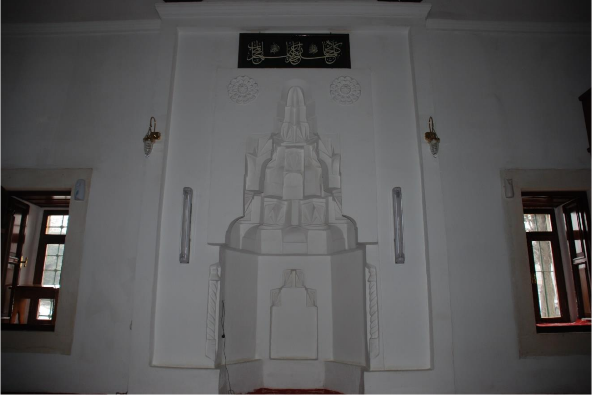
Res. 16: Alaca Mustafa Paşa Camii mihrabı