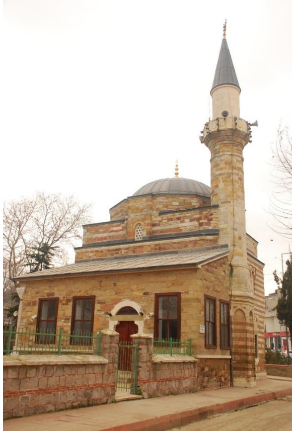
Res. 3: Alaca Mustafa Paşa Camii kuzey-batı köşeden görünüm (sağda)