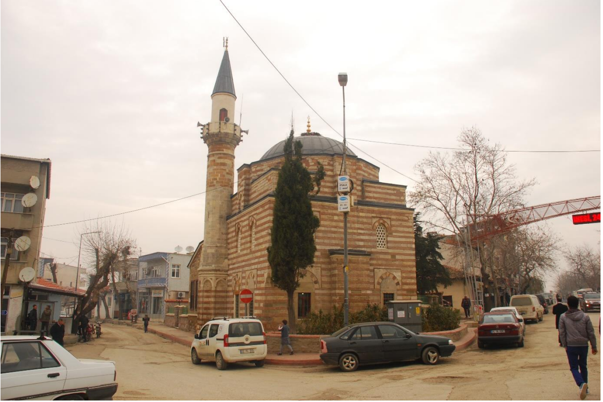
Res. 8: Alaca Mustafa Paşa Camii güney-batı cephesi