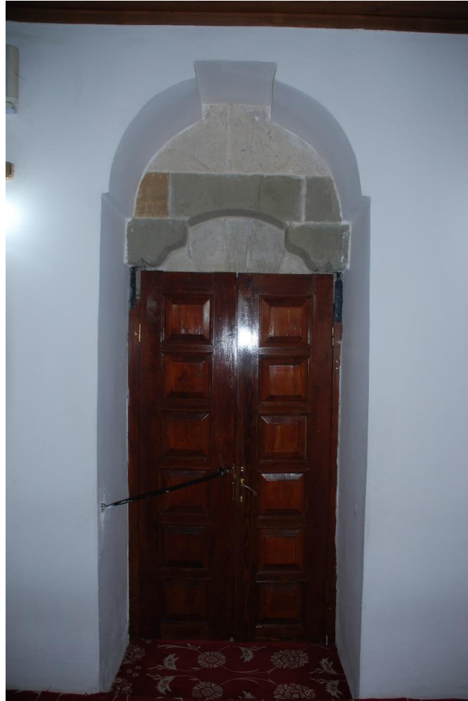
Res. 19: Alaca Mustafa Paşa Camii giriş kapısının harimden görünümü