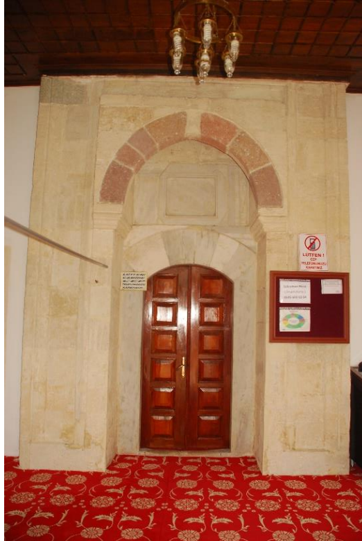
Res. 11: Alaca Mustafa Paşa Camii harime giriş kapısı