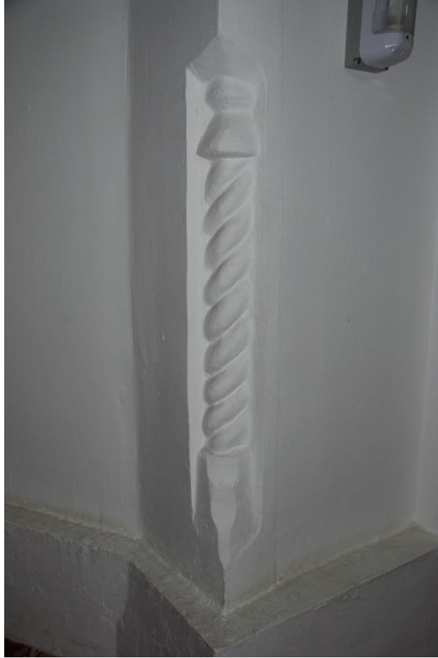
Res. 17: Alaca Mustafa Paşa Camii mihrabının köşe sütuncesi