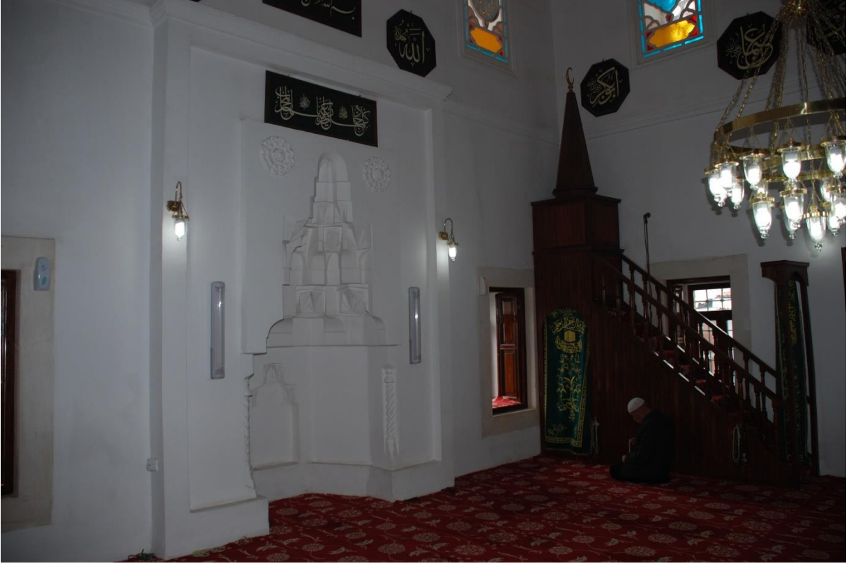
Res. 14: Alaca Mustafa Paşa Camii mihrabı ve minberi