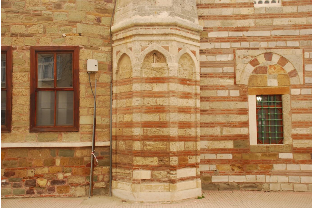
Res. 7: Alaca Mustafa Paşa Camii minare kaidesi