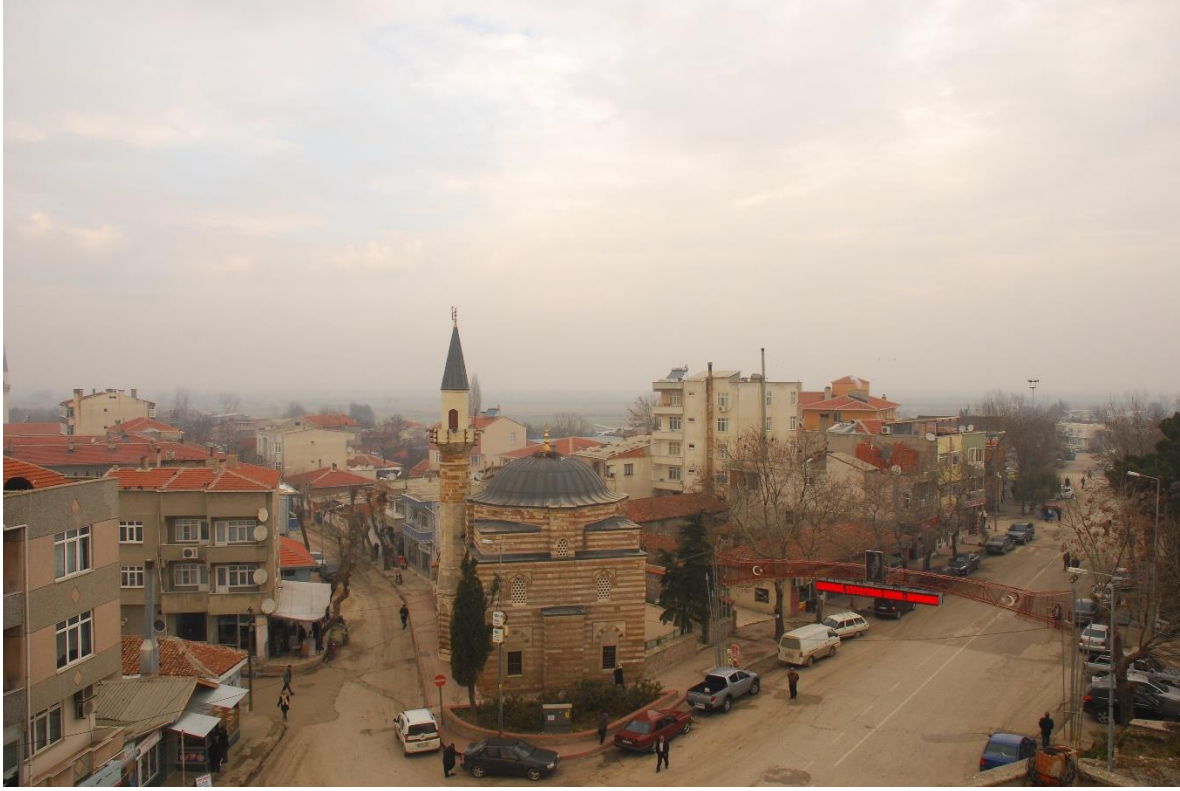
Res. 1: Alaca Mustafa Paşa Camii genel görünüm