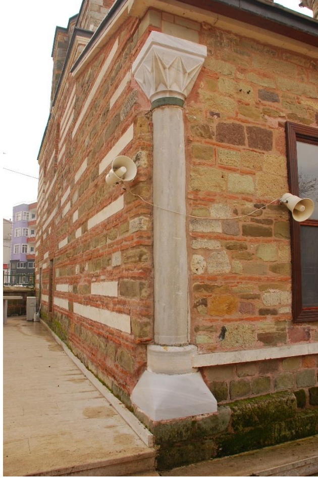
Res. 5: Alaca Mustafa Paşa Camii kuzey-doğu köşedeki mermer sütun