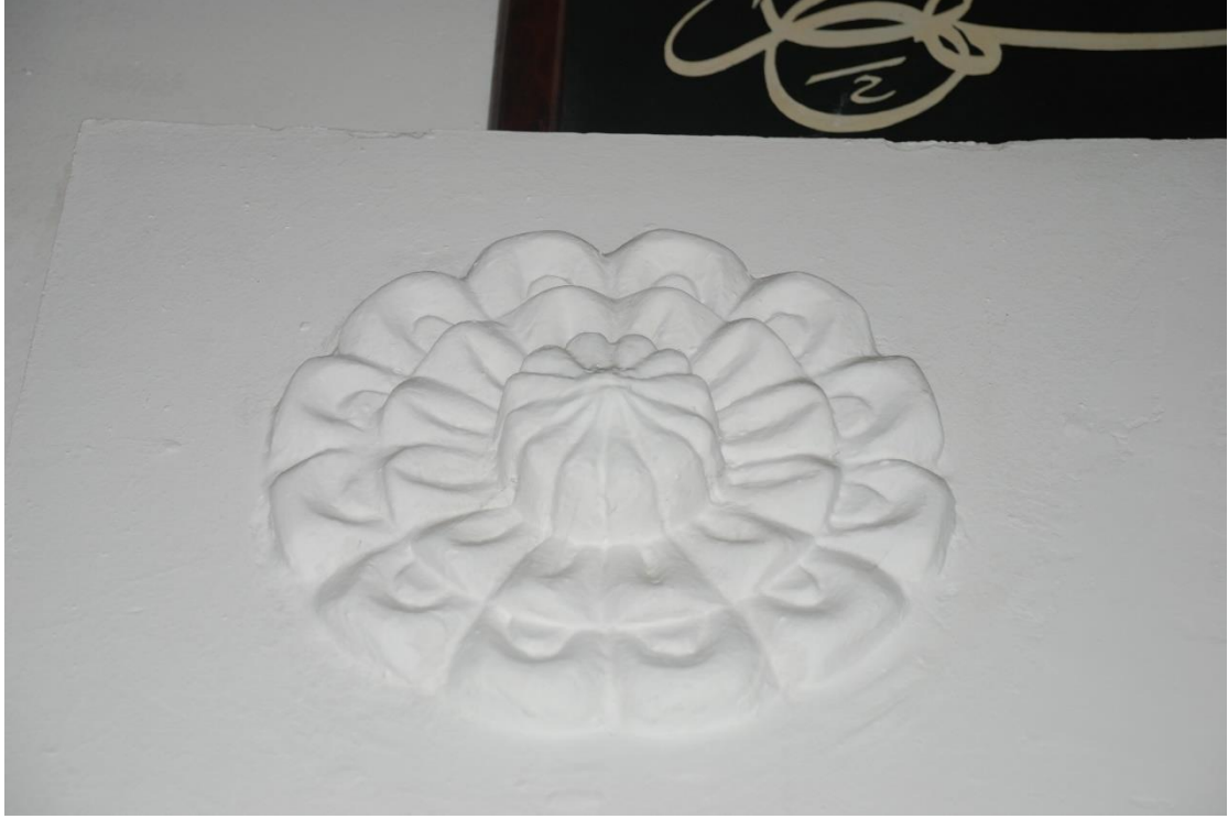
Res. 18: Alaca Mustafa Paşa Camii mihrabı kavsara köşeliğindeki gülbezek