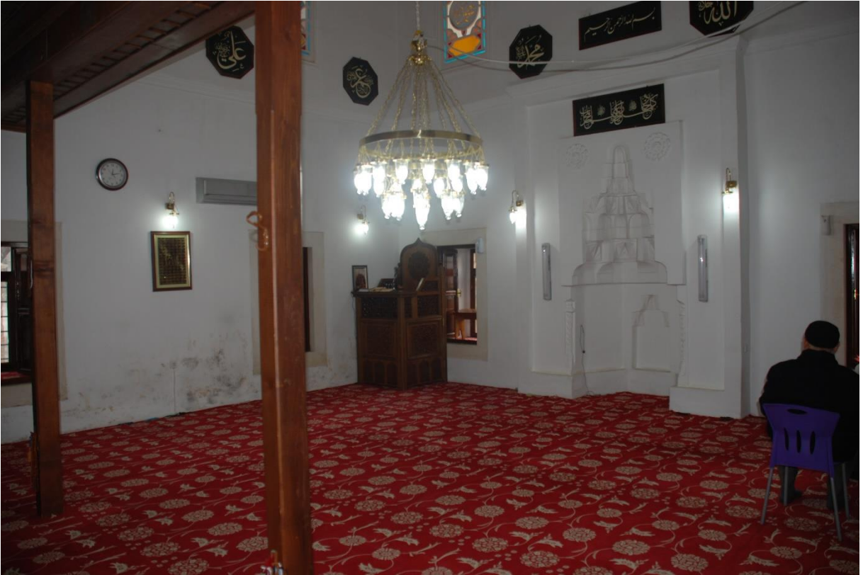
Res. 13: Alaca Mustafa Paşa Camii harimi