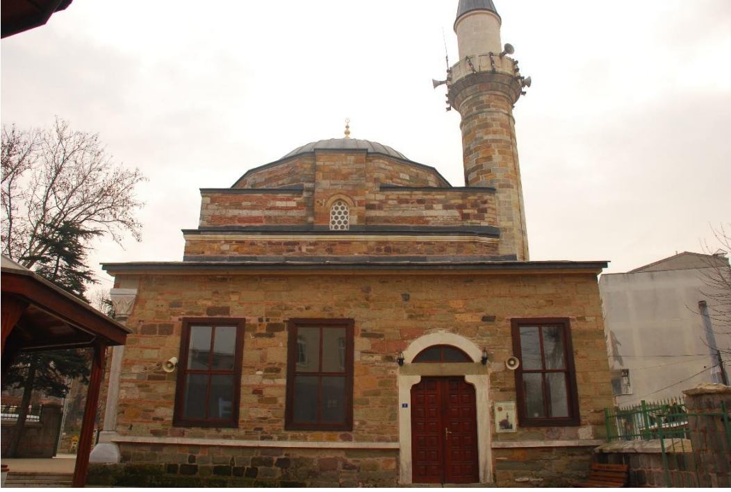
Res. 4: Alaca Mustafa Paşa Camii kuzey cephesi