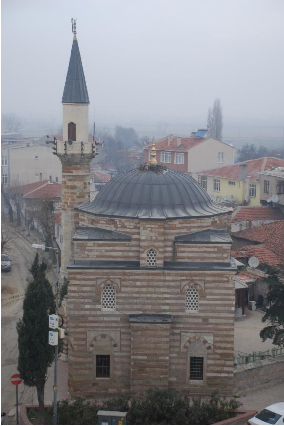
Res. 2: Alaca Mustafa Paşa Camii güney cepheden görünüm (solda)