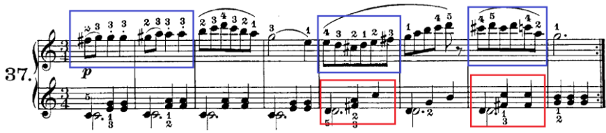
Şekil 22. C. Czerny Op.823 No:37

Şekil 22’de C. Czerny’nin Op.823 kitabından 37 numaralı etüdün 1 ve 8. ölçüleri görülmektedir. 37 numaralı etüdün tonunun do majör olduğu görülmektedir. Üst parti sağ el incelendiğinde etüdün ilk notası fa diyaz ile başlamıştır. Daha sonra gelen 2, 5 ve 7.ölçülerde do majör tonu içerisinde olmayan değiştirici işaretlerin kullanıldığı görülmektedir. Buna paralel olarak alt parti sağ elde 5 ve 7. ölçülerde de ton dışı değiştirici işaretler kullanılmıştır. İki elde de belirli bir düzen ve sistematik içerisinde kullanılan bu ton dışı değiştirici işaretler ile, do majör tonunda başlayan 37 numaralı etüt, 5.ölçüden itibaren baskın bir şekilde ikinci derece dominant kullanımı ile 8.ölçüde sol majör tonuna geçiş yapmıştır. Bu şekil kullanım ile bu etüdü çalan öğrencinin elde edeceği kazanımlar düşünüldüğünde hem teknik seviye anlamında hem de teorik düzeyde armoni bilgisinin gelişmesine olanak sağlayacaktır.