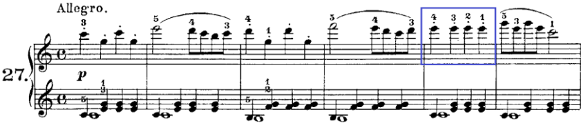
Şekil 16. C. Czerny Op.823 No:27

Şekil 16'da C. Czerny'nin Op.823 kitabından 27 numaralı etüdünün 1 ve 8. ölçüleri görülmektedir. Etüdün 5. ölçüsünde parmak değişim hareketleri görülmektedir. Bu parmak değişim hareketi ile öğrenciye piyano klavyesinde daha rahat ve esnek hareket etme, pozisyon bilgisini kazandırma ve klavye hakimiyetini kazandırma davranışlarını geliştirme amaçlanmıştır. Buna benzer yapılar birçok etüt ve eserlerde bulunmaktadır. C.Czerny Op.599 kitabının 68 numaralı etüdünde bu yapı oldukça detaylı şekilde işlenmiştir.