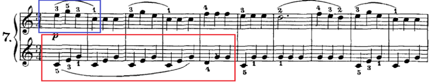
Şekil 3. C. Czerny Op.823 No:7

Şekil 3 incelendiğinde sol ve sağ elde legato kazanımının var olduğu ve buna paralel olarak sağ elde 1.ölçüde legato çalımının olup 2.ölçüde ise bağ sonu staccatosu ile bu kazanımın birleştiği görülmektedir. Aynı zamanda teknik zorluk seviyesi gözetildiğinde ise bu etüdün başlangıç piyano eğitiminde rahatlıkla kullanılabilirliği açıkça görülmektedir.