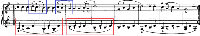
Şekil 4. C. Czerny Op.823 No:12

Şekil 4'te kitabın 12.etüdünün 9 ve 16.ölçüleri görülmektedir. Bu etütte sağ ve sol elde hem legato kazanımı hem de bağ sonu staccatosu kazanımı bulunmaktadır. Başlangıç piyano kitaplarından F. Beyer 101. 38, 39 ve 40 numaralı çalışma parçaları ile pozisyon açısı, zorluk seviyesi ve teknik kazanımları noktasında benzerlikler göstermesi Czerny Op.823 teki bu etüdün başlangıç piyano seviyesi için uygun olduğu sonucunu ortaya çıkarılabilir.