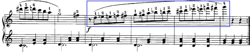
Şekil 23. C. Czerny Op.823 No:40

Şekil 23’te C. Czerny’nin Op.823 kitabından 40 numaralı etüdün 11 ve 16. ölçüleri görülmektedir. Bu etüdün tonu do majördür. Etüdün tamamı incelendiğinde etüdün genelinde ton dışı değiştirici işaretlerin oldukça yoğun şekilde kullanıldığı görülmektedir. Daha önceki ton dışı değiştirici işaretler maddesinde bahsedildiği gibi buradaki ton dışı değiştirici işaretler de hem etüdün duyumsal rengini değiştirmiş hem de ilk bölümün sonuna gelindiğinde etüdün tonunda geçici bir değişim meydana gelmiştir. Bu değişim Şekil 23’teki 40 numaralı etüdün 15 ve 16.ölçüleri incelendiğinde de görülebilmektedir. Bu etüde tekrardan kromatik dizi çalma kazanımı özelinde bakılacak olursa, 13.ölçüden başlayıp 16.ölçüde tamamlanan yaklaşık bir buçuk oktavlık çıkıcı özellikte kromatik dizinin olduğu görülmektedir. Kitabın ilerleyen etütlerinde de (54, 59,70,72) bu kazanıma yönelik kullanımlar yer almaktadır. Aynı zamanda C. Czerny Op.599 kitabında da kromatik dizilere yer verildiği görülmektedir. Op.599 kitabında özellikle 56 numaralı etütte ilk bölümde çıkıcı ikinci bölümde ise inici olarak kromatik dizi kullanımına yer verilmiştir. Bu açıdan değerlendirme yapılırsa çalışma kapsamında incelenen Op.823 kitabının başlangıç piyano eğitiminde kullanılan benzer teknik kazanımları sistemli bir biçimde işlediği görülecektir.