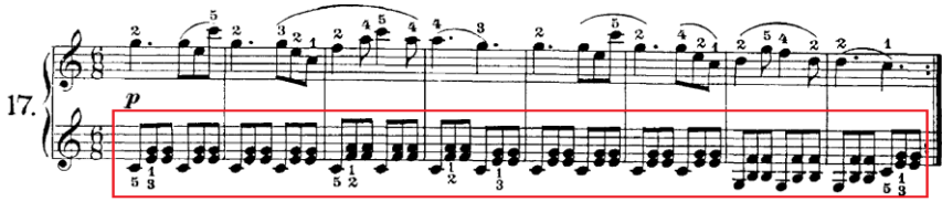
Şekil 12. C. Czerny Op.823 No:17

Şekil 12'de kitabın 17 numaralı etüdünün 1 ve 8. ölçüleri görülmektedir. Bu etütte alt parti de sol elde yoğun bir şekilde vals eşlik kalıbının kullanıldığı görülmektedir. Özellikle belirtmek gerekirse, başlangıç piyano eğitiminde hedeflenen teknik kazanımlara yönelik tasarlanan bu etütler öğrencilerden istenilen hedef davranışları yerine getirilmesi ve doğru şekilde pekiştirilmesi adına son derece önemlidir. Benzer yapıda fakat melodik biçimi farklı olan bir etüt yine C. Czerny'nin Op.599 kitabında (21 numaralı etüt) bulunmaktadır.