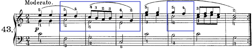
Şekil 24. C. Czerny Op.823 No:43

Şekil 24’te C. Czerny’nin Op.823 kitabından 40 numaralı etüdün 1 ve 8. ölçüleri görülmektedir. Bu etüdün 2, 3, 4 ve 6.ölçüleri incelendiğinde sağ elde tutan seslerin olduğu görülmektedir. Bu tutan seslerin 2 ve 6.ölçülerde ikinci parmak ile 3 ve 4.ölçülerde ise birinci parmak ile kullanıldığı görülmektedir. Bu şekilde kullanımlarda piyano eğitiminde hedeflenen birçok kazanıma ek olarak parmak kaslarının bağımsız olarak gelişimi de sağlanmış olacaktır. Benzer şekilde sağ elde tutan ses kullanımının C. Czerny Op.599 kitabının 78 ve 79 numaralı etütlerinde yer aldığı tespit edilmiştir.