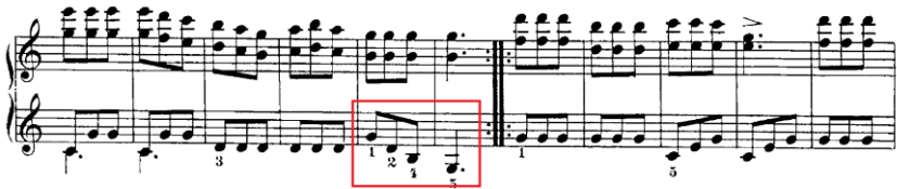
Şekil 17. C. Czerny Op.823 No:25

Şekil 17'de C. Czerny'nin Op.823 kitabından 25 numaralı etüdünün 11 ve 21. ölçüleri görülmektedir. Etüdün 15 ve 16.ölçüsünde sol elde aşağı yönlü bir arpej hareketi görülmektedir. Başlangıç piyano