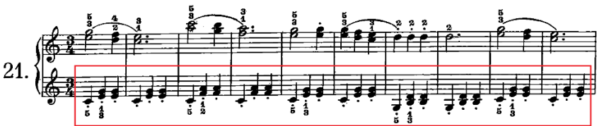
Şekil 13. C. Czerny Op.599 No:21

Şekil 12'de kitabın 17 numaralı etüdünün 1 ve 8. ölçüleri görülmektedir. Bu etütte alt parti de sol elde yoğun bir şekilde vals eşlik kalıbının kullanıldığı görülmektedir. Özellikle belirtmek gerekirse, başlangıç piyano eğitiminde hedeflenen teknik kazanımlara yönelik tasarlanan bu etütler öğrencilerden istenilen hedef davranışları yerine getirilmesi ve doğru şekilde pekiştirilmesi adına son derece önemlidir. Benzer yapıda fakat melodik biçimi farklı olan bir etüt yine C. Czerny'nin Op.599 kitabında (21 numaralı etüt) bulunmaktadır.