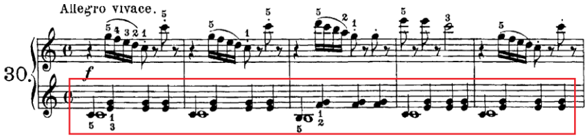
Şekil 18. C. Czerny Op.823 No:30

Şekil 18'de C. Czerny'nin Op.823 kitabından 30 numaralı etüdünün 1 ve 5. ölçüleri görülmektedir. Alt parti sol el eşlik yapısına dikkat edildiğinde tutan seslerin her yeni ölçü başlangıcında kullanıldığı görülmektedir. Bu kullanım parçanın tamamında bu şekilde devam etmektedir. Tüm ölçüdeki tutan sesler incelendiğinde parçanın armonik yürüyüş kalıbına göre şekillendiği gözlemlenmiştir. Bu etüt ile duyumsal olarak tını zenginliği geliştirme ve parmak kaslarının gelişimi noktasında kazanımların elde edilmesi amaçlanmıştır. Şekil 17'deki tutan ses (sol el) kazanımına ilişkin benzer kazanımı C. Czerny Op.599 kitabının 13.15 ve 16 numaralı etütlerinde de olması bu kazanımın ne denli önemli olduğunu göstermektedir.