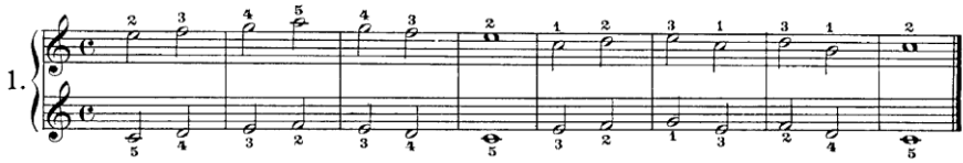
Şekil 1. C. Czerny Op.823 No:1

Şekil 1’de görüldüğü üzere sıralı ve yakın hareket ile aralık atlamalı seslerde legato ve bağ sonu kazanımı bulunmamaktadır. Bu durum bestecinin kendi özelinde kitabın orijinal tasarımı ile ya da daha sonradan kitabı ele alan editörün bakış açısına göre şekillenmiş olabilir. Ancak aşağıda şekil 2’de bu etüt legato ve bağ sonu kazanımları sağlanacak şekilde yeniden düzenlenebilir.