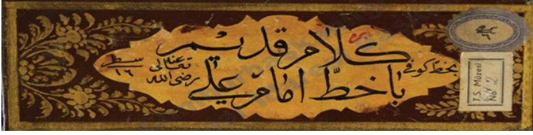
Şekil 4: TMSK 2 nr. mushaf miklebi: ٦١ سطر رضي الله تعالى سطر ٦١

Mushafın miklebinde “كلام قديم بخط كوفي بخط علي رضي الله تعالى سطر ٦١” yazmaktadır: “Kûfî hatlı Ali'nin (r.a) hattı ile kelimayı kadim. 16 satır.”: