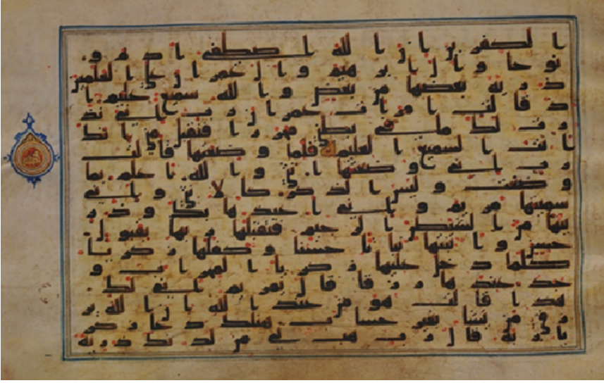
Şekil 1: TİEM 458 nr. mushaftan bir sayfa: el-Bakara 2/32-38. ayetler arası, TİEM 458/35a.

Cilt kısmı da dâhil olmak üzere mushafa ait 388 görüntü bulunmaktadır. Bunun 382’si ayet metinlerinin yer aldığı sayfalardır. Her görüntüde yaklaşık 2 sayfa bulunduğu hesabıyla mushafın, toplam 764 sayfadan oluştuğu ifade edilebilir.