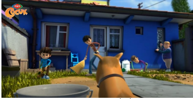
Resim 4. Rafadan Tayfa Çizgi Filmi 'Kadın İşi' İsimli Bölümünden Bir Kare

Rafadan Tayfa çizgi filminin 'Kadın İşi' bölümünde yaşlılara yardım haftası nedeni ile Basri amcaya yardım ettiklerini gören Rafadan Tayfa yapılan işleri küçümseyerek Sevim ve Hale karakterlerini kızdırlar. Bunu gören Rüstem abi de Rafadan Tayfaya bir ders vermek için onlara kadın işi olarak gördükleri ve küçümsedikleri işleri yaptırmaktadır. Bu açıdan bakıldığında incelenen çizgi filmlerde sosyal öğrenme kuramında yer verilen taklit yoluyla öğrenme davranışı açısından önemlidir. Çocukların izledikleri çizgi filmlerin, gördükleri olumlu veya olumsuz davranışları öğrenmeleri ve rol model alma bakımından büyük etkisinin olduğunu söylemek mümkündür. Bandura tarafından ortaya atılan Sosyal Öğrenme Kuramı bireylerin taklit etme, model alma gibi özellikleri ile yakın çevresinden gördüğü olumlu ve olumsuz davranışları içselleştirmeleri şeklinde söylenebilmektedir. İnsanların sergiledikleri birçok davranış başka insanların davranışlarını gözlemleyerek kazandığını ifade etmiştir. Bandura bu durumu sembolik model türü olarak açıklamaktadır. Bu model türünde kişinin ahlaki yargıları ve doğru veya yanlış tanımlamaları televizyonda tasvir edilen bir karakter ya da davranış ile gelişmektedir (Bandura, 2006).