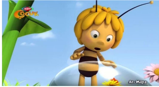
Resim 2. Arı Maya Çizgi Filmi Ana Karakteri

TRT Çocuk kanalındaki çizgi filmlere yönelik gerçekleştirilen ön inceleme sonucunda bir aylık bazda toplam 26 çizgi film içeriğinin yayınlandığı tespit edilmiştir. Ön çalışma neticesinde tespit edilen Dijital tayfa isimli çizgi filmin Rafadan Tayfa'nın karakterlerinin aynen kullanıldığı tespit edilmiş, dolayısıyla Rafadan Tayfa için yapılacak çözümlemenin Dijital tayfa için de geçerli olacağı öngörülmüştür. Dolayısıyla Dijital Tayfa çizgi filmi de bu nedenle araştırmanın dışarısında bırakılmıştır. Böylece 25 çizgi film içeriği araştırma kapsamına alınmıştır. Bu çizgi filmlerde insan ve hayvan karakterler yer almaktadır. İncelenen çizgi filmlerin 18'inde insan karakterleri, 7'sinde ise hayvan karakterleri bulunmaktadır. Bu karakterler cinsiyet bazında değerlendirilmeye alınmıştır. Genel olarak tüm çizgi filmlerde karakterlerin cinsiyetleri net bir şekilde anlaşılırken özellikle Arı Maya çizgi filminde ana karakter olan Arı Maya'nın cinsiyeti anlaşılammaktadır. Arı Maya çizgi filmde genç bir arı olarak lanse edilmekte seslendirmesinde kullanılan erkek çocuk sesi nedeniyle Arı Maya'nın erkek karakter olduğu değerlendirilmiştir.