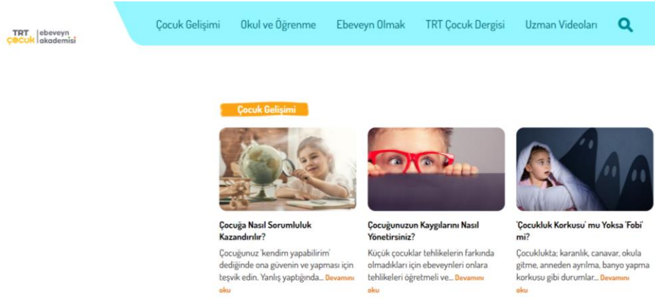
Resim 1. TRT Çocuk Ebeveyn Akademisi İnternet Sayfası

Bu sayfada; Çocuk Gelişimi başlığı altında, Çocuklarda Obsesif Kompulsif Bozukluk, Dijital İçerikler Çocuğa Şiddeti Aşılır mı?, Çocuklar İçin Ev Etkinlikleri, Çocuğunuzun Zayıf ve Güçlü Yönlerini Öğrenin, Çocuklar Aynı Anda İki Dil Nasıl Öğrenir?, Çocuğa Nasıl Sorumluluk Kazandırılır?, Çocuğunuzun Kaygılarını Nasıl Yönetirsiniz?, 'Çocukluk Korkusu' mu Yoksa 'Fobi' mi?, Çocuk İçin Oyun Neden Çok Önemli?, Çocuklarda Duygusal Sağlık Oluşturma ve İyi Oluş Hali gibi konulara yer verilmiştir.