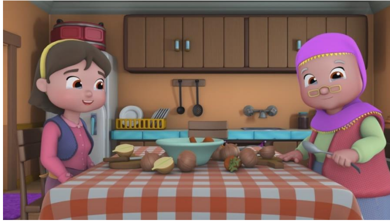
Resim 3. Niloya Çizgi Filminden Niloya'nın Anne ve Babaannesinin Mutfakta Yemek Hazırlama Görüntüsü

Toplumsal cinsiyet eşitliği kavramı kadın ve erkeğin, toplumsal yapı da yer alan aile hayatı, eğitim, çalışma hayatı vb. durumları özelinde eşitlik kavramını ifade etmektedir. (Mitchell ve Oakley, 1998). Toplumsal cinsiyet kavramı değerlendirildiğinde kadın ve erkek arasındaki eşitsizlik durumu oldukça önemlidir. Genel anlamda değerlendirildiğinde kadın erkek arasındaki eşitsizlik günümüz toplumlarında her türlü alanda karşımıza çıkmaktadır.