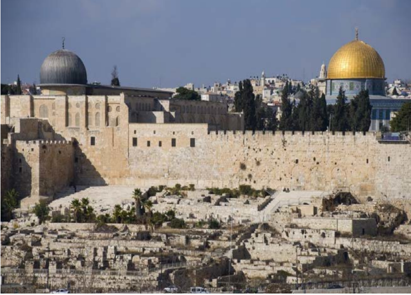
Ek-3 Mescid-i Aksâ'nın doğu tarafından Kubbetü's-sahre ile birlikte görünümü-Kudüs ( https://islamansiklopedisi.org.tr/kudus Erişim Tarihi: 15.05.2022).