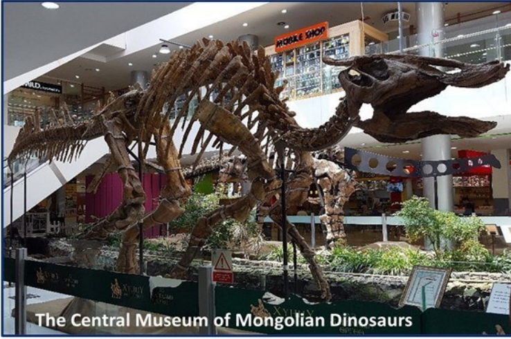
Resim-1: Moğolistan'ın başkentinde bulunan Dinazor Müzesi

Diğer taraftan bugünkü Moğolistan'ın hemen güneyinde bulunan Hohhot'taki (Çin Halk Cumhuriyetine bağlı İç Moğolistan Özerk Bölgesi'nin başkenti) müzede, bunun yanında tarihin derinliklerine inen dönemlere ait bölgedeki ekonomik ve toplumsal gelişime dair evreler de paleontolojik fosillerden istifade ile anlaşılır kılınmaya çalışılıyor.