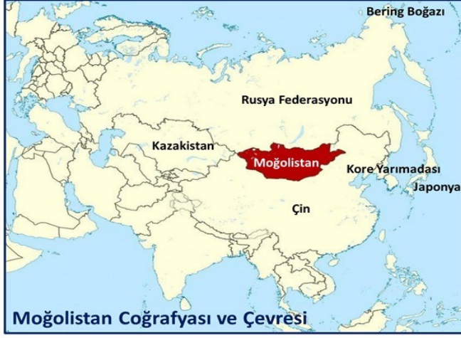
Harita 3 : Moğolistan coğrafyası ve çevresi

Günümüzde Çin’de 6 milyondan fazla etnik Moğol olarak nitelendirilen Moğol yaşamaktadır ki bu halen Moğolistan’da yaşayan Moğolların sayısından iki kat daha fazladır. Diğer taraftan, Çin Halk Cumhuriyetine bağlı bir bölge olarak, İç Moğolistan Özerk Bölgesinin bulunduğu coğrafya da dahil, Çinlilerin ve Moğolların birlikteki yaşamının yanında; Huiler, Mançular ve Koreliler de yaşamaktadır. Mançular, günümüzde Kuzeydoğu Çin’de yaşayan Mançurya kökenli Tunguz halkıdır. Koreliler ise Kore ve Güneybatı Mançurya kökenli Doğu Asyalı bir etnik gruptur. Bu coğrafyada yaşayan onlarca etnik unsurun kültürel olarak birbirinden etkilenmemesi mümkün değildir. Zaten toplumların birikimli uygarlığı olan kültür; değişikliğe uğrayarak gelişir. Bu değişim dışarıdan zorlama ile olabildiği gibi, kültürel özümseme, kültürel yayılma veya gönüllü kültürleşme olarak da gerçekleşebilir. Şüphesiz Moğolistan ve çevresindeki unsurlar, tarih boyunca bazı hususlarda öz kimliğini muhafaza etmekle birlikte, meydana gelen hızlı etkileşimler sonucu, çoğu zaman kendisinden farklı kültürlerle etkileşime girerek, ikisinden de farklı yepyeni bileşimler yaratarak yollarına devam etmiştir (Alpar, 2003: 124 ).