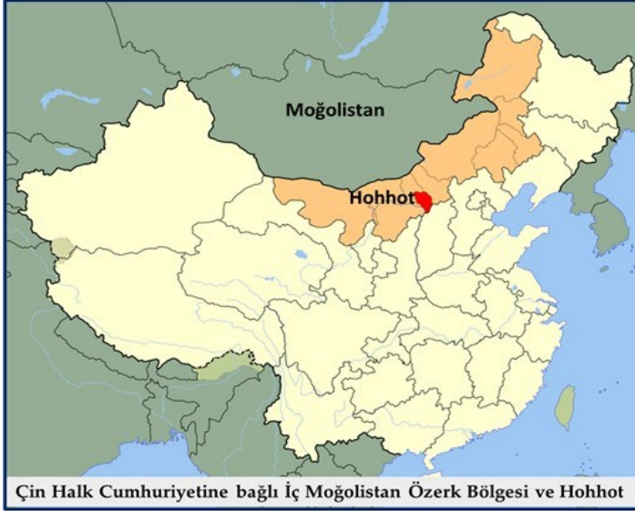
Harita 1: Moğolistan ve Güneyinde İç Moğolistan Özerk Bölgesi

İç Moğolistan Özerk Bölgesindeki bulgular, bölgenin dünyanın en eski kültür coğrafyalarından birisi olma özelliğini perçinliyor ve geçmişte yaşamış ve nesli tükenmiş bitki ve hayvan örneklerini insanlığa sunuyor. Bu dönemde Moğolistan ve çevresinin bataklıklarla kaplı olduğuna dair bulgular var.