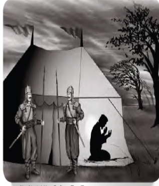
Görsel 2.12: I. Murad'ın Duası (Temelli)

“Savaştan bir gün önce Kosova’da şiddetli bir fırtına başladı. Ağaçlar devriliyor, toz duman birbirine karışıyordu. Çadırlardan dışarı çıkamaz olmuştuk. Buraya yüce dinimiz İslam’ı yaymak için gelmiştim. Peygamberimizin gösterdiği yolda yürüyecek, buradakileri doğru yola davet edecektim ama önüme çıkan bir sürü engel vardı. Bunların en büyüğü ise dışarıda esip savuran, şu büyük fırtınaydı. Ellerimi semaya kaldırdım ve Allah’a şöyle yalvardım: Ya Rabbim! Bu fırtına, şu aciz Murad kulunun günahları yüzünden çıktıysa, masum askerlerimi değil, beni cezalandır. Onlar buraya kadar, sadece senin adını yüceltmek, İslam dinini duyurmak için geldiler. Bu fırtınayı onların üzerinden defet. Senin şanına yakışır bir zafer kazanmalarına yardım et Allah’ım. Ben hazırım, yüce Allah’ım! Önce beni gazi kıl, sonra da şehit mertebesine ulaştır. Sonra da Otağ’ı Hümayun’a dönüp bir savaş meclisi kurdum ve oradakilere şunları söyledim: