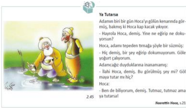
Resim-3 (MEB,2021 s.57)

Resim-3. 5. Sınıf Sosyal Bilgiler Ders Kitabı 2. Ünite Kültür ve Miras Öğrenme Alanı Günlük Yaşamdaki Kültürel Unsurların Tarihi Gelişimini Değerlendirir Kazanımına ait Fıkra Bölümü