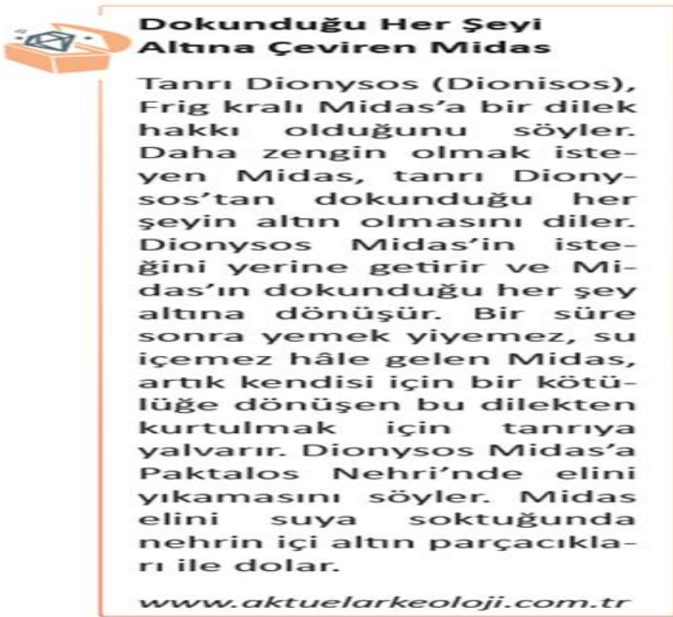
Resim-2 (MEB,2021 s.42)

Resim-2. 5. Sınıf Sosyal Bilgiler Ders Kitabı 2. Ünite Kültür ve Miras Öğrenme Alanı Anadolu ve Mezopotamya Uygarlıklarının İnsanlık Tarihine Katkılarını Fark Eder Kazanımına ait hikâye bölümü