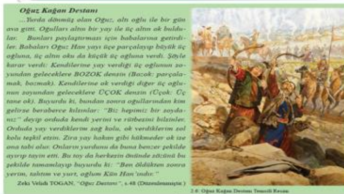
Resim-4 (MEB,2021 s.51)

Resim-3 'te Nasrettin Hoca ile ilgili bir fıkra konularak günlük yaşamdaki kültürel unsurların tarihi gelişimi kazanımını öğrencilerin öğrenmesi sağlanmaya çalışılmıştır. Bu fıkrada Meddahlık geleneğine uygun ve bu geleneğe göre canlandırma yapılarak anlatılabilecek bir fıkradır. Sınıfta seçilecek bir öğrenci ile konunun daha iyi öğrenilmesi için Meddahlık etkinliği yapılabilir.