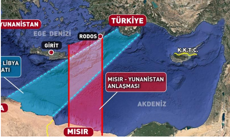
Şekil 4: Mısır-Yunanistan ve Türkiye-Libya Sınırlandırma Anlaşmaları

Bu minvalde Mısır ve Yunanistan'ın Yunan adalarını deniz yetki alanına esas teşkil eden bir antlaşma imzalaması, Türkiye'nin deniz yetki alanlarını hiçe sayan ve hakça ilkelerle bağdaşmayan bir tutumdur. Mısır ile Yunanistan arasında imzalanan ve Türkiye'nin onaylamadığı antlaşmada, dikkat çekilmesi gereken bir başka nokta ise Meis adasının antlaşmaya dahil edilmemiş olmasıdır. Bu durum, Mısır'ın halen Türkiye'yle köprüleri tamamen atmadığını gösterdiği gibi ilerleyen dönemlerde olası bir müzakere sürecinin de önemli bir boyutunu oluşturacak bir konuya işaret etmektedir. Bu anlamda Türkiye'nin Mısır'la yapıcı ilişkiler kurması Mısır-Yunanistan arasındaki deniz yetki alanları antlaşmasının akamete uğramasına imkân tanyabilir. Üstelik Mısır'la Türkiye arasında olası bir deniz yetki alanı antlaşması, GKRY'nin temelsiz iddialarını da büyük ölçüde boşa çıkaracaktır. Türkiye Mısır ve İsrail'in yanı sıra Lübnan, Filistin ve Suriye gibi ülkelerle deniz yetki alanı antlaşmaları imzalayabildiği takdirde ilerleyen dönemlerde elini önemli ölçüde güçlendirecek ve Doğu Akdeniz'deki konumunu da pekiştirecektir.