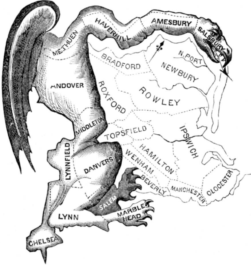
Şekil-1: Gerrymandering: “Gerry Buyurdu, Böyle Oldu”

Kaynak: Elkanah Tisdale (1771-1835) – Originally published in the Boston Centinel, 1812.