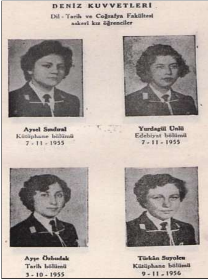
Deniz Kuvvetleri Komutanlığı Adına Ankara Üniversitesi Dil-Tarih ve Coğrafya Fakültesi'nde Okuyan Kız Öğrenciler. 57