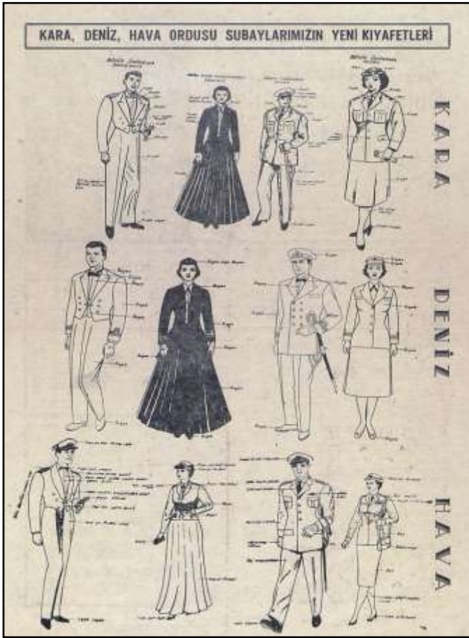
Türk Ordusu'na Alınan Kadın Subayların Kıyafetlerini Gösterir Broşür. 56