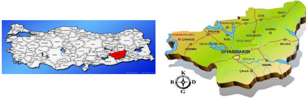
Şekil 1. Çalışma alanı konumu

Diyarbakır'da yaşaya nüfusu için tahmini bir sayı verilemesede, bu toplum insanların başta İstanbul olmak üzere Diyarbakır ve diğer birçok şehirde Türk toplumu ile birlikte yaşamlarını sürdürmekte olduğu aşikardır.