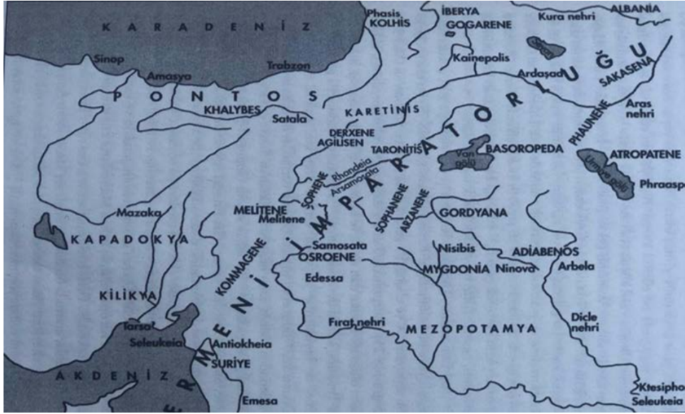
Şekil 3. Büyük Dikran Devrinde Ermeni İmparatorluğu (Grousset, 2019: 87)

Bu bilgiler ışığında tüm bu yaşananlar Ermeniler tarih sahnesi boyunca yaşayacağı toprak sınırlarını genişletmeye ve ulus mücadelesini ortaya çıkmasını sağlayacaktı. Ermeni tarihi kaynaklarında Dikran'ın iktidara geldikten sonraki adımlarını Bournoutian şu şekilde özetlemektedir: İ.Ö 200. Yüzyıl, medeniyetler açısından belirleyici olmuştur. Aynı zamanda ilk Ermeni krallığının doğuşuna, krallığı çevreleyen güçler karşısında stratejik önem oluşturmuştur. Roma ise, Küçük Asya'daki konumunu güçlendirmeye, Fırat nehrine doğru genişletmeye çalışıyordu (Bournoutian, 2016: 35-37).