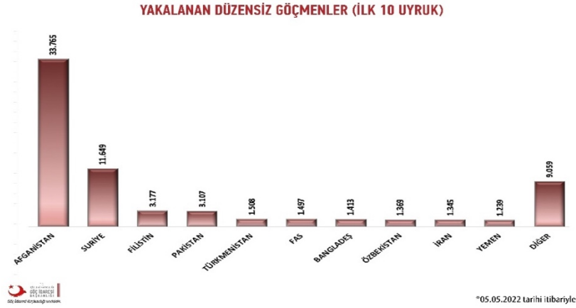
Şekil 2: Yakalanan düzensiz göçmenler (Göç İdaresi Genel Müdürlüğü, 2022)

Göç İdaresi verilerine bakıldığında, Türkiye’de yakalanan düzensiz göçmenler arasında Afgan göçmenler ilk sırada yer almaktadır. Afganistan coğrafyasında yaşanan çatışmalar, iç karışıklıklar, politik ve ekonomik nedenlerle birlikte özellikle ABD müdahalesini izleyen süreçle birlikte 2003 yılından itibaren Afganistan’dan yoğun bir göç dalgası Türkiye’ye gelmiştir. Bu göç dalgası, yakın dönemde yaşanan bazı zorunlu göç dalgalarından farklı bir şekilde “örneğin 2011’den itibaren Suriye’den ya da 1989’da Kuzey Irak’tan yayılanlardan farklı olarak, ani ve yoğun biçimde birdenbire yaşanmamış, dalga dalga yayılarak devam etmiştir” (Bozok & Bozok, 2018, s. 417). 1979 yılında Sovyetlerin Afganistan’ı işgal etmesi ile başlayan ve kırk yılı aşan süreç milyonlarca Afgan göçmenin dünyanın pek çok ülkesine göç etmesine sebep olmuştur. “Afgan mültecilerin Türkiye ile teması 1979 yılında Afganistan’ın Sovyet İşgaline dayanmaktadır. TBMM’nin 1982 yılında çıkardığı “Afganistan’dan Pakistan’a Sığınan Türk Soylu Göçmenlerin Türkiye’ye Kabulü ve İskânına Dair Kanunun” ilk maddesinde Türk soylu Afgan ailelerinin Türkiye’ye yerleşmek isteyenlere imkân vermektedir” (Kahraman, 2017, ss. 142-143). Kırk yılı aşan bu süreçte göç, Bozok ve Bozok’un (2018) dediği gibi “dalga dalga yayılarak devam etmiştir.” Afganistan’daki, işgaller, çatışmalar, iç karışıklıklar, güvensiz bir biçimde yaşamı sürdürmeye ve yaşama tutunmaya çalışan Afgan göçmenleri göçe zorlamaktadır.