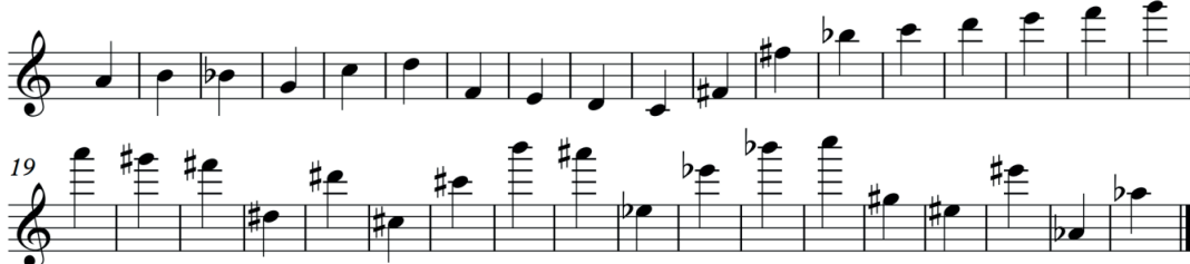
Şekil 3. Veriliş sırasına göre Mustafa Arı’nın metodunda ver alan seslerden bazıları