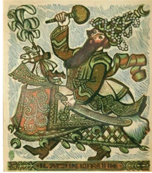
Resim 1. Polonya’nın Krakow Şehrine Ait Lajkonik İllüstrasyonu

Tablo 11’de Towarnicki’nin metodunda büyük bir çoęunlukla halk ve çocuk řarkısı dıřında parçalara yer verdięi görülse de (%91,98) kendi ülkesinden Leh halk/çocuk řarkılarının da bölge veya şehir isimleriyle bulunduęu görülmektedir (%5,73). Ayrıca Polonya dıřındaki ülke ve bölgelere ait halk/çocuk řarkıları az da olsa metotta yer almıřtır (%2,29). Towarnicki’nin yer verdięi Leh halk/çocuk řarkıları arasında Polonya’nın Podhale ve Silezya bölgeleri, Vistül nehri, Kielce ve Krakow şehirleri de bulunmaktadır. Metotta bir parçada yer verilen “Lajkonik” ise Krakow şehrine ait tarihi bir semboldür ( https://en.wikipedia.org/wiki/Lajkonik ).