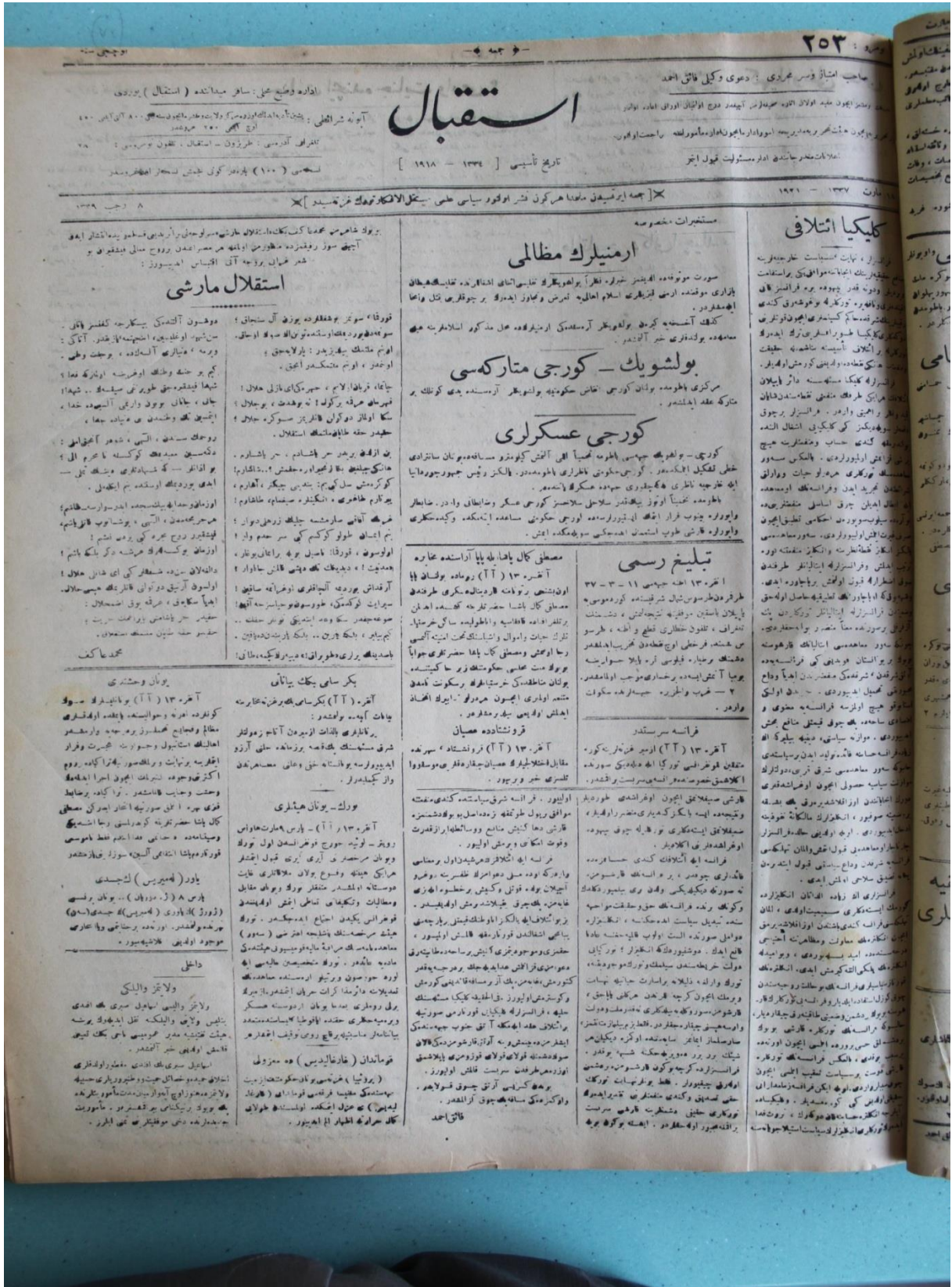
Ek 1: İstiklal Marşı, 18 Mart 1921