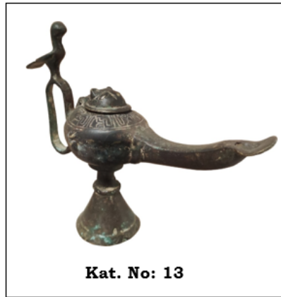
Tablo 2: Kayseri Selçuklu Uygarlığı Müzesinde Bulunan Madenî Kandiller