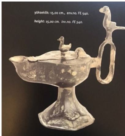
Resim 1: XII-XIII. yy. bronz figürlü kandil, Edgü Koleksiyonu (Tanman-Rıfat 2001:103)