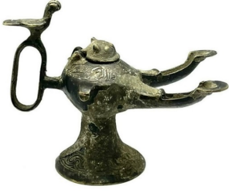
Resim 3: Gövde kapağında aslan, kulp kısmında kuş figürü bulunan iki burunlu madenî kandil. (URL 2)