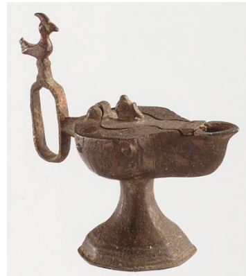
Resim 8: İstanbul Türk İslam Eserleri Müzesi Selçuklular Sergisi kataloğunda yer alan kandil (Kolaşin Koleksiyonu)