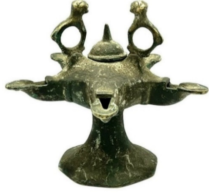
Resim 4: Gövde kapağı ve iki halka kulp üzerinde aslan figürü bulunan, beş burunlu kandil (URL 3)