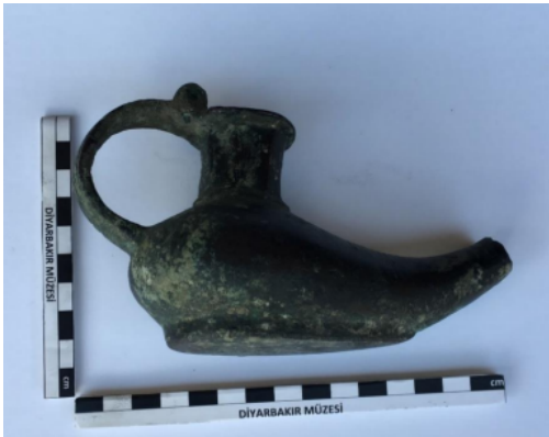
Resim 7: Diyarbakır Müzesi'nde bulunan 10/1/99 envanter numaralı burun kısmı kırılmış olan madenî kandil (Işık 2020: 82)