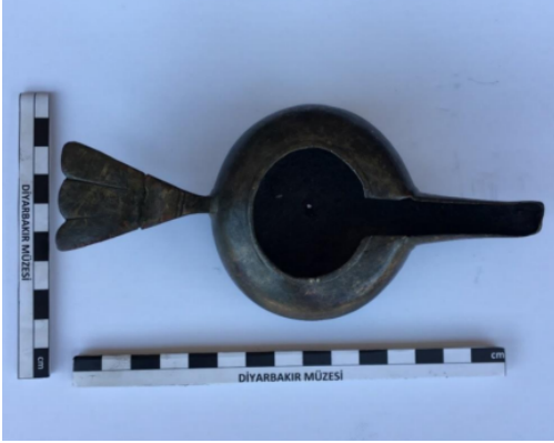
Resim 5: Diyarbakır Müzesi'nde bulunan 14/14/75 envanter numaralı kandil (Işık 2020: 37)