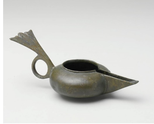
Resim 6: Metropolitan Museum'da bulunan madenî kandil (URL 4)