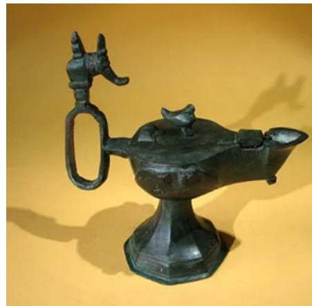
Resim 2: Liveauctioneers sitesi üzerinden satışı yapılan fil ve kuş figürlü madenî kandil (URL 1)