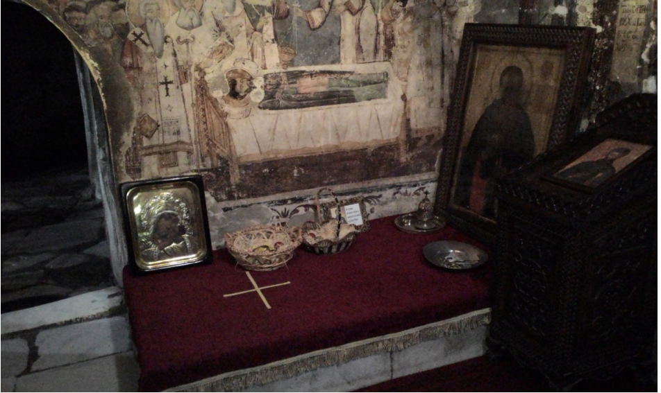
Fotoğraf: Ohri'de Sarı Saltuk'Siveti Naum kabri, 2015 (Zeki Gürel arşivi)

Biz mekâna 2002 yılında ailecek gittiğimizde Sarı Saltuk'un mezarı başında Kur'an okurken yanımıza gelen bir Hıristiyan ne yaptığımızı sordu, biz de burada yatanın Sarı Saltuk Dedemiz olduğunu söyledik, o zaman bizden başka ziyaretçisi de yoktu ve mezar kuru bir mermerden ibaretti. 2015'de ziyarete gittiğimizde ise söz konusu mezar sahiplenilmiş, üzerine kadife serilmiş ve bir Haç konulmuştu: