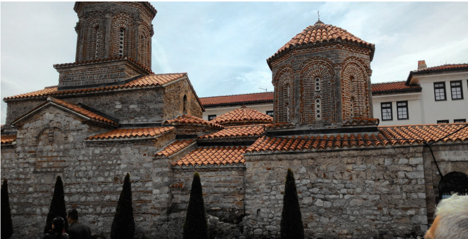
Fotoğraf: Kuzey Makedonya'da Ohri Gölü kenarındaki Sarı Saltuk/Siveti Naum-2015 (Zeki Gürel arşivi)

Bundan sonraki dönemde burada kimin yattığını birkaç kişiye sordum. Hiç kim-seden; hatta bu camide dedesinin ve babasının imam olarak görev yaptığını bildiğim bir aydınımızdan bile doğru cevap alamadım. Ama bunlardan hiç biri; ‘Burada Arnavut Baba yatıyor’ demedi. Bu yüzden beni duyamayacağını bildiğim halde koca şaire sesleniyorum: Arnavut Müslümanlardan dolayı türbenin bir gün ‘Sveti Nikola’ ya da benzeri yabancı bir isimle anılması ihtimali yoktur, üstat. Bunun için mezarında rahat yat...(Kaya,2008:46-47).