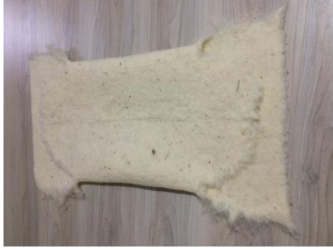
Görsel 1: Uçları Koparılmış Ham Keçe Örneği (Arpaözü, 2020).

üst katın üzerine kapatılacak şekilde esnetilerek kapaklama işlemi gerçekleştirilmelidir (Görsel 2).