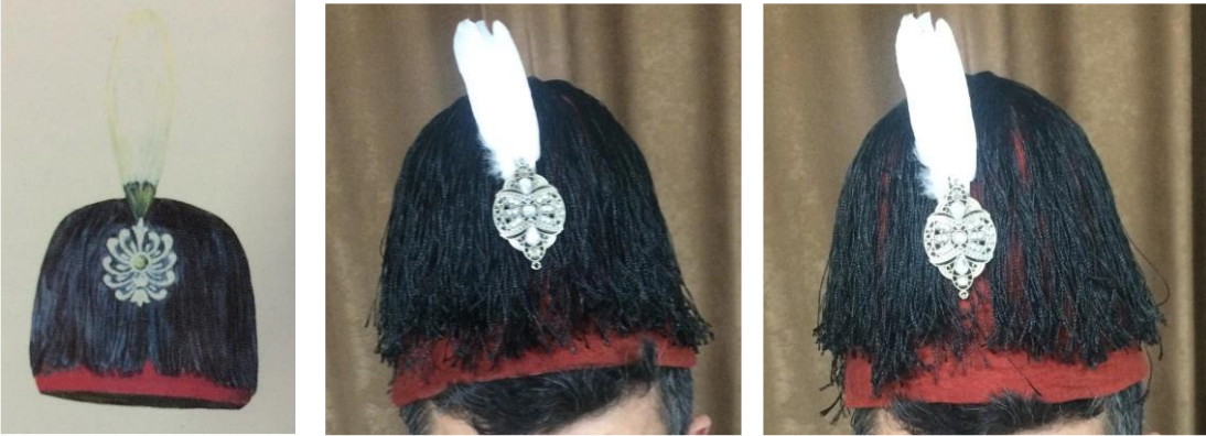
Görsel 7. İlk Merasim Fesi (Küçükerman,1988:178), Yerli ve İthal Yünlerle Uygulamaları (Arpaözü, 2020).