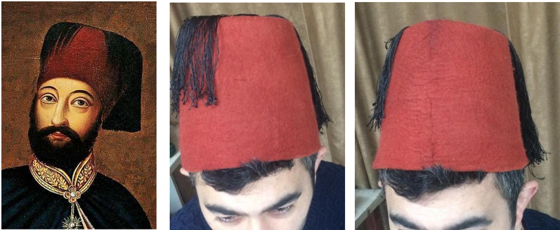
Görsel 4. Mahmudi Fes( https://tr.wikipedia.org/wiki/II._Mahmud ), Yerli ve İthal Yünlerle Uygulamaları (Arpaözü, 2020).