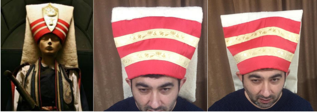
Görsel 3. Yeniçeri Borkü (Usta,2019:64), Yerli ve İthal Yünlerle Uygulamaları (Arpaözü, 2020).