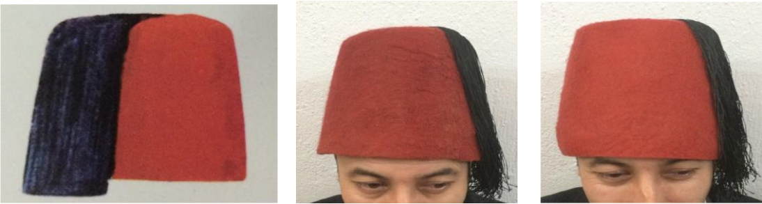
Görsel 8. Asakir-i Mansure-i Muhammediye Fesi (Küçükerman,1988:179), Yerli ve İthal Yünlerle Uygulamaları (Arpaözü, 2020).