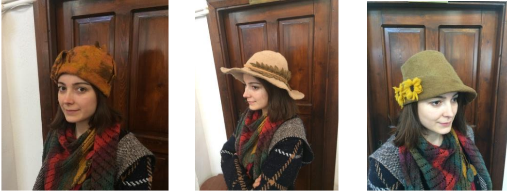
Görsel 12. Keçe Kadın Şapkaları (Arpaözü, 2020).