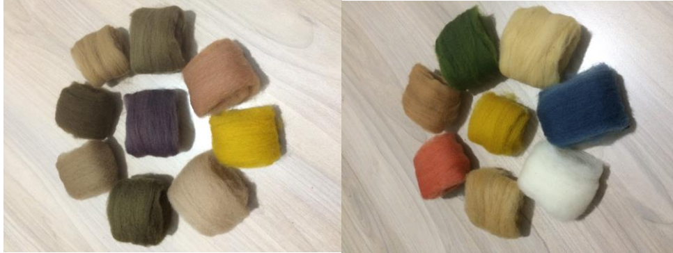
Görsel 9. Doğal Boyama ile Renklendirilmiş Yün Elyafı (Arpaözü, 2019).