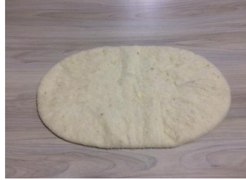
Görsel 2: Kapaklama Yapılmış Ham Keçe Örneği (Arpaözü, 2020).

Hazırlanan ham keçeler hasır üzerine yerleştirilerek ıslatılmalı ve tepme işlemi yapılmalıdır. 20 dakika kadar teptirilen hasır açılarak keçelerin araları açılmalı ve tekrar aynı süre teptirilmelidir. Tepme işlemi biten keçeler hasırdan çıkarılarak katları açılmalıdır. Farklı şekillerde ve yönlerde katlanan keçeler naylon üzerine yerleştirilerek tekrar sarılmalıdır. Islatılıp sarılan keçeler 10 dakikada bir yerleri değiştirilerek pişirme makinesinde teptirilmelidir. İstenilen keçeleşme gerçekleştiğinde her tarafında eşit küçülmeler elde edilmesi gerekmektedir.