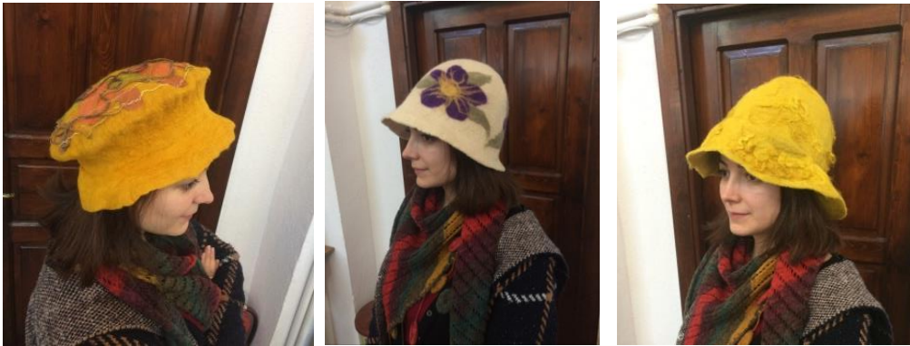
Görsel 11. Keçe Kadın Şapkaları ( Arpaözü, 2020).