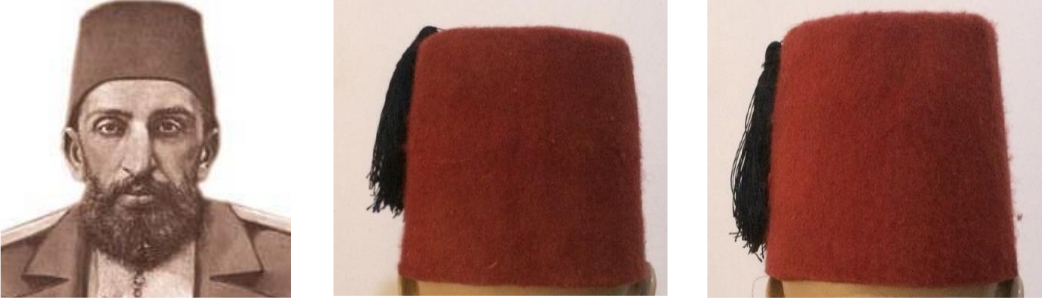
Görsel 6. Hamidi Fes ( https://tr.wikipedia.org/wiki/Abd%C3%BClmeçid ), Yerli ve İthal Yünlerle Uygulamaları ( Arpaözü, 2020).