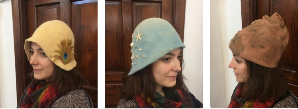
Görsel 10. Keçe Kadın Şapka Örnekleri(Arpaözü, 2020).

19. yüzyıl askeri keçe başlıkların yeniden kullanılabilceği yeni formlar verilerek kadın şapkalarına dönüşmesi örneklendirilerek (Görsel 10, Görsel 11, Görsel 12) görselleri paylaşılmaktadır.