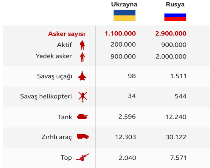
Şekil 1: Rusya ve Ukrayna'nın Askeri Güçlerinin Karşılaştırması.