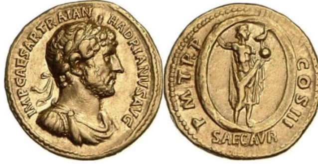
Görsel 7. Hadrian Dönemi'ne ait bir Aureus üzerinde; Aion ( RIC II, Part 3 (second edition) Hadrian 296-297 )