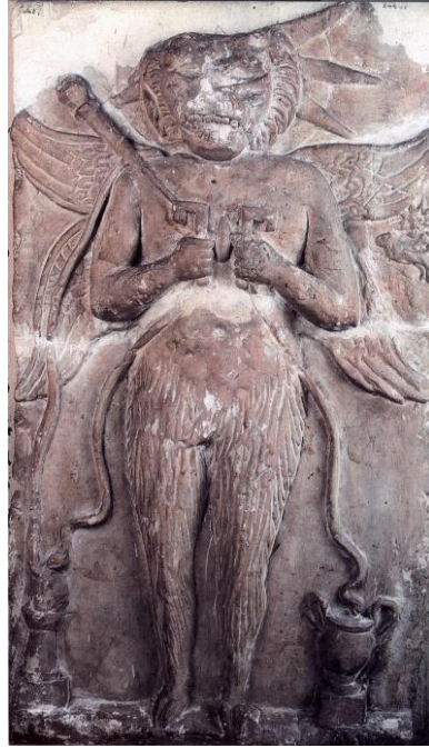
Görsel 2. Oxyrhynchus'dan Aion Kabartması. (Levi, 1944: 275, Fig. 5).