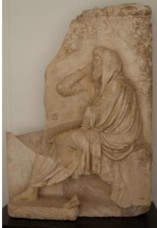
Görsel 4. Zoilos Mezar Anıtı Frizinde Aion Kabartması (Le Glay, 1981: Nr. 7)