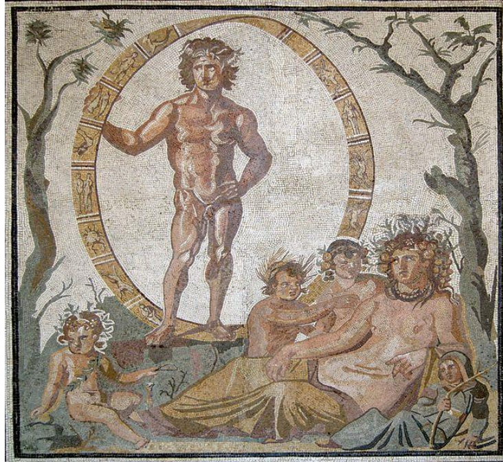
Görsel 6. Sentium'dan mozaik üzerinde Aion ( https://www.theoi.com/Gallery/Z15.2.html )