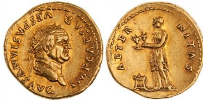
Görsel 8. Vespasian Dönemi'ne ait bir Aureus üzerinde; Aeternitas kişileştirmesi. ( http://numismatics.org/ocre/RIC II Part 1(second edition) Vespasian 838)