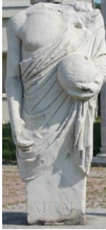
Görsel 5. Aion Heykeli. Kocaeli Arkeoloji ve Etnoğrafya Müzesi. (Sezer, 2015: 97, Res. 8)