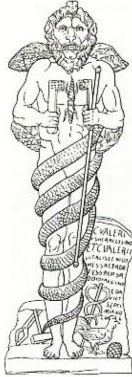
Görsel 1. Mermer Aion Heykeli. (Levi, 1944: 275, Fig. 4).