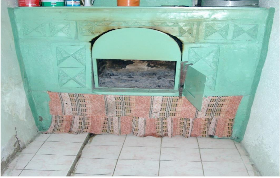
Görsel 3: Zaviyenin Yanındaki Ev İçerisinde Yer Alan Ocak