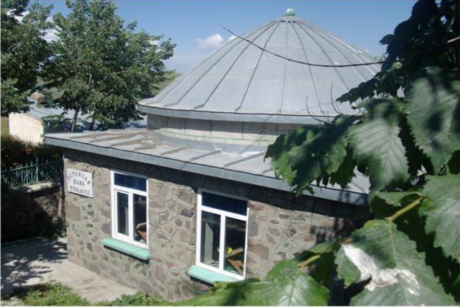
Görsel 1: Seyyid Hasan Ali (k.s) Toparlık Baba Hz. Türbesi