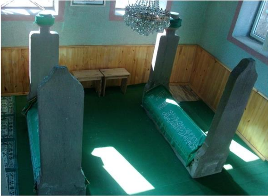
Görsel 2: Türbe İçerisinde Yer Alan Şeyh İbrahim Efendi(Sarı Bey) (Solda) ve Toparlık Baba'nın (Sağda) Kabirleri