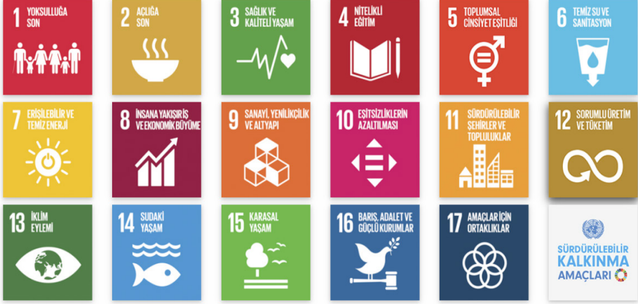
Şekil 1. BM Sürdürülebilir Kalkınma Amaçları, https://www.unwto.org/tourism-in-2030-agenda (Erişim tarihi: 25.04.2022).