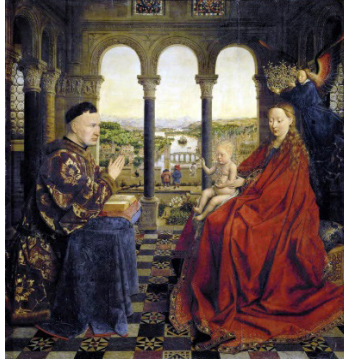
Resim 1. Jan van Eyck, “Rolin Meryemi”, Louvre, Paris (Kaynak: Bell, 1999, s.26)