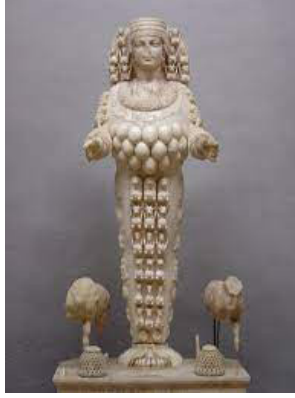
Resim 10. Efes Artemisi, Selçuk Müzesi

Anadolu'daki Artemis figürü ise daha önce betimlenen figürlerden çok daha farklı bir dönüşüm yaşar. Aristokrat ve mesafeli Artemis heykelleri, Anadolu'da bin memeli kollarını uzatmış bir Tanrıça'ya dönüşmüştür (Resim.10).