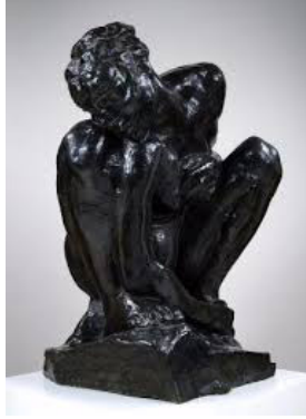
Resim 12. Rodin, Çömelmış Kadın, Sculpture in the National Museum of Western Art, Tokyo

Auguste Rodin'in, 1882 yılında yaptığı "Çömelmış Kadın"(Resim.12) heykeline baktığımızda, bedeni temsil eden bir heykel buluruz ve özellikle de Avrupa sanatının geçmişi göz önüne alındığında kadın bedeninin alışılmadık bir pozu vardır. Ne gevşek, ne de huzur içinde ya da açık duran heykel, izleyiciye, özellikle erkek izleyiciye açık değildir. Kadın figürü, hareket yörüngelerine sarılır. Rodin'in figürü olası görüntüleyenlerden uzaklaşmaktadır. Dikey heykeller için tipik olanlardan daha çok, aşağıda olana bağlı, yerle- Gaia ile ilişkilidir.