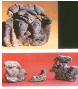
Resim 2. Ana Tanrıça Heykelciği, Ankara Anadolu Medeniyetleri Müzesi

Tarih öncesinin en erken dönemlerinden başlayarak tek tanrılı dinlerin dönemlerine kadar süren, tüm Akdeniz yöresine, kuzey ülkelerine ve Asya'nın içlerine kadar yayılan, birçok uygarlık ve kültürde farklı adlarla anıldığı halde aynı arketipe indirgenebilen Ana tanrıça dininin kaynağı Anadolu olarak kabul edilmektedir (Erhat, 1972, s.33). Kybele Anadolu'nun en önemli tanrıçasıdır. Doğanın doğurucu ve besleyici niteliği onda dile getirilmiş, zamanla doğurganlıktan bolluk, verimlilik ve ürün kaynağı olma niteliği kazanmış ve daha sonraları karşılaşılan tanrıçaların öncüsü olmuştur (İndirkaş 2007, s. 68). Çatalhöyük (Resim.2) ve Hacılar'da yapılan kazılar, Ana Tanrıça figürünün İ.Ö. 7000-6500 yıllarına kadar geriye gittiğini ortaya koymuştur. Hacılar'da yapılan kazılarda bulunan, ayakta duran kadın figürini (Resim.3) Kalkolitik döneme tarihlenmektedir. Neolitik dönemin ana tanrıçasına kıyasla daha narin bir bedene sahiptir.