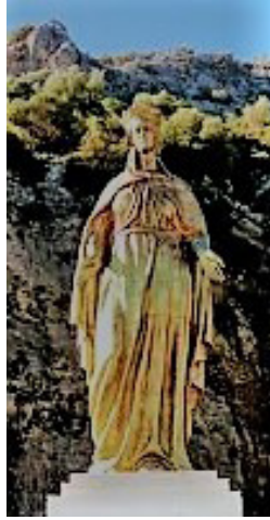
Resim 11. Meryem Ana-Efes Meryem Ana Evi

Anadolu'da Efes'te öldüğü düşünülen Meryem Ana'nın (Resim.11) duruşuna benzeyen elleri açık ve kutsar biçimde gösterilen Ana Tanrıça'nın birden fazla memeleri öncelikle dikkati çeker. Burada Ana Tanrıça'nın en önemli unsurlarından biri olan besleyicilik ön plana geçmiştir. Bin memeli Kybele söz konusu olduğunda, birçok araştırmacı için, memeler beslenme kaynağının, ana sütünün geldiği ve bulunduğu nesne olarak ele alınmıştır. Bir başka görüş, Efes Kenti'nin koruyucusu ve Ana Tanrıça'nın diğer bir ismi olan Artemis'in sembolü bin memeli Artemis heykelinde görülen "meme" formundaki sarkıtların "Bal Arısı oğulları" olduğudur. Türk yazın-bilimci Halikarnas Balıkcısı Cevat Şakir'e göre de çoklu memeler birer arı oğlu olarak değerlendirilmiştir. Cevat Şakir'in, "Anadolu Tanrıları" ve "Hey Koca Yurt"