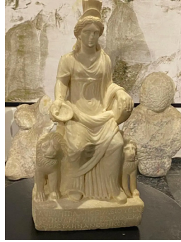
Resim 6. Kybele Heykeli, Afyonkarahisar Arkeoloji Müzesi

Phrygia sık sık saldırılara uğrasa da Ana Tanrıçanın tapım merkezi olarak bağımsızlığını ve din devleti olarak etkisini sürdürmüştür. Aynı durum Efes Artemision’da da görülmektedir. Kybele tarihe Phrygia tanrıçası olarak geçmiştir. Genellikle iki yanında aslanla, büyük davulu ile ve başında yüksek polosuyla gösterilen ana tanrıça-Kybele’nin (Resim. 6) şimşek, topuz ve çift ağızlı balta gibi atribüleri onun savaş ile ilgili olduğunu da vurgular.