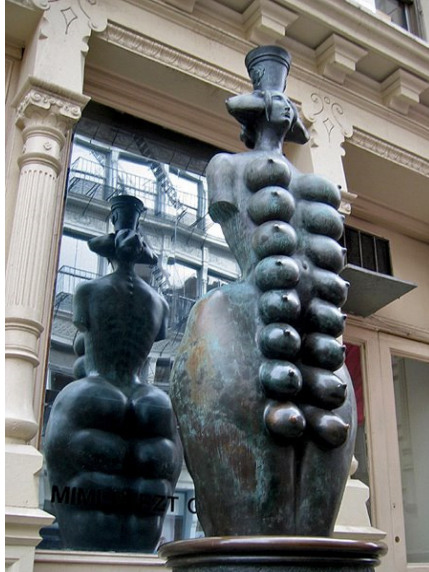
Resim 14. Mihail Chemiakin, Cybele, New York

Bin memeli Efes Artemis heykel tipinin esinlediği New York'da bulunan, Mihail Chemiakin'in bronz yapıtını (Resim. 14) çağdaş bir Kybele yorumu olarak görmekteyiz. Mehmet Aksoy'un Güzel Kibele diye adlandırdığı mermer heykeli de (Resim. 15) çağdaş bir Kybele yorumu olarak Ana Tanrıça'nın temsili ardılları olarak değerlendirilebilir. 7