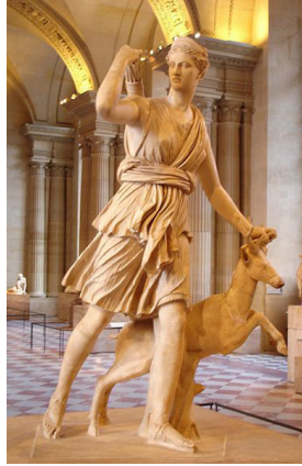
Resim 9. Artemis Heykeli, Louvre Müzesi

Kybele'nin Yunan-Roma mitolojisindeki ardılı Artemis'tir. Ana Tanrıçanın eski çağlardan bu yana yapılan sayısız heykelticiklerinin, bazı örneklerinde belden aşağısının son derece büyük betimlenmesi doğurganlığı temsil etmesindedir. Gaia'nın karanlıktan doğan ışık olması gibi Artemis de, Phoebе-ışık tır (Çelgin, 1986, s.36). Anadolu'da Ephesos kentinde etkin olan Artemis kültürünün Tanrıçası Artemis'in 5 görsel betimlemeleri, güzel, endamlı ve ciddi yüz ifadesiyle, tanrısal bir bakireyi temsil etmektedir (Resim. 9).