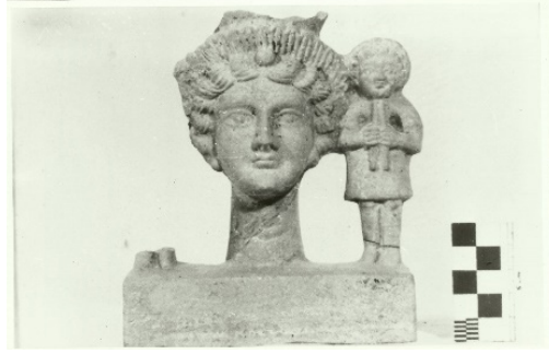
Resim 7. Kybele Grup Heykeli, İstanbul Arkeoloji Müzesi, Fotoğraf Turhan Bilgili

Günümüzde sanatta, postmodern bir yaklaşımda olduğu gibi, o dönem için de benzer bir yönelim söz konusudur diyebiliriz.