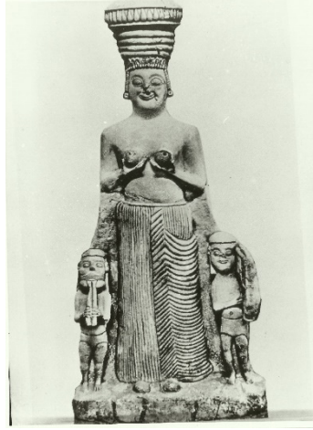
Resim 5. Kybele Heykeli, Ankara Anadolu Medeniyetleri Müzesi

Phrygia sık sık saldırılara uğrasa da Ana Tanrıçanın tapım merkezi olarak bağımsızlığını ve din devleti olarak etkisini sürdürmüştür. Aynı durum Efes Artemision’da da görülmektedir. Kybele tarihe Phrygia tanrıçası olarak geçmiştir. Genellikle iki yanında aslanla, büyük davulu ile ve başında yüksek polosuyla gösterilen ana tanrıça-Kybele’nin (Resim. 6) şimşek, topuz ve çift ağızlı balta gibi atribüleri onun savaş ile ilgili olduğunu da vurgular.