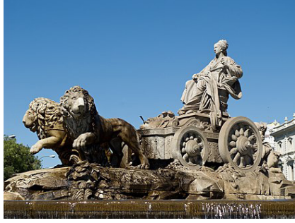
Resim 8. Francisco Gutierrez, Kibele Çeşmesi, 1780, Madrid