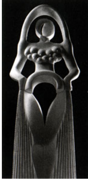
Resim 15. Mehmet Aksoy, Güzel Kibele, 2002