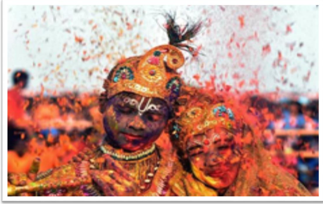
Görsel 4. Holi Festivali

Holi’nin amacı yaşamın sürekliliğini devam ettirmektir. Bu sebeple kurallara aykırı davranmak, geleneksel uygulamalardan uzaklaşmak, yasaları çiğnemek, utanma duygusunu bir süreliğine kaybetmek normal karşılanmaktadır (Arslan, 2014). Holi Festivali, yumuşak güç unsuru olarak yurtdışı pazarında da kabul görmüştür. Globalleşen ve insanlar tarafından oldukça ilgi çeken bu festival, dünyanın birçok ülkesinde kutlanmaktadır.