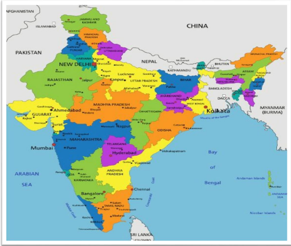
Görsel 1. Hindistan Haritası