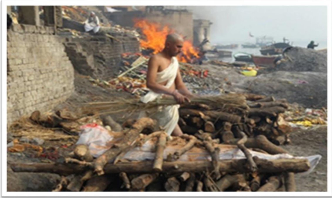
Görsel 3. Ghat, Yakma İşlemi Öncesi

Cesetler ‘ ghat ’ adı verilen, tahtaların üst üste yığılmasıyla oluşturulmuş düzeneğin içine yerleştirilip yakılmaktadır. Yakma işlemi sonrası insanlar nehre gidip yıkanmakta ve yakınları külleri toplayarak bir kabın içine koymaktadır. Bu kap bir süre ölen kişinin yakınlılarının evinde kalmakta, sonrasında Ganj nehrine yeniden dökülmektedir.