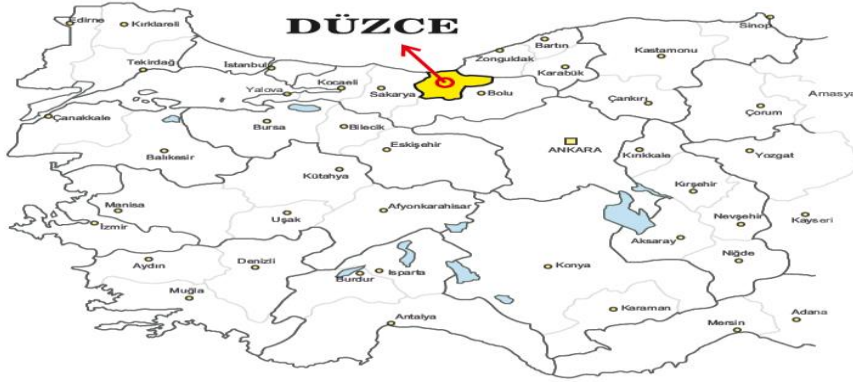
Şekil 1: Düzce İlinin Coğrafi Konumu

Düzce'nin Büyükşehirlere (İstanbul, Kocaeli, Ankara ve Bursa gibi) komşu olmasının getirdiği coğrafi avantajın yanı sıra 4. dereceden teşvik alan iller kapsamında olması ve sahip olduğu zengin ekonomik çeşitlilik bölgenin cazibe merkezi olma yolundaki en önemli avantajlarıdır.