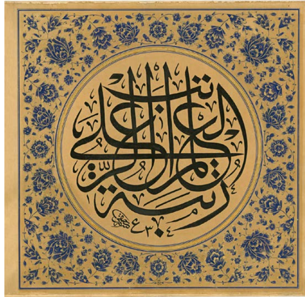
Görsel 1 Muhsin Demironat imzalı celi sülüs levha. Türkp petrol Vakfı koleksiyonu. Env. no: TPV/ L.0074.

Eserlerin seçilerek buraya konu edilmesinde yapıldıkları dönem, sanatkârları ve tezyini özellikleri etkili olmuştur. Yakın tarihimize ait bu 3 güzide eser, dönemlerinde sanata yön veren üslup sahibi sanatkârların (müzehhip ve hattatların) elinden çıkmış yüksek bir sanat anlayışı ve birikimin ürünleri olup geleceğe ışık tutacak niteliktedir. Türk sanatlarında usta-çırak münasebetinin önemini, sanatın nesilden nesile aktarılışını levhalar üzerinden ve tezhip cihtinden görebileceğimiz bu eserler koleksiyonda TPV/ L.0074, TPV/ L.0106, TPV/ L.0084 envanter numaraları ile kayıtlıdır.