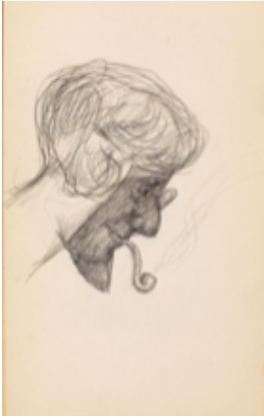
Resim 5: Meşher'de Ben, Sen, Onlar: Sanatçı Kadınların Yüzyılı isimli sergide yer alan Nevin Edhem Hamdi'ye ait kara kalem çizim (Edhem Eldem Koleksiyonu).