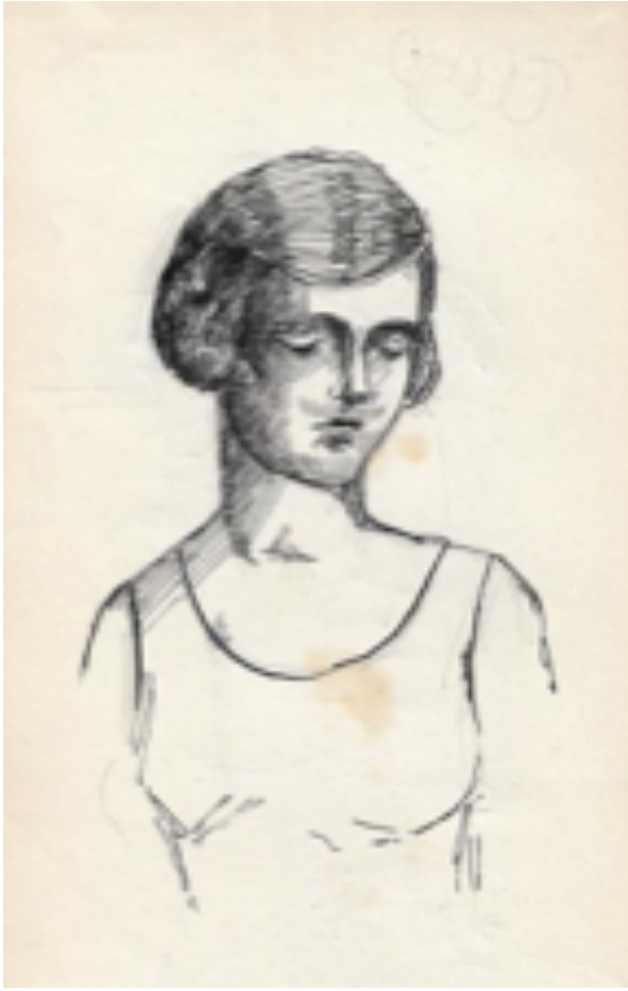
Resim 7: Nevin Edhem Hamdi'nin çizim defterinden genç bir kız figürü (Edhem Eldem Koleksiyonu).