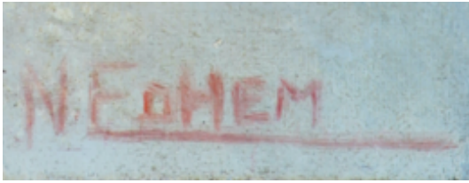
Resim 2: Nevin Edhem Hamdi'nin Kadın Portresi isimli eserinin ön yüzünde yer alan imzası.