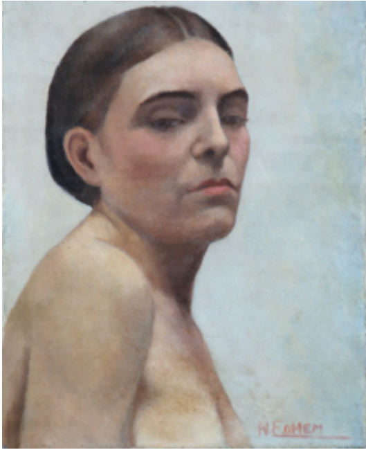
Resim 1: Nevin Edhem Hamdi, Kadın Portresi , 1930 civarı, Tuval üzerine yağlı boya, 41 x 32,5 cm (İstanbul Resim ve Heykel Müzesi Koleksiyonu).