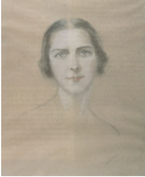
Resim 9: Nevin Edhem Hamdi, Aynalı Otoportre.