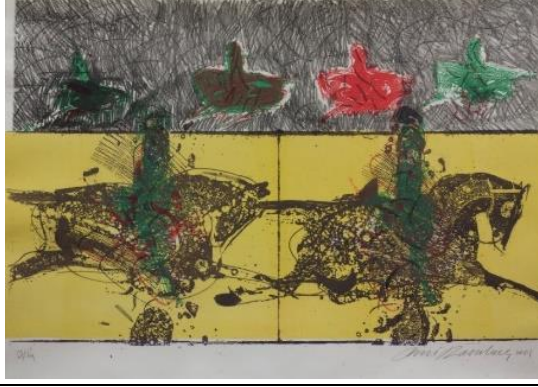
Resim 7. Fevzi Karakoç, Arka Arkaya, 2001, Litografi, 50x70 cm (URL 9).

Renk: Resimde arka planda üst kısımda gri ve tonları iç içe geçmiş bir vaziyette durmaktadır. Altta kiye bölünmüş karelerde ise arka plan sarı renktedir. Onun altında yer alan küçük dikdörtgen arka plan ise gridir. Resimde sanatçı yeşil, siyah kırmızı renkler az ve gri rengi çok yoğun olarak kullanılmıştır. Resimdeki çizimler de kontrastın etkisi belirgin şekildedir. Resimde yer alan üst kısımdaki atlar yeşil ve kırmızı renktedir. Alt kısımda yer alan atlar ise siyah konturlu kahverengidir. Atların üzerlerinde yer alan adamlar atların rengine bürünmüştür. Sadece alttaki adamlar yeşil renktedir. Resimde genel olarak renklerin kromaları yüksektir.