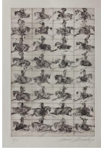
Resim 6. Fevzi Karakoç, Karede, 1991, Gravür, 50x33 cm (URL 8).

boyutları sebzelerden daha küçük bir halde gibi gözükmeştir. Sola bakan at ejderha görünömlü ve öfkeliştir. Türk mitolojisinde nar güzelliđi, bolluk ve bereketi, biber ise acı ve ölümlü simgelemektedir. Bu eserde nar ve biber mitolojik öğeler taşımaktadır.