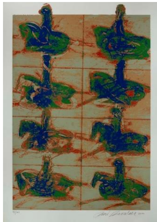
Resim 8. Fevzi Karakoç, Foto Karelere, 2000, Serigrafi, 50x70 cm (URL 10).

Arka yapı: Çoğu çalışmada olduğu gibi atlar yer almakta, rastgele konumlandırılmış bir şekilde durmaktadır. Resimde atlar gerçek görüntülerinin haricinde farklı bir kimlik içinde gibidirler. Askerler ve atlar zırhla donatılmış ve savaş meydanında koşuyor gibi görünmektedir. Eserin üst kısmında bulunan dört at sırasıyla; savaşa katıldık, savaştık, kan döktük ve kazandık anlamında tasvir edildiği izlenimini yaratmaktadırlar.