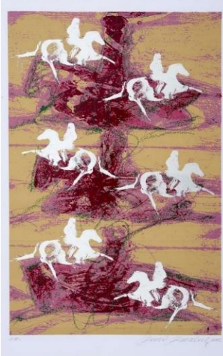
Resim 4. Fevzi Karakoç, Geçmiş Üstüne Atlar, Serigrafi (URL 6).

Arka yapı: Çalışma da yine soyutlama mevcuttur. Atlar havada gibi görülmekte ve resmedilen atlar ve insanlar stilize şekilde tasvir edilmiştir. Atlıların aralarında kaktüsü andıran bitkiler görünmektedir. Bu sebeple eserin çöl ortamını andıran bir teması olduğundan söz edilebilir. Atlar havada uçar vaziyette yer almaları kompozisyona manevi açıdan farklı anlamlar yüklemektedir. Yine sanatçının uçan atlarla mitolojiye bir gönderme yaptığı söylenebilir.