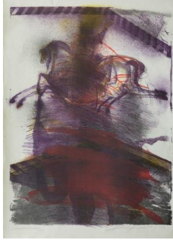
Resim 2. Fevzi Karakoç, Atlı Sultan, 1998, Litografi, 78x56 cm (URL 4).

Renk: Resimde arka planda siyah kırmızı ve beyaz renk hâkimdir. Özellikle kırmızı beyaz ve siyah renkleri resimde çok yoğun olarak kullanılmış. Resimdeki renkler tam olarak belirgin bir halde bulunmuyor. Eserin ismiyle bağlantılı olarak Sultan'ın başında sarı renkli noktalamalarla kavuk yapılmıştır. Atın kafasının içi siyah renkle doldurulmuş. At ve üstündeki insan tamimiyle siyah renkte. Resmin sağ köşesinden çapraz şekilde üste doğru giden ve adamın tam üstünden geçmiş siyahlı beyazlı aynı hizada birbirini takip eden eğik çizgiler mevcut. Resimde genel olarak renkler mat ve soluk olarak yer almıştır.