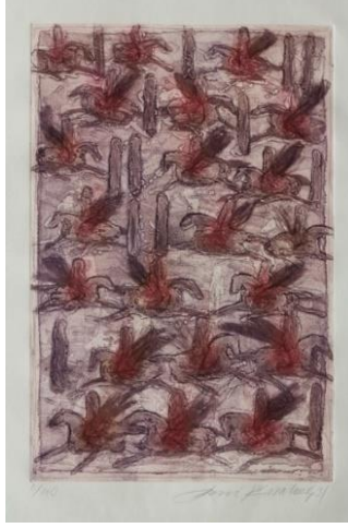
Resim 3. Fevzi Karakoç, Atlılar ve İnsanlar, 1991, Gravür, 50x33 cm (URL 5).

Renk: Resimde koyu kırmızı ve beyaz iç içe geçmiş şekilde hakim renkler olarak yer almıştır. Özellikle beyaz kırmızı ve siyah renkleri resimde çok yoğun olarak kullanılmış olduğu görülür. Resimde arka planla, net kontrast alanlar vardır. Atların renkleri kırmızı ve beyazın iç içe geçmesiyle oluşmuştur. Resimde genel olarak renkler soluk ve nötr renkler tercih edilmiştir.