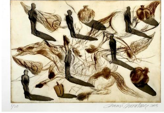
Resim 5. Fevzi Karakoç, Eski Katmanlar Üstüne, 2005 (URL 7).

Arka yapı: Genel olarak çalışma da soyut bir işleme tazı vardır. İnsanlar havada gibi gözükmekte ve resmedilen atlar ve insanlar tam olarak ne olduğu belli olmayacak şekilde tasvir edilmiştir. Ancak bu durum figürlerin boş ve beyaz olarak ele alınması, manevi olarak kompozisyona değişik anlamlar yükleyebileceği düşünülmektedir. İç içe geçmiş atlarla sanatçı sanki kendi ruh halini atlarla anlatmıştır. İzleyicide beyaz tonlarındaki atlar, pembe tonlarındaki atların üzerinde geçip giden anılar ve hayaller gibi tasvir edilmiş hissiyatı uyandırmaktadır.