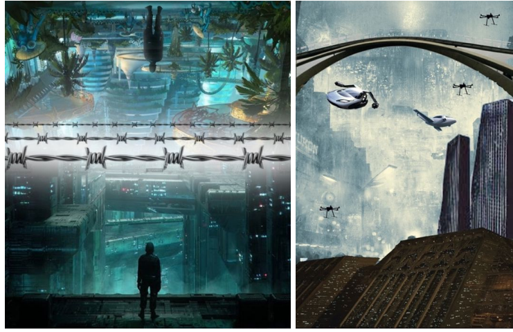
Şekil 3.5. Distopya ve ütopya kavramlarına dair gerçekleştirilen katılımcı çalışmaları örnekleri.