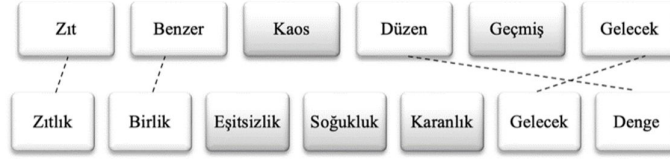
Şekil 3.8. Modül 1 ilk uygulama girdi ve çıktı olarak kavram setlerinin karşılaştırılması.