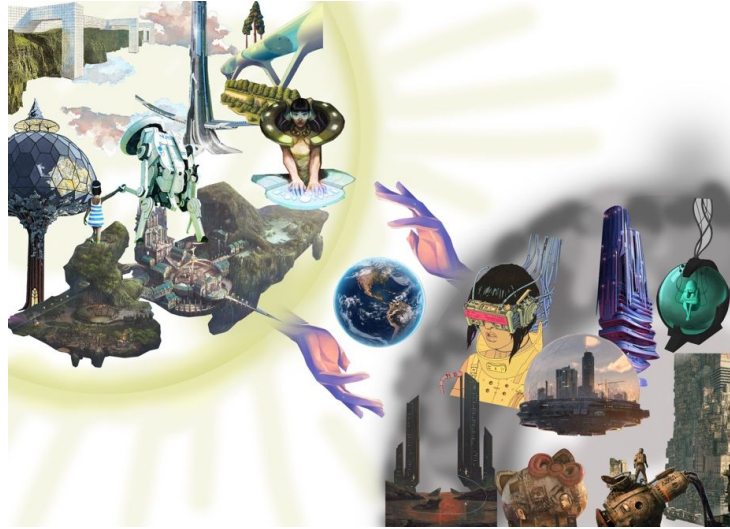
Şekil 3.4. Distopya ve ütopya kavramlarına dair gerçekleştirilen katılımcı çalışmalarını örnekleri.

Bu bağlamda katılımcıların gerçekleştirmiş oldukları çalışmalar ve sunumlarında ifade ettikleri temel kapsam iki kavramın zıtlığı ile başlayan ancak iç içe geçen ve birbirinden beslenen yapısal bütünlüğünü ele almaktadır. Buna göre çalışmalar her ütopyanın kendi içinde bir distopyayı barındırdığı ve distopyanın kavramsal olarak günlük hayat ve olası gelecek senaryolarında daha güçlü bir yere sahip olduğu yönündeki fikirleri savunmaktadır.