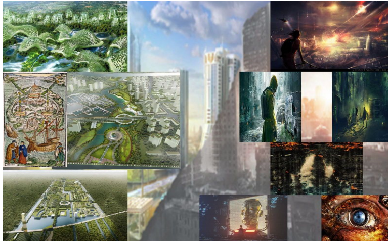
Şekil 3.6. Distopya ve ütopya kavramlarına dair gerçekleştirilen katılımcı çalışmaları örnekleri.

Katılımcı çalışmalarının bir arada değerlendirilmesi sonucu ulaşılan kavram seti Şekil 3.7’de yer almaktadır. Buna göre çalışmalara ait açıklamalarda da sıkça görülen zıtlık ve birlik kavramları çalışmaların tamamında görülen ortak kavramlar olmuştur. Zıtlık ve birlik kavramları ütopya ve distopyanın birbiriyle ilişkini vurgulamak üzere kullanılırken, mekânsal unsurlar ve toplumsal yapı örnekleri üzerinde durulmuştur. Bunların yanı sıra katılımcılar tarafından vurgusu yapılan bir