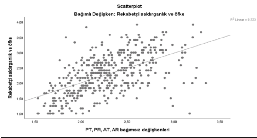
Şekil 3. Değişkenlere ilişkin saçılım grafiği

Yordayıcı (bağımsız) ve yordanan (bağımlı) değişkenler arasındaki ilişkinin doğrusal olma durumu ve ölçek puanların normal dağılım gösterip göstermediği grafiklerle gözlemlenmiştir. Standardize edilmiş açıklanan (yordanan) değer için çizilen histogram ve dağılım eğrisinin normal dağılım gösterdiği görülmektedir (Şekil 2).