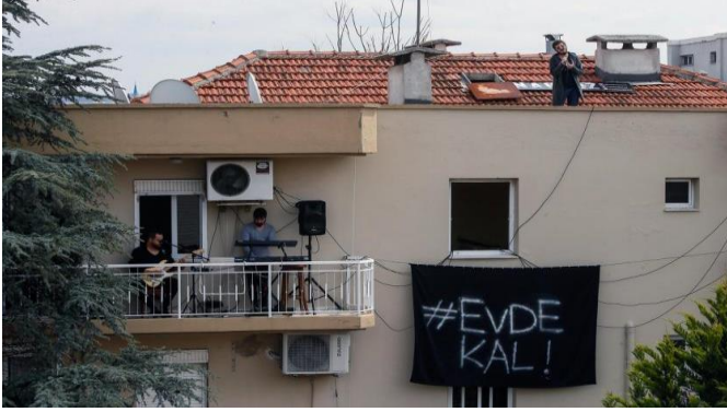
Resim 1. İzmir’de bir grubun Covid-19 dönemi balkon konseri.

Mahallenin, “aileden kamuya öğretici bir geçiş rolü üstlenen sıcak kamu alanı” (Aktaş, 2015: 37) olarak tanımlanmasındaki “aşinalık” duygusuna yapılan vurgu, bu süreçte kısmen de “hastalığın izlenmesi” şeklini almış; etraftaki dairelerden gelen öksürük vb. seslerin izlenmesine, cep telefonlarına indirilen teknolojik programlarla yakınlarda hasta olup olmadığının araştırılmasına dönüşmüştür.