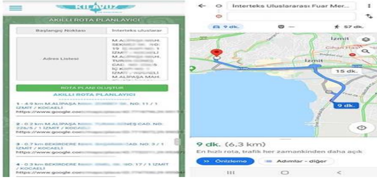
Resim 6. Kocaeli Belediyesi 'Akıllı Rota Planlayıcı' uygulaması (Kaynak: Kocaeli.bel., 2020).

Türkiye’de de Bursa Nilüfer Kent Konseyi , Mahalle Komiteleri iş birliğiyle koronavirüs salgınıyla mücadele döneminde zorda kalan vatandaşların ihtiyaçlarına destek olmak için “Dayanışma Marketi”ni hayata geçirmiştir (Nilüfer.bel, 2020).