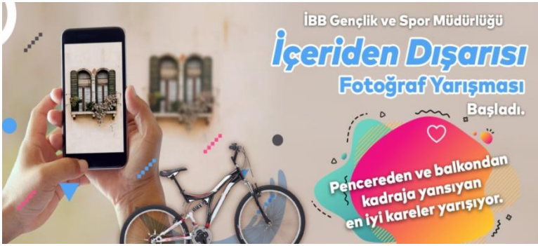
Resim 3. İstanbul Büyükşehir Belediyesi “İçeriden Dışarı” yarışması.

Belediyeler, pandemi döneminde özellikle duygusal dirençlilik açısından önem kazanan bu göz erişimini desteklemek için fotoğraf yarışmaları düzenlemişlerdir 3 .