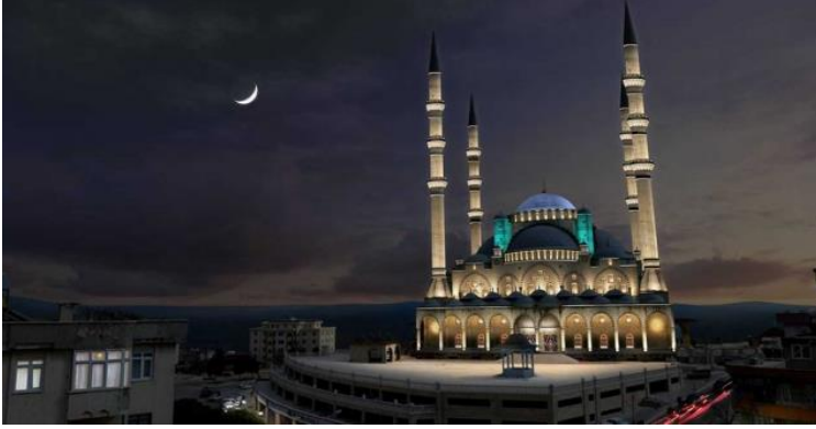
Resim 14. Covid-19 süresince camilerde her ezan öncesi okunan selâlar.

davranmıştır. Kosova'daki Yerel Yönetim ve Belediye Desteği (DEMOS) projesi, belediyelerin süreçte ilerlemesini desteklemede ve çevrimiçi platformlar aracılığıyla vatandaş katılımını teşvik etmede rol oynamıştır. Belediyelerin DEMOS projesi tarafından sağlanan belediye hibesine hak kazanabilmesi için bir performans sistemine bağlanan hibe, belediyelerin yerel yönetim, yönetim ve şeffaflık ve bütünlük olmak üzere üç ana öncelik altında yer alan projeleri üstlenmeleri koşuluna bağlanmıştır (Helvetas, 2020).