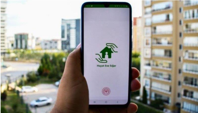
Resim 2. HES uygulaması ile sağlık kontrolü.

Mahallenin, “aileden kamuya öğretici bir geçiş rolü üstlenen sıcak kamu alanı” (Aktaş, 2015: 37) olarak tanımlanmasındaki “aşinalık” duygusuna yapılan vurgu, bu süreçte kısmen de “hastalığın izlenmesi” şeklini almış; etraftaki dairelerden gelen öksürük vb. seslerin izlenmesine, cep telefonlarına indirilen teknolojik programlarla yakınlarda hasta olup olmadığının araştırılmasına dönüşmüştür.