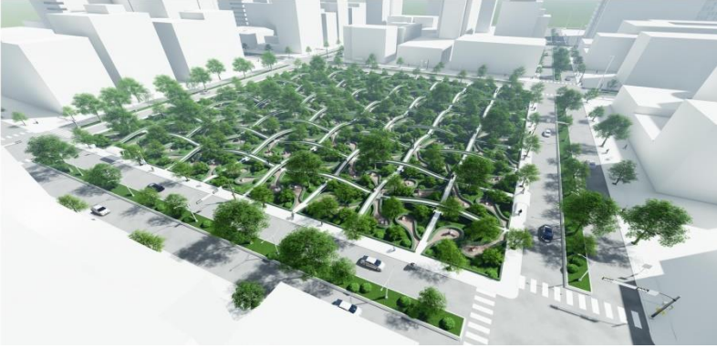
Resim 10. Seul Kenti Covid-19 Sonrası park yarışması önerileri (Kaynak: Archdaily, 2020).

Covid-19 dönemi, kentsel park ve yeşil alanların hem varlığını, hem erişilebilirliğini, hem de kentsel düzlemde eşit dağılım durumunu da sorgulatmıştır (Ensarioğlu, 2021: 31). Bu alanların kullanımında sosyal mesafenin korunması için de çizimler gerçekleştirilmiş; yeni tasarım arayışlarına girilmiştir.