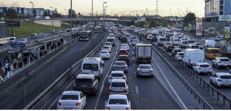
Resim 8. Metropol kent özel araç sahipliği yoğunluğu.

mekânsal düzenlemeyi gerektirmiştir. Simmel (2009: 325), kentin büyümesini, servetin artmasını benzetir. Ona göre, “belli bir sınır aşıldığında” kent, “geometrik olarak genişler. “Şehirden sarkan her iplikten, adeta kendi kendilerine yeni iplikler çıkması” metaforunun açıkladığı üzere, “toprak rantı da kendiliğinden büyür”. Bu geometrik büyümenin zararları pandemi döneminde açıkça görülmüştür.