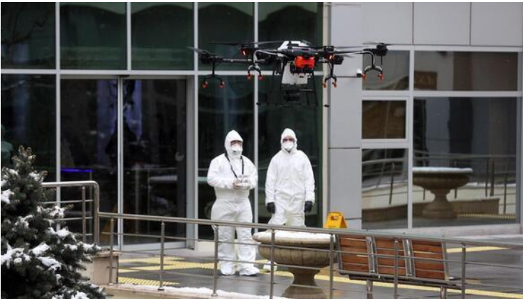
Resim 7. Ankara Yenimahalle Belediyesi dronla ilaçlama çalışması (Kaynak: Hürriyet Haber, 2020).