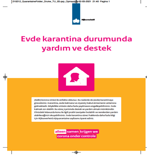
Resim 5. Hollanda Hükümeti Karantina Broşürü çevirisi. (Kaynak: Government.nl, 2021).

Karantina altındaki mahallelere belediyelerce yemek servisleri yapılmış, bu servislerde öğrencilerden ve gençlerden oluşan dayanışma ağları ile alışveriş hizmetleri gerçekleştirilmiş, gıda yardımları sürdürülmüştür. Hollanda hükümeti tarafından hazırlanan bilgi broşürü ile evde karantinada kalan kişilerin, öncelikle yakın çevrelerine yönlendirildikleri, böylece mahallelilik ve komşuluk ruhuna atıf yapıldığı, daha sonra belediye gibi resmi kurumların da ulaşım bilgilerinin verildiği görülmektedir. Broşür, “Çevrenizde alışverişinizi yapacak kimse yok mu? Çevrenizdekilerden (örneğin yakınınızdaki tanıdık veya aileden) yardım istemekten çekinmeyin.” gibi ifadeleri ile bu konuda kişileri cesaretlendirmektedir. Ayrıca karantinadaki kişilerin alışveriş gereksinimi, çocukların bakımevine ulaştırılmaları, gelir desteği programları, evde bakım ve destek, internet ve bilgisayar talebi gibi hemen her tür ihtiyaçları için belediyeye başvurabilecekleri belirtilirken, sıcak ev yemekleri gereksinimi ise malzemeleri ödenmek koşuluyla, sıcak ev yemekleri yapan en yakın mahalle ve semtteki gönüllü kuruluşlar tarafından yapıp teslim edilmiştir. (Government.nl, 2021). Mahalle halkının dayanışmacı ve katılımcı tavırlarının güzel örneklerinden biri olan bu örgütlenme, birçok başka yerde de oluşmuştur.