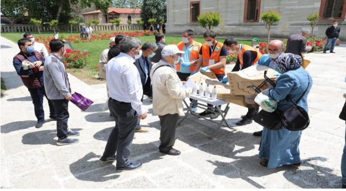
Resim 15. Edirne belediyesi tek kullanımlık seccade dağıtımı (Edirne.bel., 2020).

Özetle, tüm dünyada, politik kalkışmaları baskılayabilmek ve yerel halk direnişlerine etkin müdahale amacıyla genişletilmiş ve kameralarla donatılmış kentsel iktidar mekânları, yeni düşmanın damlacık ölçeği karşısında açıkça afallamıştır. Sağlık politikalarının önemi bir kez daha açığa çıkmış, sağlıklı kent nosyonunun mutlaka belediyelerin öncelikleri arasında olması, politik yarışların büyük projeler üzerinden değil, daha sağlıklı, küçük ölçekli ve katılımcı olması gerektiği, “sağlıklı kent” (Tunçer, 2006) nosyonunun her zamankinden daha önemli olduğu anlaşılmıştır.