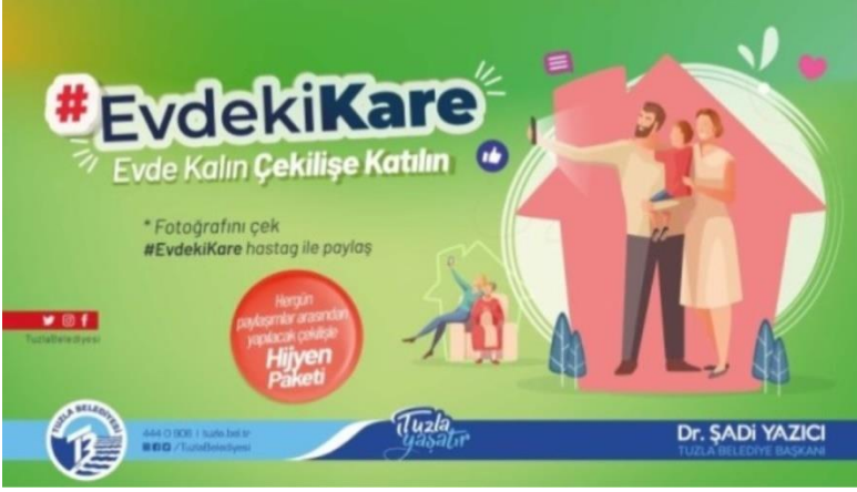
Resim 4. Tuzla Belediyesi'nden 'Evdeki Kare' Fotoğraf Yarışması.