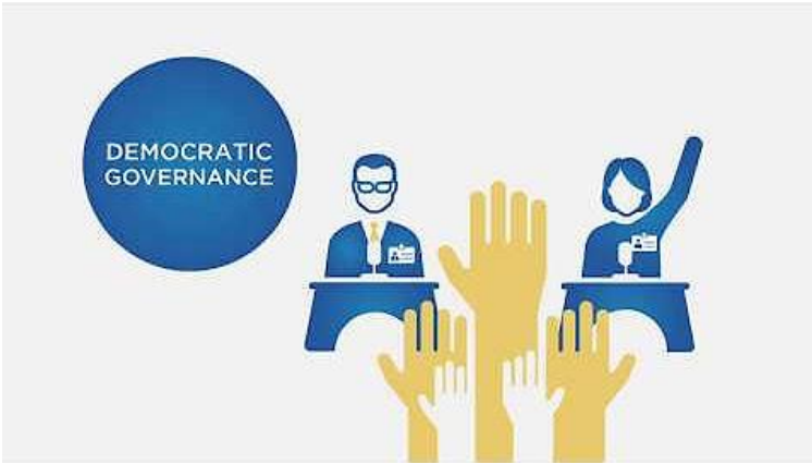
Resim 13. Helvetas Kosova Projesi.

Türkiye ölçeğinde bakıldığında ise “mahalle ölçütü”ne dair tüm olumsuzlamaların, 6360 sayılı kamuoyunda “Bütünşehir Yasası” olarak bilinen yasayla oluşan ölçekte hükümsüzleştiğini belirtmek gerekmektedir. Kentin “ilçe” ölçeğini “mahalle” olarak tanımlamakla, mahalle kavramına dair söylenen tüm önermeler geçersizleştirilmiştir. Mahalle yönetiminin ise sadece muhtarların muhbirleştirildiği bir sistemle ifade edilebilecek olan çerçeveden çok daha farklı bir kuramsal çerçevesi bulunmaktadır.