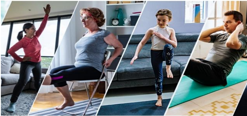
Resim 11. Pandemi dönemi evde egzersiz.

Kısa süreli sokağa çıkma izinleri döneminde, mahallelerin sahip olduğu kentsel donatı alanları ve kent mobilyaları, açık hava spor aletlerinin varlığı ve sayısı da önemli olmuştur. Spor olanaklarını kadınlar için Hanımlar Lokali, erkekler için de Halı Saha olanağı olarak anlayan (Sancar, 2008: 67) kapalı mekan spor anlayışının devre dışı kaldığı dönemde, belediyeler evde sporu destekleyen yayın saatleri gerçekleştirmiştir (Mersin.bel., 2020).