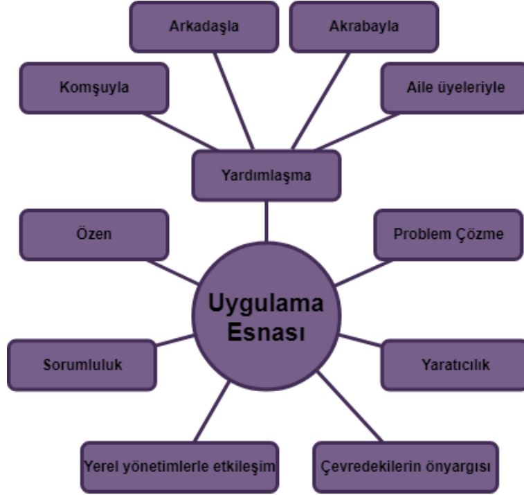
Şekil 4: Sosyal Bilgiler Öğretmen Adaylarının Uygulamalar Esnasında Yaşadıkları Deneyimler

Sosyal bilgiler öğretmen adaylarının hibrit olarak gerçekleştirilen THU dersi kapsamında gerçekleştirdikleri uygulamalar esnasında yaşadıkları deneyimlere ilişkin bulgular Şekil 4'te gösterilmiştir.