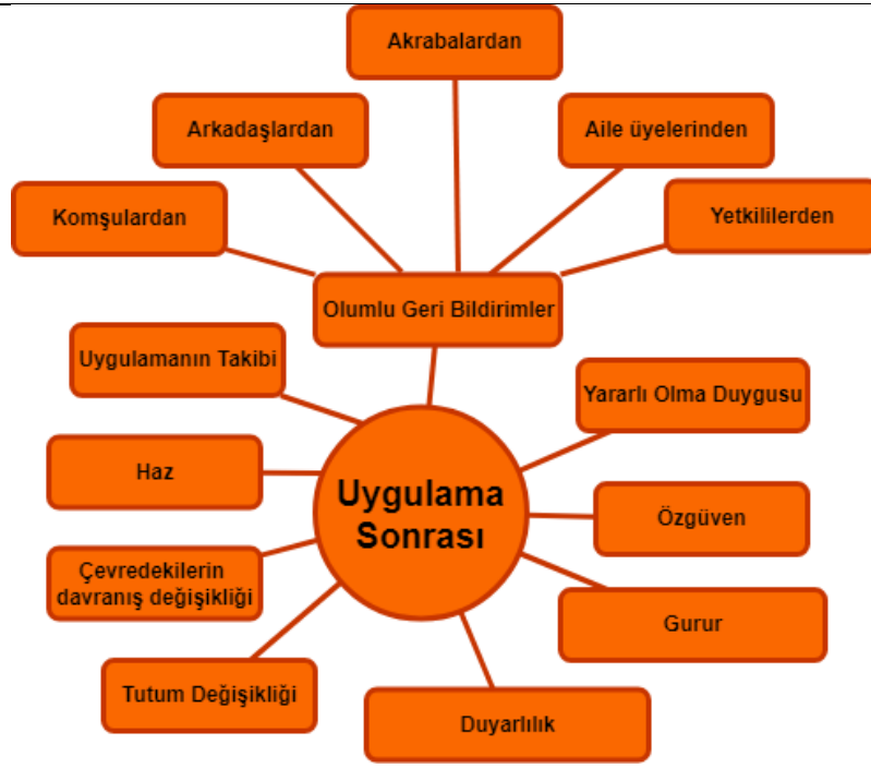
Şekil 5. Sosyal Bilgiler Öğretmen Adaylarının Uygulamalardan Sonra Yaşadıkları Deneyimler

Şekil 5'te görüldüğü üzere sosyal bilgiler öğretmen adaylarının gerçekleştirdikleri etkinlikten sonra birçok olumlu duygular hissettikleri ve kazanımlar edindikleri belirlenmiştir. Özellikle katılımcılar gerçekleştirilen uygulamalardan sonra çevredekilerden olumlu geri bildirimler aldıklarını belirtmişlerdir. Örneğin Buket gerçekleştirdiği etkinlikten sonra komşulardan olumlu tepkiler aldığını "Mahalleden de baya olumlu tepkiler aldım hepsi çok mutlu oldular ve teşekkür ettiler" şeklindeki ifadesiyle; yetkililerden olumlu geri bildirim aldığını da belirtmiştir. Benzer şekilde Derya da aile üyelerinden ve komşularından olumlu geri bildirimler aldığını "Aile üyelerim benim böyle bir etkinlikle uğraşmamı takdir ettiler. Öğretmenimin bu kadar duyarlı olmasına çok sevindiler. Komşularımın, keşke herkes senin gibi olsa gibi tepkiler aldım." şeklindeki ifadesiyle açıklamıştır. Aynı şekilde Leyla'nın "Belediyeyi aradığımda anlayışla karşıladıkları için ve bana yardımcı oldukları için de çok mutlu oldum." şeklindeki ifadesinden yetkililerin kendisine olumlu geri bildirimde bulunduğu anlaşılmaktadır.