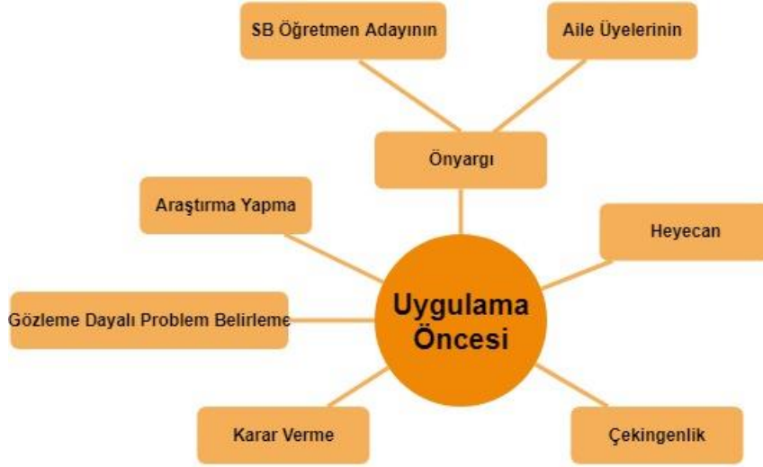
Şekil 3. Sosyal Bilgiler Öğretmen Adaylarının Uygulama Öncesi Yaşadıkları Deneyimler