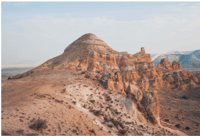
Resim 1. Topraktepe, Nevşehir

Kültür turizmi kendi içerisinde farklı kategoriler altında değerlendirilmektedir. "Yüksek Kurumsallaşmış Kültür" olarak tanımlanan alt birim genel olarak tarihi yerleri, müzeleri, sergileri, tiyatro ve edebiyat faaliyetlerini ifade etmektedir. Film, eğlence, spor, alışveriş ve benzeri aktiviteler ise "Popüler Kültür" kapsamına girmektedir. "Etnik Semboller" olarak tanımlanan bir diğer alt kategori ise dil, lehçe, din, giyim ve benzeri etkinlikler için yapılan bir sınıflandırmadır. Kültür turizmine ait birçok farklı kaynaktan bahsedilmektedir. Ancak konumuz itibarı ile "miras çekicilikleri" olarak tanımlanan müzeler ve tarihi yerlerin yanı sıra "geleneksel el sanatları" kapsamına giren üretim faaliyetleri ve atölyeler öne çıkan kaynaklar arasındadır (Uygur & Baykan, 2007: 34-35). Turizm açısından bakıldığında iklim koşullarına bağlı olmadan turizmi tüm yıl boyunca devam eden bir faaliyete dönüştürmek açısından da kültür turizmine ihtiyaç duyulmaktadır. Bir bölgenin turizm marka değerinin yükselmesi noktasında da yarattığı ve çeşitlendirdiği talep dolayısıyla kültür turizmi hem bölge hem de ülke turizmi açısından son derece önemlidir (Emekli, 2006: 53-55).