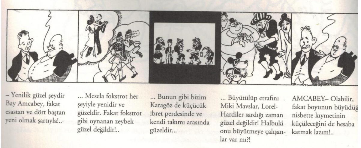
Karikatür 2. Cemal Nadir GÜLER, Akşam, 28.03.1940,S.3.