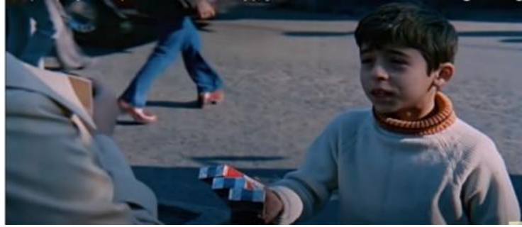
Görsel 22. Taşı Toprağı Altın Şehir adlı filmde sokakta kaçak sigara satmaya çalışan çocuğun temsili, 1978.

1970'lerde kimi aileler, çocuklarına ayakkabı boyacılığı vb. işler yaptırmaktadır. Çocuklar kalabalık cadde ve sokaklarda simit vb. mamuller satmaya çalışır. Usta çırak ilişkisini aşacak biçimde, kimi çocukların sanayi vb. alanlarda ağır işlerde çalıştırıldığı görülür. Kimi çocukların aileleri tarafından dilendirildiği dahi vakidir. Bunun yanında sahipsiz kimi çocukları değişik şekillerde çalıştıran kimi zaman dilendiren çeteler de türer. Bu durum, 1970'ler boyunca devam filmleri çekilen Sezercik ve Ayşecik filmlerine de yansır (Göreç, Öksüzler, 1973). Bu anlamda Keşanlı Ali Destanı adlı filmin sokakta çalgı çalarak para toplamaya çalışan çocukların görüntüsüyle başlaması ilginçtir (Yılmaz, Keşanlı Ali Destanı, 1964). Sonuç olarak 1970-1980 döneminin çocuk istismarı açısından talihsiz bir devir olduğu söylenebilir.