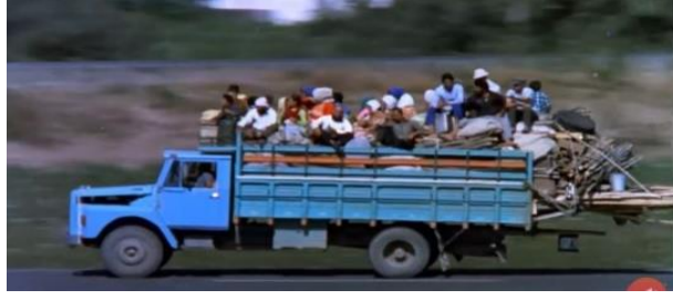
Görsel 9. Kamyon kasasında tika basa insan taşınması (Gören, Endişe, 1974).