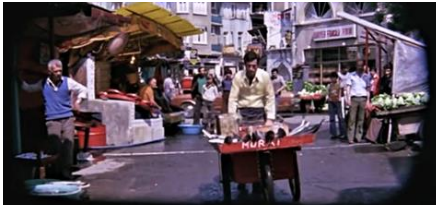
Görsel 4. Seyyar arabada "Murat" yazısı (Seden, Yüz Numaralı Adam, 1978).

Trafik kültürünün olmaması vb. nedenlerle trafik kazası oranları yükselir. 1970'lerde trafik kazası sonucu ölümlerin çok fazla arttığı görülür. Bunda; şehirlerde, yollarda araç yoğunluğunun artması, yol standartlarının düşük olması, eğitim eksikliği gibi nedenler etkili olur. Murat, Anadolu gibi araçların teknik ve dayanıklılık sorunları da burada tartışma konusudur. Trafik kazalarına bağlı olarak ani ölümlerin artması toplumda şok etkisi meydana getirir (Hürriyet, 24 Mart 1977). Bu açıdan toplumda öksüz ve yetim çocuk sayısında artış olur.