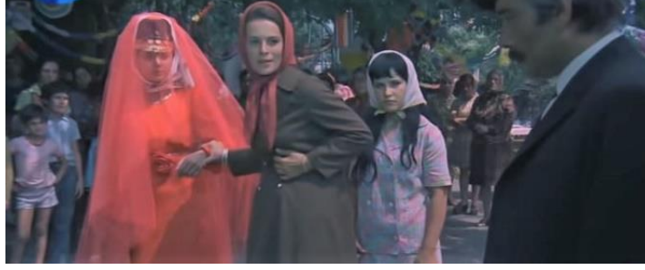
Görsel 13. Düğün filminde çocuk yaşta kardeşinin evlenmesini engellemeye çalışan ablanın ağabeyleri tarafından bıçaklandıktan sonra yarasını tutması. (Akad, Düğün , 1973)