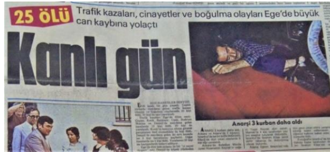
Görsel 26. Boğulma nedeniyle ölüm (Yeni Asır, 18 Temmuz 1978)