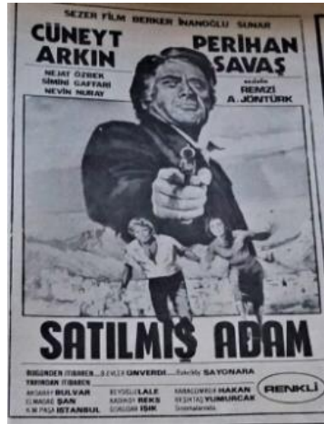
Görsel 11. Satılmış Adam film reklamı. (Hürriyet, 25 Aralık 1977)