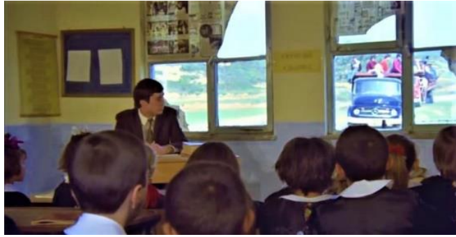
Görsel 27. Kırılmış camların gazete ile örtüldüğü sınıfta ders yapılırken o okulun yeniden yapılabilmesi için kamyonlarla malzeme getiren Çamlıca Lisesi öğrencilerinin okula gelişinin sınıfın içinden görülmesi (Eğilmez, Hababam Sınıfı Uyanıyor , 1976).

Şehirlerde kalabalık sınıflar ciddi sorundur. Öğretmen açığı vardır. Hükûmet bu talebin bir kısmını geçici öğretmenlikle çözmeye çalışır. Hürriyet'in haberine göre bu öğretmenler, kadrolu çalışmak istemektedir. Bu sorun çözülmediği için eğitim ve öğretimde verimliliğin düştüğü iddia edilmektedir (Hürriyet, 24 Temmuz 1977). Aynı zamanda öğretmen yetiştirme politikaları gevşetilir. Kimi öğretmenlerin vasıfsız bir şekilde yetiştirildiği söylenir (Konaklı,