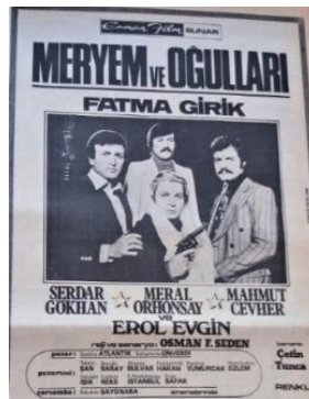
Görsel 20. Meryem ve Oğulları film reklamı (Hürriyet, 13 Mart 1977).