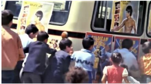
Görsel 7. Arabanın peşinden koşan çocuklar (Yılmaz, Bir Yudum Sevgi, 1984).