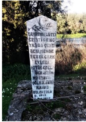
Görsel 25. 1957 tarihli mezar taşı. Çocuk ve genç ölümlerinde önemli bir neden: Boğulma. 19.02.2021, Tekeli Mezarlığı, Koçarlı, Aydın.