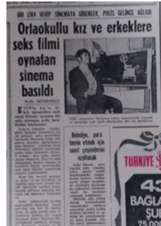
Görsel 17. Çocuklar ve sinema (Hürriyet, 19 Ocak 1971).

Toplumsal çözülmenin, ailenin dağılmasının, gençlerdeki anlayış değişikliğinin aile içi çatışmayı arttırdığı düşünülebilir. İntihar olayları fazlalaşır. Bu durum filmlere yansır (Orbey, Bizim Aile , 1975). Köyden kente göçün artması, kültürel değerlerin erozyona uğraması, yoksulluk, şarkıcı ve sinema yıldızı olmanın bir umut olarak toplumda pazarlanması 1970’ler boyunca evden kaçma olaylarını artırır. O günlerde kayıp kızlar çoğu kez basına haber olur (Hürriyet, 09 Ocak 1977). Kimi filmler bu konuyu işler (Yılmaz, Ah Güzel İstanbul , 1966). Evden kaçan kimi kızların istismara uğradığına dair haberler çıkar (Hürriyet, 9 Ocak 1977). Öbür