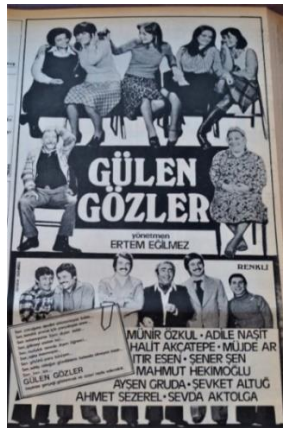
Görsel 30. Gülen Gözler film reklamı

Çocukların beslenebilmesi, eğitim sürecinden yararlanabilmesi için bir takım altyapı çalışmalarından doğrudan devlet ve toplum sorumludur. 1970'ler sürecinde yürürlükte olan 1961 Anayasası da bu minvalde devlete önemli sorumluluklar yüklemektedir. Öteden beri çocuk üretim sürecinin bir parçası olmuştur. Ancak 1960'lara kadar çocuklar köylerde hayvan gütmeye, tarlaya testiyle su götürme şeklinde doğrudan anne ve babalarının yanında, onların gözetiminde, kendi ailesinin tarlasında, kendi ailesi için işin ucundan tutmaktadır. Burada emek sömürüsü ve çocuk istismarından daha çok çocuğun sorumluluk üslenmesi şeklinde bunu düşünmek doğru olacaktır. 1970'lerde köyden kente göç arttıkça Türkiye'de çocuk işçiliği denen bir olgu ortaya çıkacaktır. Sezercik, Ömercik, Ayşecik vb. filmlerde bu filmin kahramanı olan çocuklar aileleri için çalışmaktalar, boylarından daha uzun işlerin üstesinden gelmektedir. Evin iâşesini sağlamak, hasta anneyi tedavi ettirmek küçücük çocukların sorumluluğuymuş gibi filmlerde algı oluşturulmaktadır. Böylece asıl sorumluların sorumlulukları gözden kaçırılmaktadır. Genel anlamda sinemanın bu tutumu çocuk işçiliğini meşrulaştırmıştır denebilir.