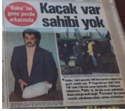
Görsel 21. Kaçakçılık (Hürriyet, 18 Mart 1977).