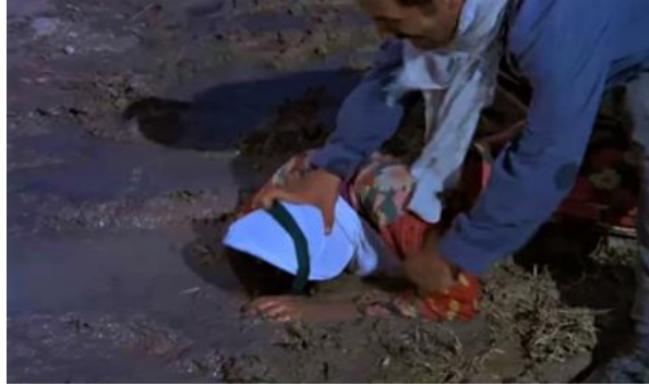
Görsel 15. Evlenmeyi kabul etmeyen kız çocuğunun, babası tarafından şiddete uğraması. (Gören, Endişe , 1974).

Şehirlerde, sokaklarda erkeklerin kadınları kimi zaman onlara laf atma şeklinde taciz ettikleri olur. Yeni Asır gazetesinin haberine göre bunun çocuk yaştaki kişilere kadar indiği anlaşılmaktadır. İzmir'de 14 yaşındaki bir kız, erkeklerin laf atmasından kaçmaya çalışırken kendisine tren çarpar (Yeni Asır, 20 Haziran 1978). Kadınlara laf atma ve onları sokakta takip etme şeklinde taciz etme durumu kimi filmlere de yansır (Refiğ, 1969). 1970 yapımı Sezercik Köprü Altı Çocuğu adlı filmde 7-8 yaşlarındaki Sezercik, bir erkek köpek yavrusuna sahiptir. Sezercik, köpeğini dolaştırmaya çıkarır. Onun bulunduğu yerden aynı yaşlarda bir kız çocuğu dişi köpek yavrusuyla geçer. Sezercik'in köpeğine, "Sana da bana da bir gajo düştü" diyerek köpeği ile birlikte kızı takip etmesi ve ona laf atması oldukça ilginçtir (İnanoğlu T. , 1970).