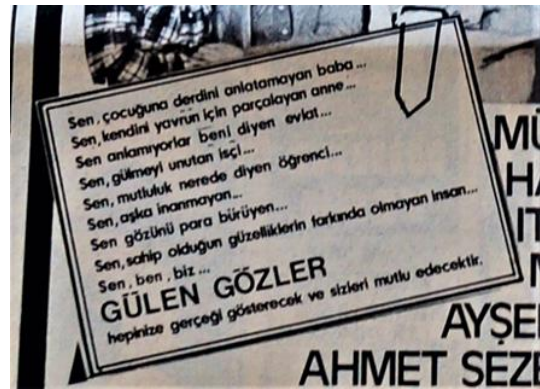
Görsel 31. Gülen Gözler adlı film reklamı ayrıntısı (Hürriyet, 20 Mart 1977)