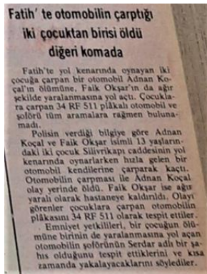
Görsel 6. Çocuklar trafik kazalarında ölüyor (Hürriyet, 17 Mart 1977).

Şehirlerde trafik sorunu baş gösterir. Yayaalara çarpan araçların, kimi zaman çarptıkları yayaları yol ortasında bırakıp kaçtıkları görülür (Hürriyet, 21 Mart 1977). Pek çok kişi ilk yardım nasıl yapılır bilmemektedir. Karga tulumba yaralılar yoldan çevrilen arabalarla hastaneye yetiştirilmeye çalışılır (Akdağ E. C., 2020). Yollar arabalarla dolarken çocukların güvenli oyun alanları çok azdır (Duru, Şoför Nebahat, 1970). O yıllarda artan trafik kazalarından en fazla mağdur olanların çocuklar olduğu görülür. Aynı yıllarda pek çok filmde film kahramanlarının hayatlarının değişmesinde trafik kazaları bir mit olarak kullanılır. Örneğin, Aile Şerefi adlı filmde yoksul ve kalabalık bir ailenin küçük çocuğuna, kural tanımayan bir zengin gencin kullandığı otomobil çarpar. Çocuğa çarpan genç olay yerinden arabasıyla hızla uzaklaşır. Bu, filmde hikâyenin başlangıcını veya tetikleyici etmenini oluşturan olay olur. Filmde çocuğa çarpan gencin aynı ailenin kızına musallat olması sonucunda, ailenin hayatının altüst oluşu anlatılır (Aksoy, Aile Şerefi, 1976). Filmdeki çocuğun kazaya uğraması gibi gerçek yaşamda da karşıdan karşı geçmeye çalışan ve çarpılıp ölen pek çok çocuğun haberi o günlerde gazetelerde yer alır. (Hürriyet, 2 Ocak 1971). Yıllar geçse de bu gerçek uzun süre değişmez (Hürriyet, 17 Mart 1977). Söz konusu gerçekler o günkü sinemada tam bir klişe hâlini alır (Erksan, 1971).