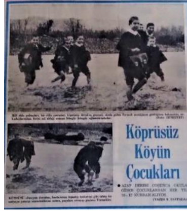
Görsel 24. Köprü yoksunluğu (Hürriyet, 7 Ocak 1971).