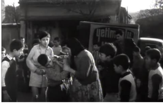
Görsel 29. Karanlıkta Uyananlar adlı filmde bir annenin, futbol oynadığı ve ayakkabısı eskiyeceği için arkadaşlarının arasında çocuğunun kulağını çekmesi (1965).

1970'lerin ikinci yarısından itibaren televizyonlar kısmen ucuzlar. Pek çok insan taksitle televizyon alır. Taksi Şoförü adlı filmde anne-babasından bisiklet isteyen bir çocuğun onlardan “Daha televizyon taksitini ödeyemedik” bağırışları arasında tokat yemesi bu bakımdan önemli bir ayrıntıdır (Gören, Taksi Şoförü , 1976). Bir Türk'e Gönül Verdim adlı filmde Almanya'dan gelen çocuğun etrafında dönebilen roket oyuncuğuyla oynayabilmek için Türk çocuklarının bu oyuncuğu, Alman çocukla kendisini eşeğe bindirme karşılığında takas etmeleri ilginç bir ayrıntıdır (Refiğ, 1969).