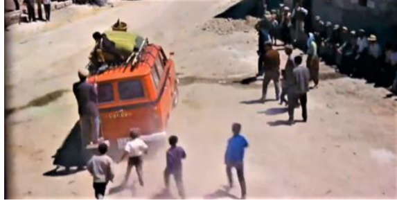
Görsel 10. Araba merdiveninde ve tavanında yolculuk (Güney, Ağıt, 1971)

1971’de iki İngiliz çocuk babalarının işi nedeniyle İstanbul’da yaşamak durumunda kalır. BBC, bu çocukların gözünden bir İstanbul belgeseli yapar. Belgeselde çocuklar arabaların çoğu kez zikzak çizerek trafikte ilerlediğini belirtir. İstanbul’da arabaların çok hızlı gittiğinden ve ani fren yaptıklarından şikâyet ederler. Çocuklar için bu durum çok tehlikelidir. (BBC, İstanbul ve Bristol , 1971 ). Özetle trafik yaşanan sıkıntıların çocukların yaşam haklarını ellerinden aldığı bir gerçektir.