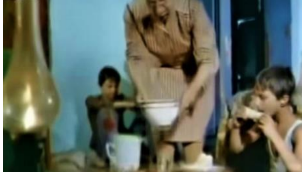
Görsel 28. Gaz lambası (Gülgen, 1979).

2018). Öbür yandan köylere 1970'lerin ortasında elektrik getirilmeye başlanır. Şehirlerde ise gecekondu'lara elektrik getirilmesi konusunda sorunlar ortaya çıkar. 1970'lerde sürekli elektrik kesintileri yaşanır (Gülgen, 1979). O dönemde öğrencilerden sıklıkla duyulan "Elektrikler kesildi onun için ödevimi yapamadım" sözü bir gerçeklikten ortaya çıkar. Gaz lambası varlığını bir müddet daha devam ettirir. Öbür yandan tek odalı evlerde yaşayan çocukların bu durumu onların başarılarını etkiler.