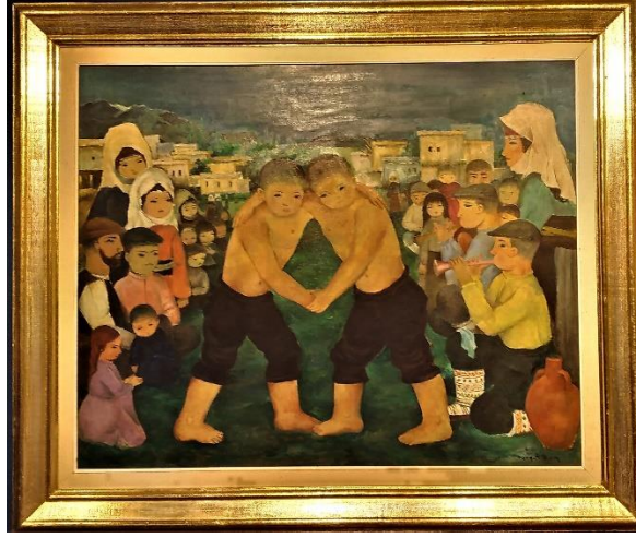
Görsel 1. Turgut Zaim, Gürbüz çocuk idealini yansıtan Tosuncuk adlı tablo.

Ankara Resim Heykel Müzesi, 26 Nisan 2022.