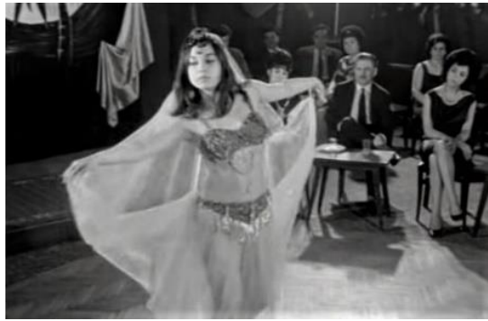
Görsel 18. Pavyon kültürü ve 14 yaşındaki kız oryantal rolde. (Duru, Şoför Nebahat Bizde Kabahat, 1965).

yandan bizatihi sinema sektörünün bir kısmının bu istismarın içerisinde yer aldığı söylenebilir. 14 yaşındaki kızların filmlerde o yaştaki bireyler için kabul edilemez kıyafetlerle oryantal oynattırıldığı görülür (Duru, Şoför Nebahat Bizde Kabahat, 1965). Sezercik Köprü Altı Çocuğu filminde oyuncu kız çocuğu, ana karakter Sezercik'in annesinin ameliyat edilebilmesi amacıyla gerekli parayı toplamak için sokaklarda dans eder. Aynı çocuğun filmde gece kulübünde oryantal dans ettiği de görülür. Hürriyet gazetesinin haberine göre söz konusu çocuk gerçek yaşamda da gazinolarda oryantal dans yapmaya başlar. Çocuğun buradan kazandığı paralarla eğitim hayatını sürdüreceği iddiası ile durum meşrulaştırılır (Hürriyet, 17 Ocak 1971). Bu, o günün anlayışını göstermesi bakımından ilginçtir.