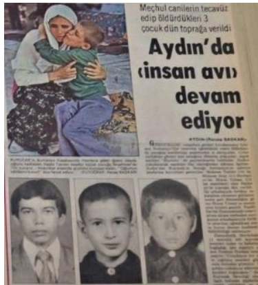
Görsel 16. Çocuk istismarı ve sonrası (Yeni Asır, 28 Haziran 1978).

Böylece çocuk masumiyeti altında kimi yanlışlar sinema eliyle meşrulaştırılır. Aynı filmde Sezercik aynı kız çocuğu ile arkadaşlık yapmaya başlar. Bir başka çocuk, onlara “Biri yer diğeri bakar; kıyamet ondan kopar. Kızı ben de öpeceğim” der. Sezercik de bu çocuğa şiddet uygular. Sonra da kız çocuğuna “Erkeklik öldü mü?” der. Aslında yapılan akran zorbalığını meşrulaştırmaktadır. 1970- 1980 arasındaki dönemde erkek çocuklarının istismar edildiği haberleri basında yer alır (Yeni Asır, 28 Haziran 1978). Bu durum filmlerde de sorun olarak kendisine yer bulur. İnsanları Seveceksin adlı filmde hapisane şartları çok kötü olarak betimlenir. Mahkûmların, çocuk koğuşundaki kimi erkek çocukları para karşılığında istismar ettiği filmde gösterilir. Cüneyt Arkın’ın başrol oynadığı filmin ana karakteri istismara uğrayan aynı çocuklardan birisi tarafından kendisine engel olduğu gerekçesiyle bıçakla yaralanır. Çünkü çocuk buradan alacağı paradan olmuştur. Bunun için de çocuğun hapisane ortamında açlık çekeceği endişesi mevcuttur (Gülgen, 1979). O günlerde basın, mecmua ve sinema ile topluma erotizm aşılmanmaya başladığı görülür. Bu durumun istismar olaylarındaki artışın nedenlerinden birisi kabul edilebilir. Bundan öte sinemalarda başlayan erotik film furyasından çocuklar da etkilenir. Kimi sinemacıların para kazanma hırsı ile çocukların bu tip filmleri izlemelerine izin verdikleri iddia edilir (Hürriyet, 19 Ocak 1971).