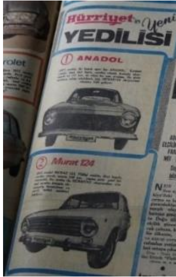
Görsel 2. Gazetelerin kuponla araba kampanyası (Hürriyet, 10 Mayıs 1971).

(Hürriyet , 1 Şubat 1971). Kimi gazeteler, piyango organizasyonları çekilişle bu arabaları verir (Hürriyet, 10 Mayıs 1971). Türk toplumunda Murat, Anadolu gibi arabalara ilgi artar. Bu arabalara olan ilgi ve arzu o dönemdeki filmlere yansır (Seden, Yüz Numaralı Adam, 1978).