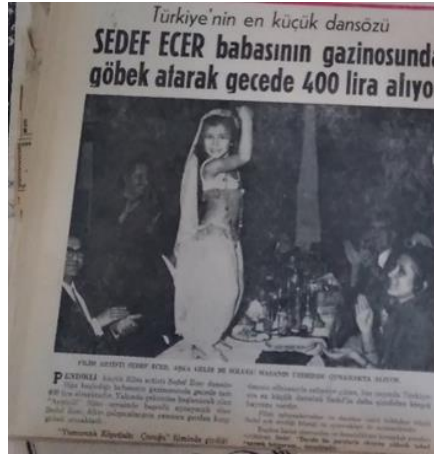
Görsel 19. Küçük kız (Hürriyet, 17 Ocak 1971).

1960'ların ortalarından itibaren Batı'da uyuşturucu kullanımı artınca, özellikle Amerika bunun kaynağının Türkiye olduğunu iddia eder. Türk Hükûmetinden haşhaş ekiminin yasaklanmasını ister. Türk Hükûmeti bu duruma direnir. 12 Mart 1971 Muhtırasından sonra istifa eden Süleyman Demirel Hükûmeti yerine 26 Mart 1971'de Nihat Erim Hükûmeti kurulur. Erim Hükûmeti 29 Haziran 1971'de haşhaş ekimini yasaklar (Cumhuriyet, 30 Haziran 1971). 1970'lerde Türkiye, tıbbi amaçlı morfin üretiminde kullanılan dünya haşhaş üretiminin %55'ini