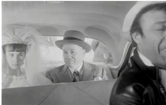
Görsel 12. Yaşlı erkek, çocuk gelin. (Duru, Şoför Nebahat Bizde Kabahat, 1965).