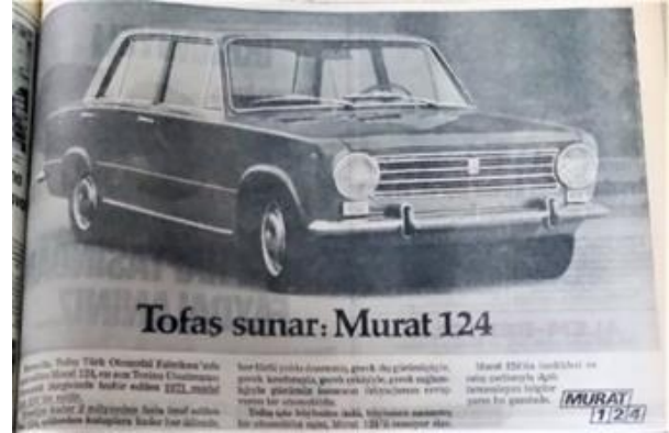
Görsel 3. Murat 124 reklamı (Hürriyet , 1 Şubat 1971).

Trafik kültürünün olmaması vb. nedenlerle trafik kazası oranları yükselir. 1970'lerde trafik kazası sonucu ölümlerin çok fazla arttığı görülür. Bunda; şehirlerde, yollarda araç yoğunluğunun artması, yol standartlarının düşük olması, eğitim eksikliği gibi nedenler etkili olur. Murat, Anadolu gibi araçların teknik ve dayanıklılık sorunları da burada tartışma konusudur. Trafik kazalarına bağlı olarak ani ölümlerin artması toplumda şok etkisi meydana getirir (Hürriyet, 24 Mart 1977). Bu açıdan toplumda öksüz ve yetim çocuk sayısında artış olur.