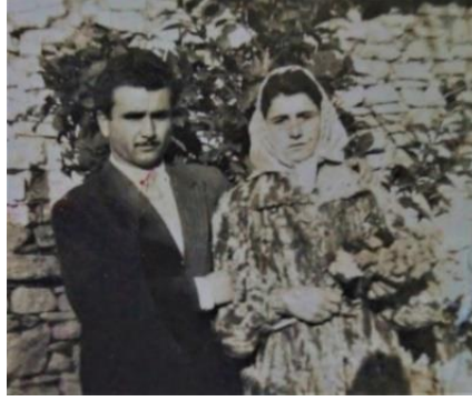
Görsel 14. 1970'ler, çocuk gelin yaşlı erkek.