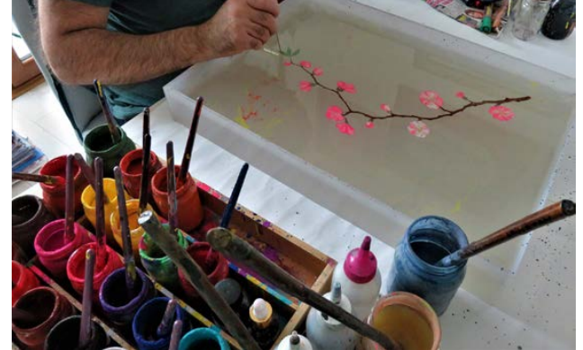
Görsel 2 Su üzerinde kiraz çiçeği (Sakura) ebrusu (A. Can, 2020).

Ebru sanatının diğer sanatlara göre farklılıklarından biri de diğer sanatlarda olduğu gibi sanat icra edilirken bir müddet ara verip kalınan yerden devam edilme şansının olmamasıdır. Bir çini sanatçısı tahririni yapar, günler sonra boyamasını tamamlar, sırlamasını bitirir, istediği bir zaman diliminde çiniyi fırına atar ve büyük bir heyecan ile çiçeklerin ateşte açmasını bekler. Hat, minyatür, tezhip ve kalemişinde ustalar gerekirse günler, haftalar, aylar hatta yıllar sonra yarım kalan işini, eserini tamamlayabilir. Bu anlatılanlar ebru sanatı için geçerli bir yöntem değildir. Çünkü ebrucu tekne başındayken kısıtlı bir vakte sahiptir ve o kısıtlı vakitte eser çıkartma sürecine tabidir. Ebrucunun, ebrusunu yaparken işini eksik/yarım bırakıp bir saat, bir gün, bir hafta sonra o işe kaldığı yerden devam etmesi geleneksel manada ve bu yüzyılda pek de mümkün görünmemektedir. Ebru sanatı, tıpkı insan yaşamı gibidir. İnsanoğlu kendisi için ayrılan zaman dilimi dışına çıkamadığı gibi ebru sanatı da belli bir zaman dilimi içinde icrası yapılması zorunlu bir sanattır. Bu nedenle de kısıtlı zaman diliminde eser üretme çabası açısından diğer geleneksel sanatlardan çok büyük bir farklılık arz ettiği aşikârdır.