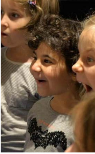
Görsel 4 Ebru sanatı ile ilk kez karşılaşan çocukların şaşkınlığı ve mutluluğu - Uluslararası Çocuk Ebru Sergisi (A. Can, 2016, Çekya).

Geleneksel Türk ebru sanatı çok kıymetli bir sanat. Çünkü ebru sanatı icra edeni, seyredeni keyiflendiren, ona huzur ve mutluluk veren bir sanat dalı (Görsel 4). Son yıllarda yabancı ülkelerden insanlar ebru sanatı ile tanıştıklarında farklı duygular yaşadıklarını, yenilindiklerini, mutlu olduklarını, zihinsel anlamda rahatladıklarını belirtmektedir.