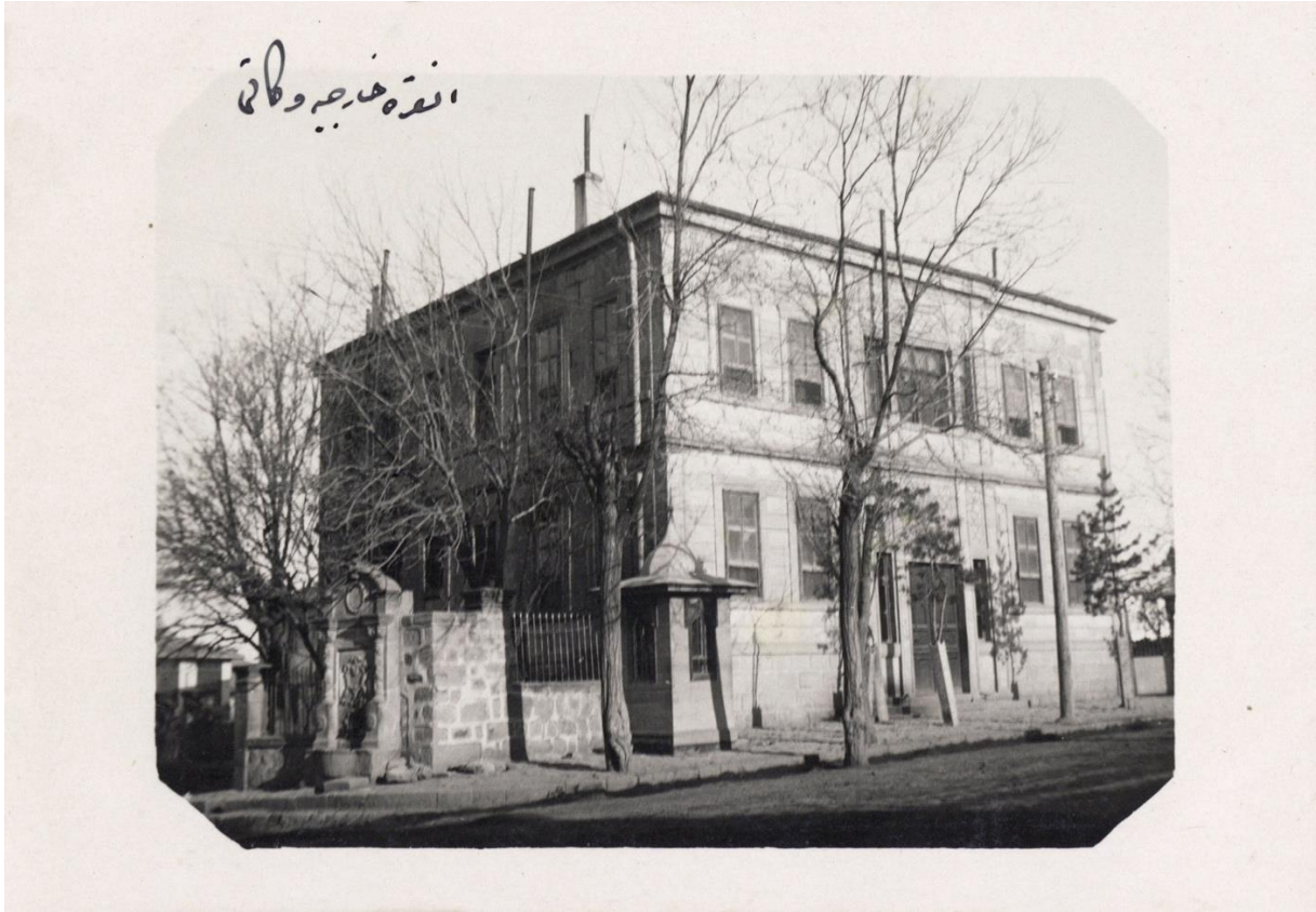
Ek 2. Yapının Reji İdaresi'nin yanı sıra Hariciye Nezareti ve Düyûn-ı Umûmiyye İdaresi tarafından kullanıldığı da tespit edilmiştir ( https://archives.saltresearch.org/handle/123456789/201496 , Erişim Tarihi: 02.02.2022).