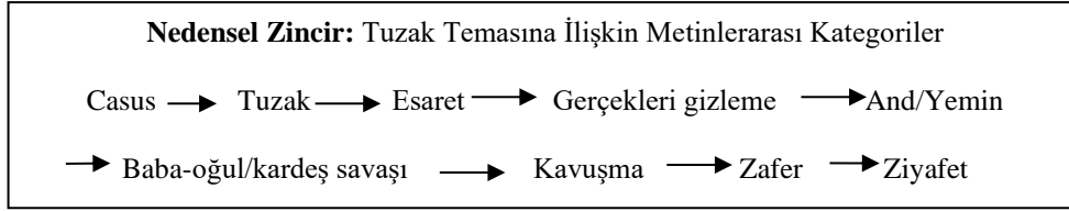
Şekil 2: Ele Alınan Hikâyelerin Tuzak Temasına İlişkin Metinlerarası Kodlarının Nedensel Zincir Modeli ile Gösterimi

“Salur Kazan’ın Tutsak Olup Oğlu Uruz’un Kurtardığı Hikâyesi” ve “Uşun Koca Oğlu Segrek” Hikâyelerinin metinlerarası kodlarının nedensel zincir modeli ile gösterimi Şekil 2’de sunulmuştur.