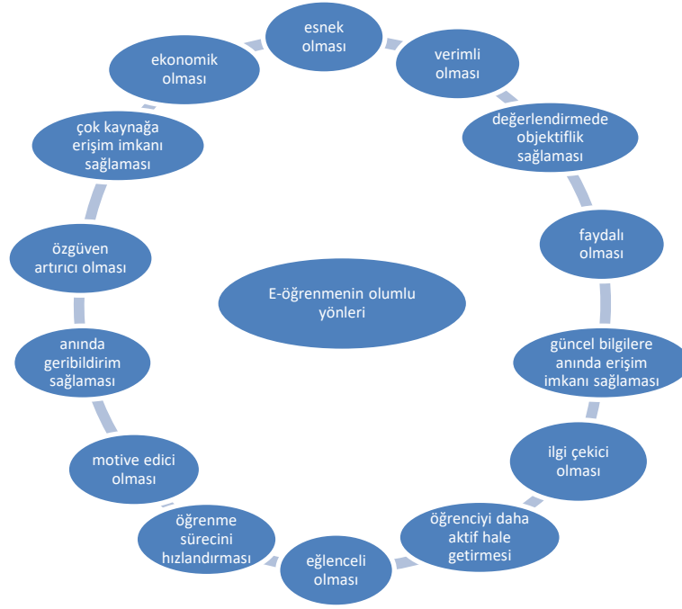
Şekil 2: E-öğrenmenin olumlu yönleri

Mevcut çalışmanın bu bölümünde e-öğrenme uygulamalarının yabancı dil öğretiminde kullanımının katılımcı görüşlerine göre meta-tematik analizi yapılmış ve ulaşılan bulgular sunulmuş ve yorumlanmıştır. Araştırmaların analizi sonucunda iki tema belirlenmiş ve bu temaların altındaki kodlar iki modelle görselleştirilmiştir (Şekil 2 ve Şekil 3). Tema başlıkları, “E-öğrenmenin olumlu yönleri (Şekil 2)” ve “E-öğrenmenin olumsuz yönleri (Şekil 3)” şeklindedir.